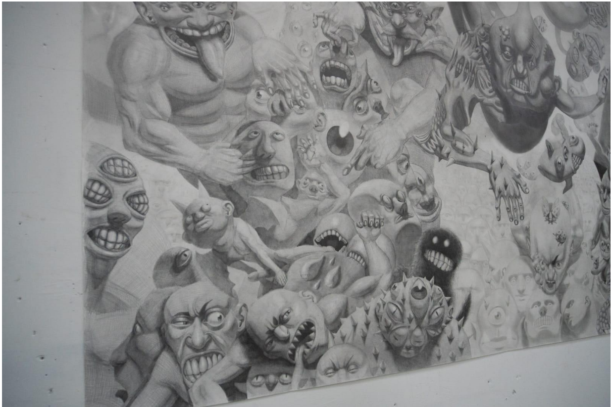
Slika 3. „Inferno”, detalj, lijeva strana rada