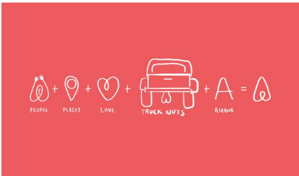
Slika 2. Brend filozofija AirBnB-a

Jedan od sjajnih primjera brenda koji se uspješno koristi digitalnim kanalima za komunikaciju s publikom jest Airbnb. Na društvenim mrežama poput Instagrama i Twittera , Airbnb ne samo da dijeli vizualno atraktivne sadržaje svojih jedinstvenih smještajnih ponuda, nego i aktivno sudjeluje u komunikaciji s korisnicima odgovarajući na pitanja i komentare u stvarnome vremenu. Osim toga, platforma rabi recenzije korisnika kao ključan alat za izgradnju povjerenja među potencijalnim gostima. Pomoću tih online interakcija, Airbnb povećava svoju vidljivost, jača povezanost sa zajednicom te stalno poboljšava percepciju svojega brenda kao pouzdanoga i inovativnoga rješenja u svijetu smještaja.