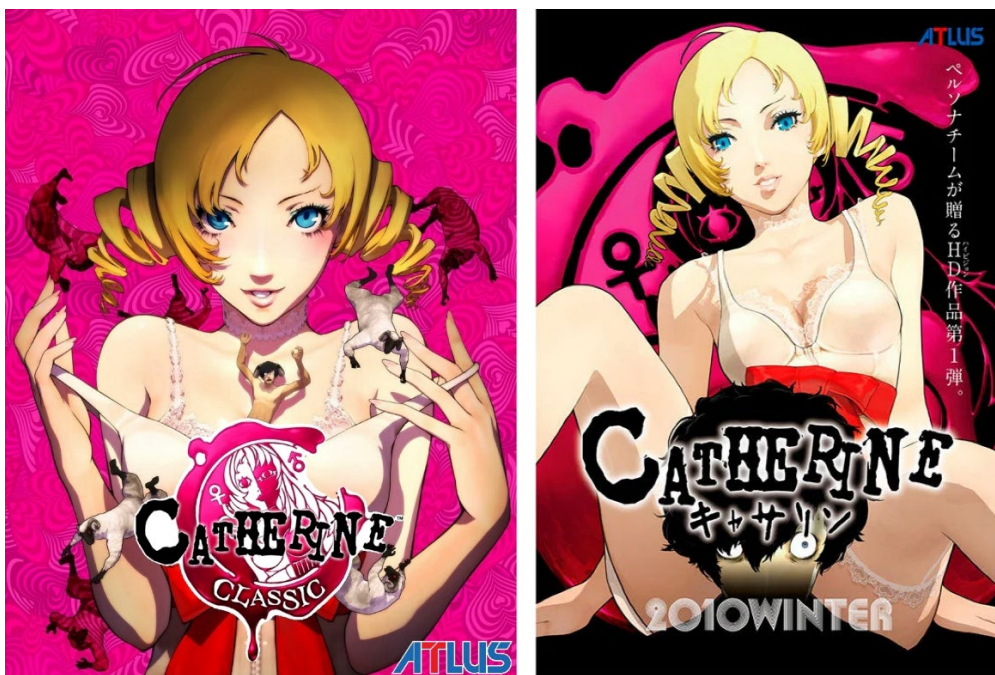
Slika 6 Lik Catherine na naslovnici igre (lijevo) i na promo materijalu (desno)

Što izdvaja Catherine od prijašnjih primjera jesu duboke teme koje istražuju kompliciranost romantičnih veza i osobne odgovornosti, a koje su popraćene i nošene u nekim dijelovima i promo materijalima, s pomalo izazovnim i seksualiziranim dizajnom likova. Lik koji se nalazi u takvim materijalima i situacijama jest sam lik Catherine. Ona je prikazana kao mlada i zgodna djevojka, plave kose i modro plavih očiju. U igri uvijek nosi kratku i izazovnu bijelu haljinu koja više izgleda kao spavačica, ispod koje se uvijek prozire čipkasto donje rublje, s crvenim pojasom s mašnom oko struka. U ostalim promo materijalima poput naslovnica igre ili glazbenog diska, i kad nije u toj odjeći, uvijek je u uskoj ili kratkoj odjeći koja se može smatrati izazovnom i ponekad erotičnom. Uz odjeću su i poze u kojima je prikazana na tim ilustracijama uvijek seksualizirane i namjera im je izazvati potrošačevu pažnju. (slika 6)