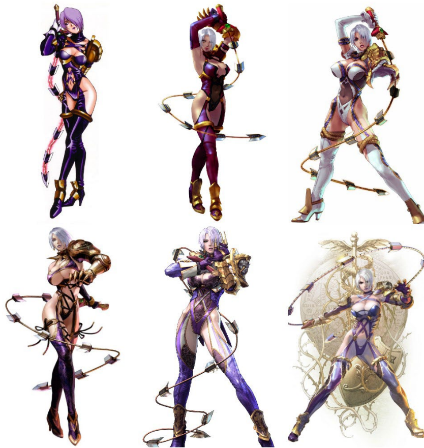
Slika 2 Kostimi Ivy Valentine kroz serijal Soul Calibur (1998. - 2018.)

Uz odjeću, ženski likovi u ovom serijalu često su stavljeni i animirani na takav način ne bi li se istaknula i naglasila njihova seksualnost. Ostali ženski likovi, kao što su Taki i Sophitia, također su prikazani s prenaplašenim atributima i proporcijama tijela, te su uz Ivy prikazane u sugestivnim pozama za vrijeme igranja i u unaprijed animiranim filmovima u igri kojima se potpomaže prenošenje priče. (vidi slike 3 i 4)