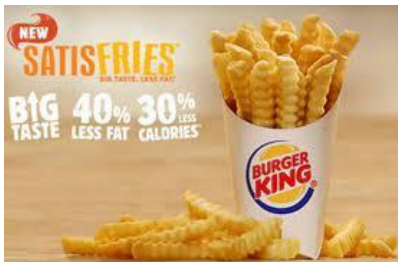
Slika 8. Prikaz propagandnog oglašavanja

Reklame za hranu, pogotovo brzu hranu koriste propagandu kako bi naglasile pozitivne strane, a negativne smanjili ili ljude natjerali da ih u potpunosti zanemare. Reklamiranje, oglasi ili plakati za brzu hranu pokušavaju natjerati ljudsko oko da ignorira nezdravost, a primijeti naglašen ukus hrane. Na primjer reklama za Burger King na kojoj je velikim slovima naglašeno 40% manje masti i 30% manje kalorija. Ovo je oblik manipulacije jer ljudi vide što je naglašeno te automatski zaborave činjenicu da gledaju u nezdravu hranu.