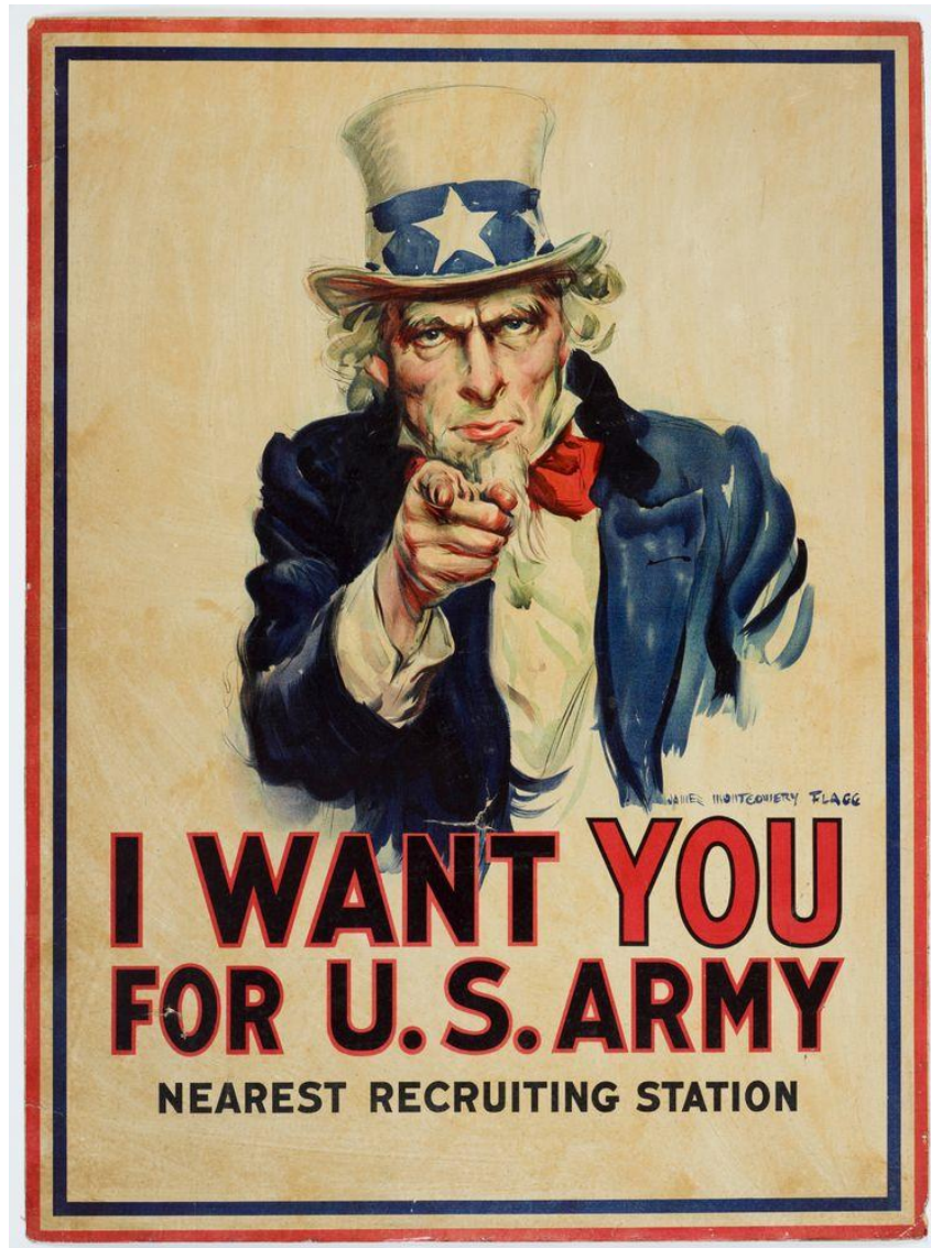
Slika 4. Prikaz ratne propagande

S druge strane, ratna propaganda se služi slikama, sloganima ili govorima kako bi ponizila i moralno uznemirila protivnika. U Drugom svjetskom ratu, Sjedinjene Američke Države su ismijavale neprijatelja tako što su prikazale Adolfa Hitlera sa spuštenim hlačama. Ratna propaganda može ići i u smjeru uvjeravanja protivnika da ih vođa vara te da se trebaju okrenuti protiv njega. Propaganda je u ratu imala mnogo strana i načina na koje se mogla koristiti.