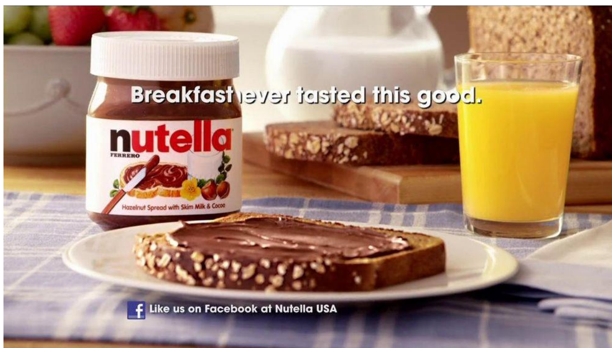
Slika 6. Prikaz propagandne reklame Nutelle: Izvor: https://www.ispot.tv/ad/7VuF/nutella-breakfast-time

U današnje vrijeme mnogi koriste influencere ili poznate osobe kako bi proširili svoj proizvod ili uslugu. Poznate osobe već imaju određeni utjecaj na mišljenje javnosti jer se smatraju važnim osobama koje znaju izabrati valjani proizvod. Organizacije u svrhu promoviranja proizvoda ili usluga propagandno koriste poznate osobe jer imaju utjecaja na mišljenje. Influenceri putem svojih stranica promoviraju proizvod te objašnjavaju zašto je najbolji, na koji način poboljšava život te druge slične informacije kako bi pridobili publiku. Na taj način je Blanca Suarez promovirala Guerlain , red kozmetike i šminke. Razloge je navela u videu kojeg je snimila za proizvode, ali i u mnogim člancima, kao na primjer na Svjetski dan usana izašao je članak u kojemu hvali ruž za usne iz kolekcije Guerlain .