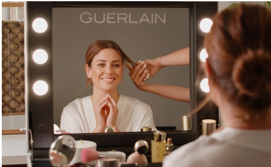
Slika 7. Prikaz propagandnog promoviranja od strane poznate osobe

Reklame za hranu, pogotovo brzu hranu koriste propagandu kako bi naglasile pozitivne strane, a negativne smanjili ili ljude natjerali da ih u potpunosti zanemare. Reklamiranje, oglasi ili plakati za brzu hranu pokušavaju natjerati ljudsko oko da ignorira nezdravost, a primijeti naglašen ukus hrane. Na primjer reklama za Burger King na kojoj je velikim slovima naglašeno 40% manje masti i 30% manje kalorija. Ovo je oblik manipulacije jer ljudi vide što je naglašeno te automatski zaborave činjenicu da gledaju u nezdravu hranu.