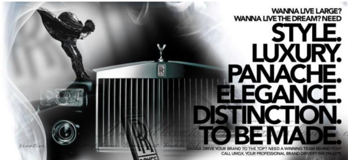
Slika 11. Prikaz reklame za automobil