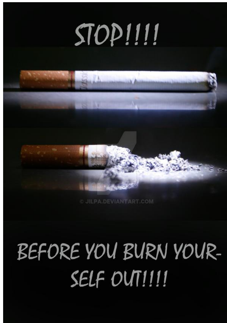
Slika 2. Prikaz propagandnog utjerivanja straha

Iako je politička propaganda bila nešto korištenija prije i dalje se razni političari vole koristiti njome. Na taj način se gradi mentalna slika. Drugim riječima, političari će iznijeti rješenja koja će riješiti svjetske krize, zločine, ratove ili bilo kakve druge probleme u svijetu, a ljudi će si u glavi zamisliti sliku svijeta bez tih problema. Na taj način političari prisvajaju publiku kao i njihove glasove i potporu. Najbolji primjer za to je slika Obame ispod koje je riječ hope (hrv. nada). U ovom smislu nada nosi veliku moć jer publici govori da mu trebaju vjerovati te da trebaju imati nade.