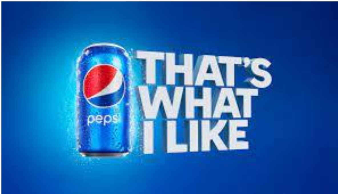
Slika 9. Prikaz Pepsi reklame

Propaganda blistave općenitosti je tipično propagandno sredstvo. Svrha usvajanja kričave općenitosti je uvjeriti publiku da podrži određenu ideju, osobu ili proizvod. Fraze na takvim propagandnim reklamama često su poziv ljudima da se povežu s uvjerenjima koje trenutno imaju ili žele imati. Primjer takve reklame je Pepsi reklama koja ima slogan „To mi se sviđa“ te prikazuje povezanost ljudi s brendom.