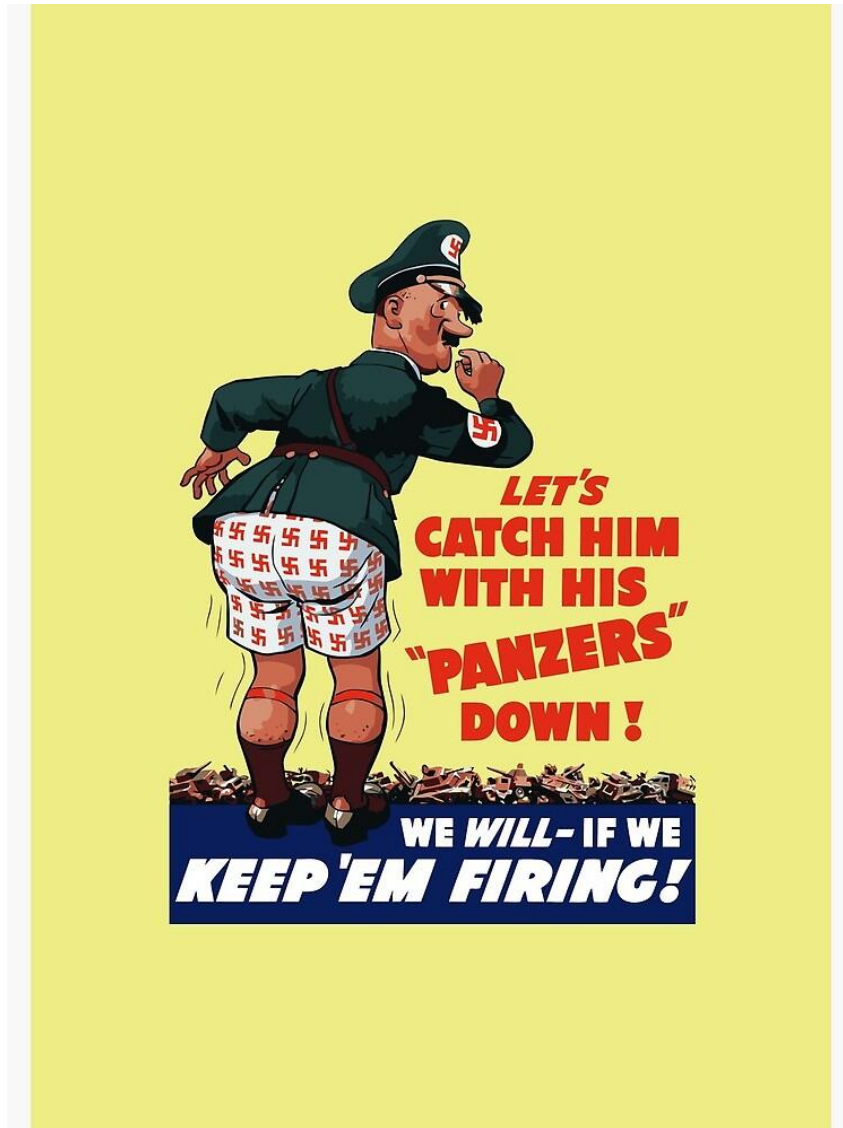
Slika 5. Prikaz ratnog provociranja propagandom