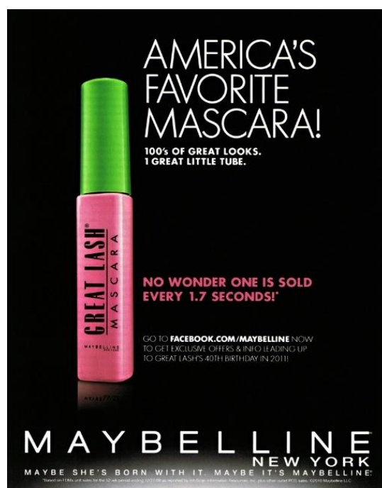
Slika 1. Prikaz oglašavanja tvrtke Maybelline