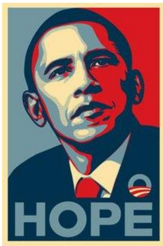
Slika 3. Prikaz političke propagande