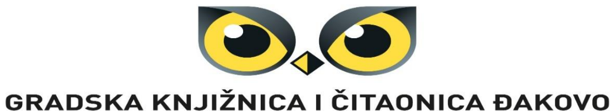
Slika 2. Logo Gradske knjižnice i čitaonice Đakovo