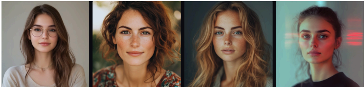
Slika 11. Slike generirane programom Midjourney koje prikazuju socijalne radnice.