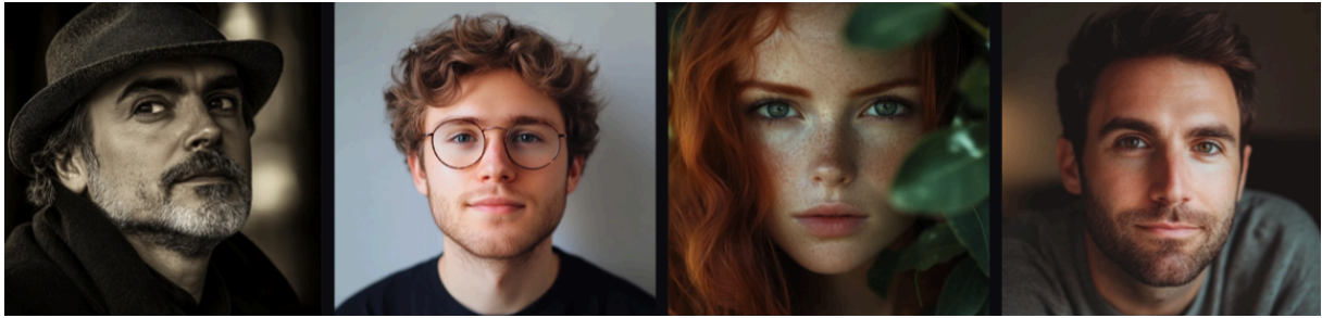
Slika 4. Slike generirane programom Midjourney koje prikazuju autore/ice.