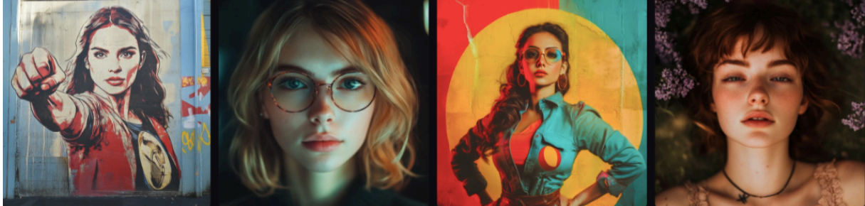
Slika 9. Slike generirane programom Midjourney koje prikazuju feministice.