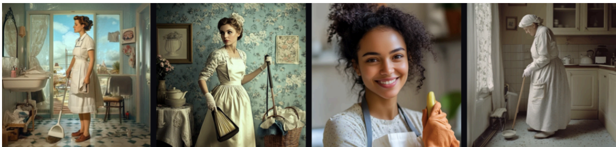
Slika 10. Slike generirane programom Midjourney koje prikazuju kućepazitelje.