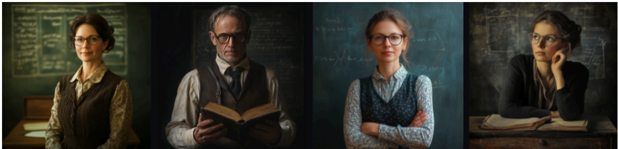
Slika 6. Slike generirane programom Midjourney koje prikazuju učitelje/ice.