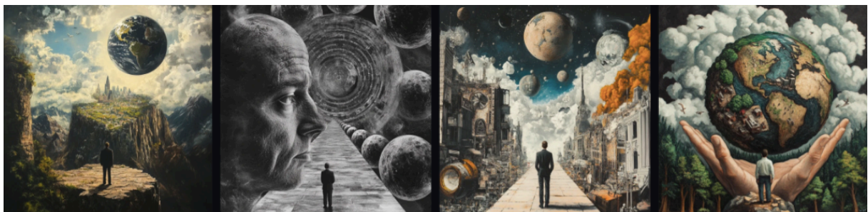
Slika 13. Slike generirane programom Midjourney koje prikazuju svijet vođen od strane muškaraca.