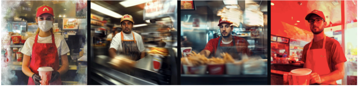
Slika 7. Slike generirane programom Midjourney koje prikazuju radnike/cu brze hrane.