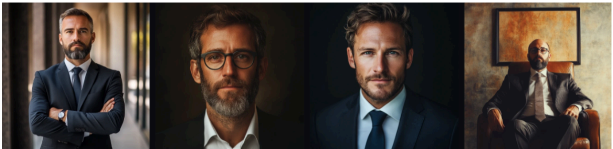
Slika 8. Slike generirane programom Midjourney koje prikazuju CEO-a.