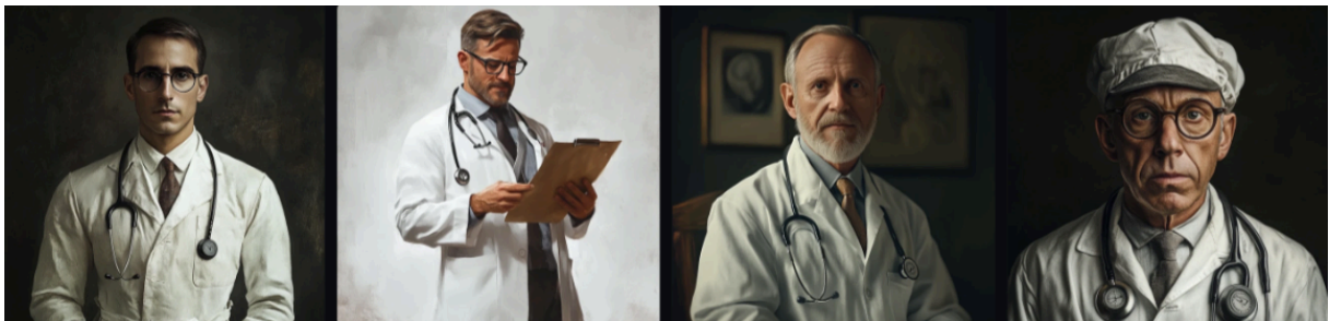
Slika 3. Slike generirane programom Midjourney koje prikazuju doktore.