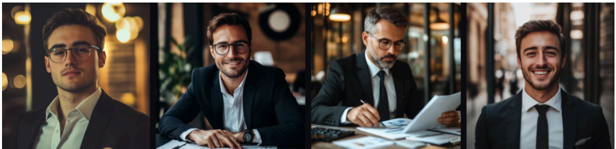
Slika 2. Slike generirane programom Midjourney koje prikazuju financijske direktore.