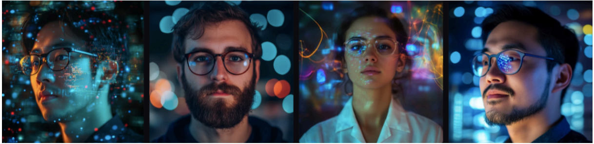
Slika 1. Slike generirane programom Midjourney koje prikazuju podatkovne znanstvenike/cu.