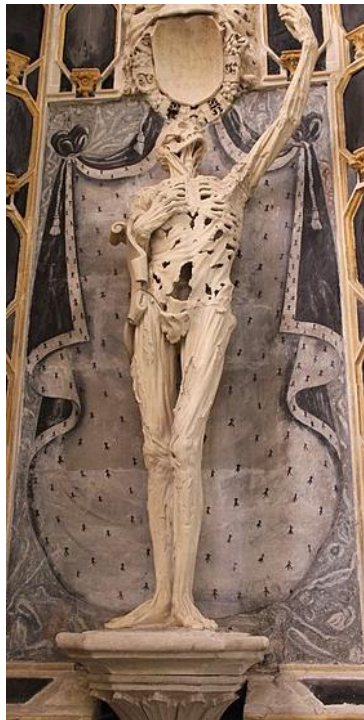
Slika 9. Ligier Richier Transi skulptura Renéa de Chalona, 1544.-1557., mramor i vapnenac, visina 170 cm

osušeno tijelo kako drži vlastito srce u zraku. Obično su skulpture heroja koji poginu u bitci isklesane pompozno, prikazujući hrabrog borca s žestokim stavom, zastrašujućim mišićima i odlučnim izrazom lica, ali u slučaju Renéa de Chalona nije tako. Kad je došlo vrijeme za obilježavanje princa u kamenu, renesansni francuski kipar Ligier Richier isklesao je truli leš s isjeckanim mišićima koji su padali s kostiju i kožom koja je visjela u preklopima preko šupljeg kostura. Lubanja kostura gleda prema podignutoj lijevoj ruci - izvorno je ova ruka držala prinčevo stvarno osušeno srce 13 . Time je ispunjena njegova navodna samrtnička želja, da njegova grobnica prikazuje njegovo tijelo kakvo će biti tri godine nakon njegove smrti. Skulptura je izložena u crkvi Saint-Étienne u francuskom gradu Bar-le-Duc, a smještena je iznad oltarne pale od isklesanog mramora i vapnenca. Iako se skulptura pripisuje Ligieru Richieru, ostali dijelovi, poput grba i poderane draperije, dodani su u 16. i 18. stoljeću. 18. lipnja 1898., proglašena je povijesnom skulpturom, a grobnica je premještena na čuvanje u Panteon u Parizu tijekom Prvog svjetskog rata, prije nego što je vraćena u Bar-le-Duc 1920. godine. Skulptura i oltarna pala restaurirani su između 1998. i 2003., a replike se nalaze u Musée Barrois u Bar-le-Ducu i Palais de Chaillot u Parizu. 14