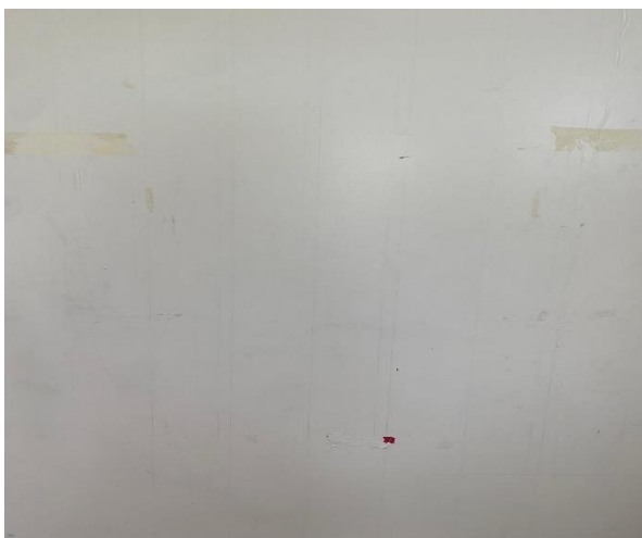
Slika 10. Bijela pozadina u koju učenik gleda