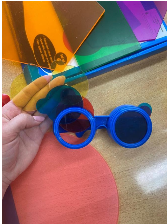
Slika 9. Didaktičko pomagalo – naočale

Na pomagalima se može vidjeti tekućina koja se nalazi unutar plastike. Učenici protresanjem pomagala mogu vidjeti miješanje boja. Učiteljica je zatim Luki dala još jedno pomagalo – didaktičke naočale (Slika 9.), na kojima se može promijeniti boja stakla ili dodati još jedna boja.