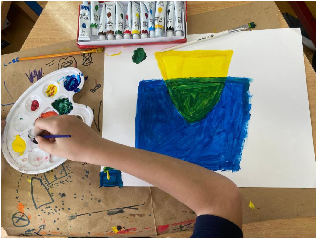
Slika 7. Prikaz dobivene zelene boje u doticaju žute i plave boje

Sljedeći zadatak bio je pokušaj kopiranja umjetničkog rada Paula Kleeja jer kopiranjem radova svladavaju motoriku i tako možemo vidjeti učenikovu percepciju. Slušanje glazbe tijekom rada učenike je motiviralo i dodatno ih opuštalo. Kao pojašnjenje o miješanju boja učiteljica je pokazala dodatna didaktička pomagala (Slika 8.).