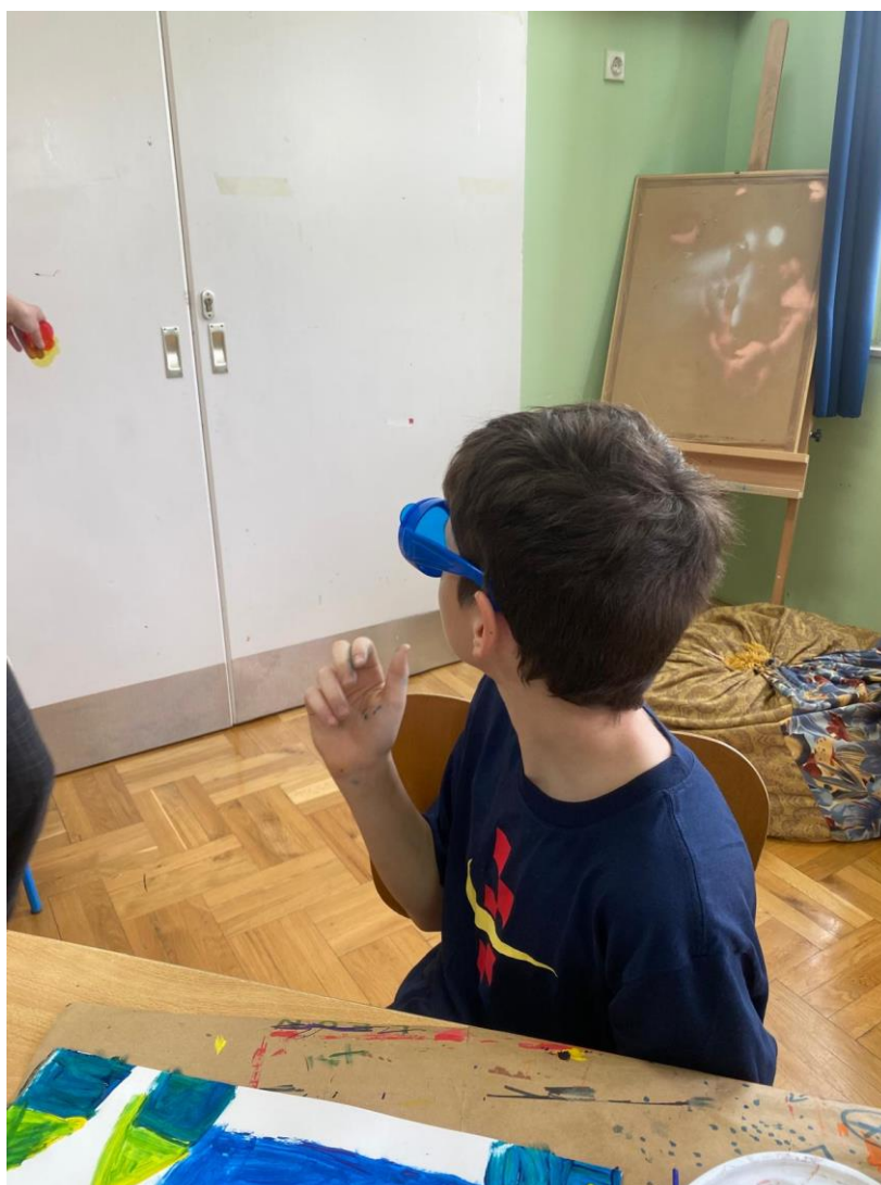
Slika 11. Luka se koristi naočalama