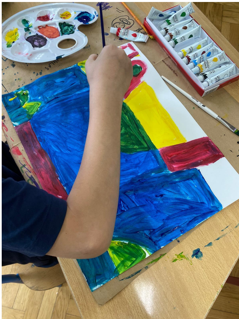
Slika 12. Luka uspješno završava zadatak

Nakon upotrebe pomagala učiteljica je učenicima napomenula da pokušaju sami dodati ostale čiste boje i naslikati kućice. Također, tijekom slikanja učiteljica je često napominjala učenicima da nakon korištenja određene boje isperu kist kako ne bi pomiješali boje i kako bi dobili čiste boje na papiru. Luka je često sam uspješno dodavao boje (Slika 12.) te na kraju bio zadovoljan učinjenim (Slika 13.). Na njegovu licu mogla se vidjeti sreća i uredno je odgovarao učiteljici na postavljena pitanja. Učnički radovi vrednuju se ocjenama od 3 do 5. Nedovoljne ocjene nema jer je u ovoj školi nastava prilagođena mogućnostima učenika.