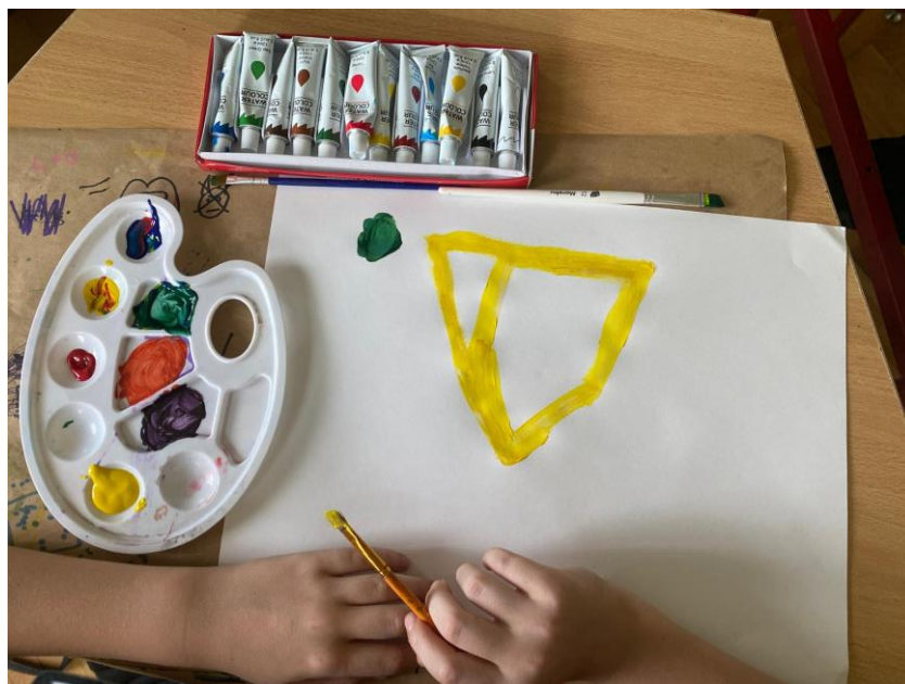
Slika 5. Postavljeni žuti trokut

Zadatak je bio naslikati trokut čistih boja, a korištena je žuta boja pomoću pomagala žutog trokuta prikazanog na slici (Slika 5.). Pomoću pomagala Luka je postavljao točke kako bi mogao rukom povući linije te naslikati žuti trokut. Tom vježbom Luka je vježbao motoriku ruku.