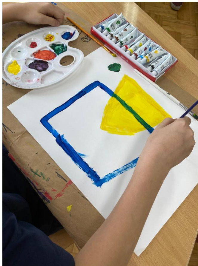
Slika 6. Dodavanje plavog kvadrata

Tijekom rada učiteljica je često davala smjernice i govorila učenicima što im nedostaje na radu, koliko još boje trebaju dodati, upozorila na linije koje nisu dobro povukli i pomagala im u dobivanju određene boje. Također, ponavljala je učenicima što trebaju raditi. Uslijedilo je spajanje geometrijskih likova, tj. učenici su spojili kvadrat i trokut. Kvadrat je bio plave boje, a trokut žute boje (Slika 6.). Kada je učiteljica spojila geometrijske likove, učenici su mogli vidjeti kako doticanjem kvadrata i trokuta dobivaju zelenu boju (Slika 7.). Učiteljica je pokazala umjetničku reprodukciju Paula Kleeja i postavila pitanja Luki: „Možeš li zamisliti grad?“, „Vidiš li krovove?“, „Što još vidiš na radu?“, „Vidiš li možda stablo?“. Luka je uspješno uviđao motive i znao je odgovoriti na postavljena pitanja. Nakon prikazane umjetničke reprodukcije i geometrijskih likova učenici su shvatili kako se dobije zelena boja i morali su je dodati na svoj rad. Luka je to uspješno svladao.