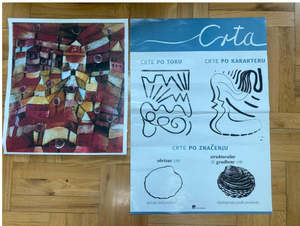
Slika 3. Paul Klee, Vrt ruža , 1920. godina, likovni element: crta