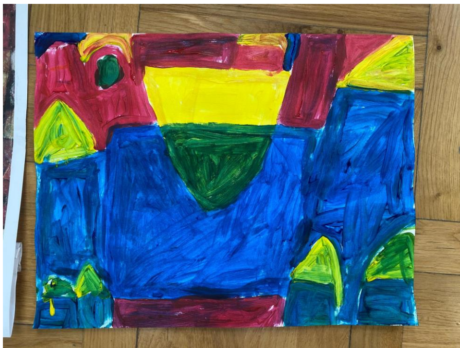
Slika 13. Lukin rad

Učiteljica je često postavljala Luki pitanja poput: „Što si danas radio, možeš li mi ponoviti?“, „Što misliš, čiji su radovi uspješno odrađeni?“, „Imaju li svi prikazane čiste boje na radovima?“. Luka je uspijevaio odgovoriti na pitanja i zamijetio uspjeh na radovima. Učiteljica je kontinuirano napominjala kako je potrebno iza sebe ostaviti uredan i čist prostor pa su učenici sa zadovoljstvom pospremili svoj radni prostor nakon završenog sata. Učenike treba poticati na rad i pospremanje jer im to stvara samopouzdanje. Ako im se kaže da su „umjetnici“ i da je to njihov umjetnički rad, time im podižemo samopouzdanje i stvaramo osjećaj ugone i zadovoljstva.