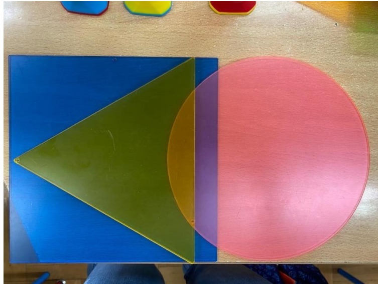
Slika 4. Likovna pomagala – geometrijski likovi

Učiteljica je pokazala geometrijske likove (Slika 4.) i postavljala učeniku pitanja o bojama likova. Luka je uspješno odgovarao na postavljena pitanja.