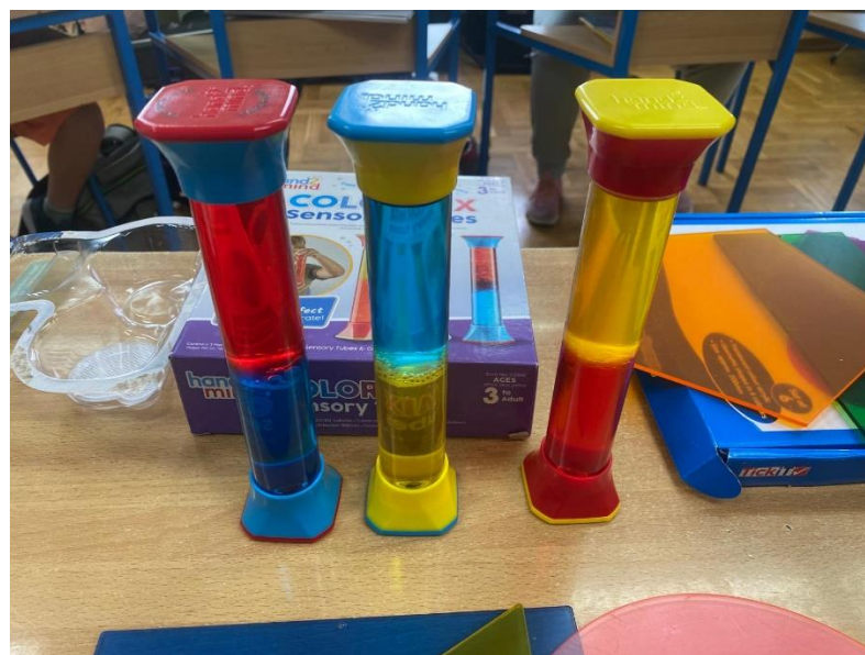
Slika 8. Didaktička pomagala

Sljedeći zadatak bio je pokušaj kopiranja umjetničkog rada Paula Kleeja jer kopiranjem radova svladavaju motoriku i tako možemo vidjeti učenikovu percepciju. Slušanje glazbe tijekom rada učenike je motiviralo i dodatno ih opuštalo. Kao pojašnjenje o miješanju boja učiteljica je pokazala dodatna didaktička pomagala (Slika 8.).