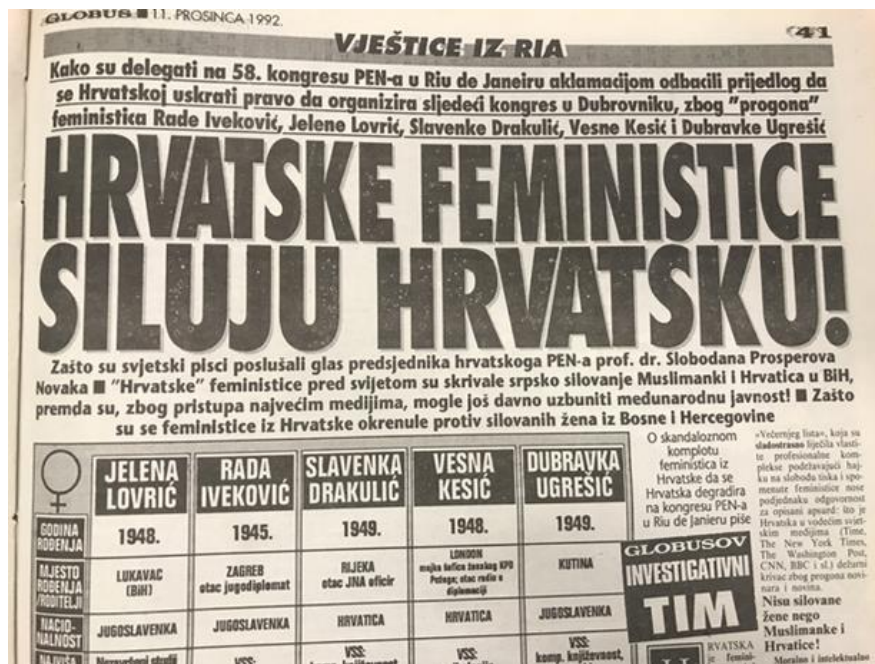
Slika 1. Članak iz Globusa „Hrvatske feministice siluju Hrvatsku“