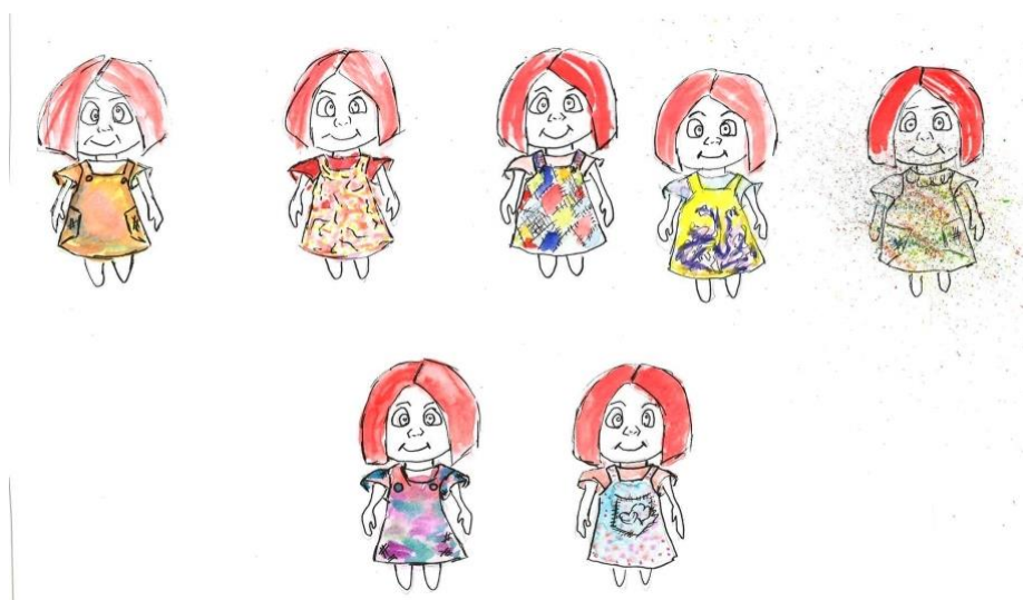
Slika 4: Likovna razrada – Bela

Kada sam oblikovala ženski lik, Belu, željela sam prikazati empatičnu i brižljivu djevojčicu iz koje zrači nježnost i prijateljstvo. Željeni karakter pokušala sam oblikovati isticanjem tih osobina na pojednostavljenom licu lutke te kostimom. Tako je nastala Bela s velikim nježnim očima i naglašenim trepavicama, blago nasmiješenim usnama i rumenim obrazima. Odjenula sam joj suknju A kroja i majicu.