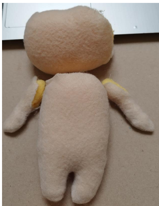
Slika 13: Presvlačenje ruku flisom