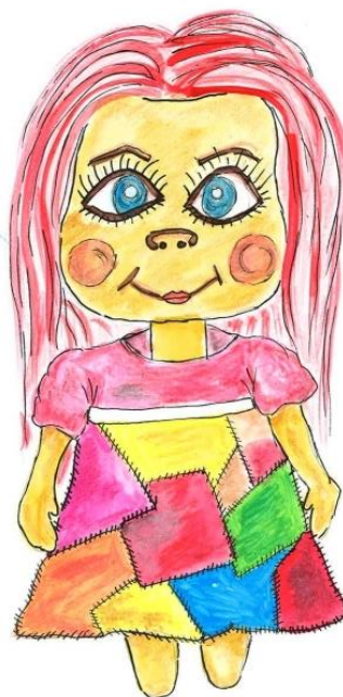
Slika 6: Bela