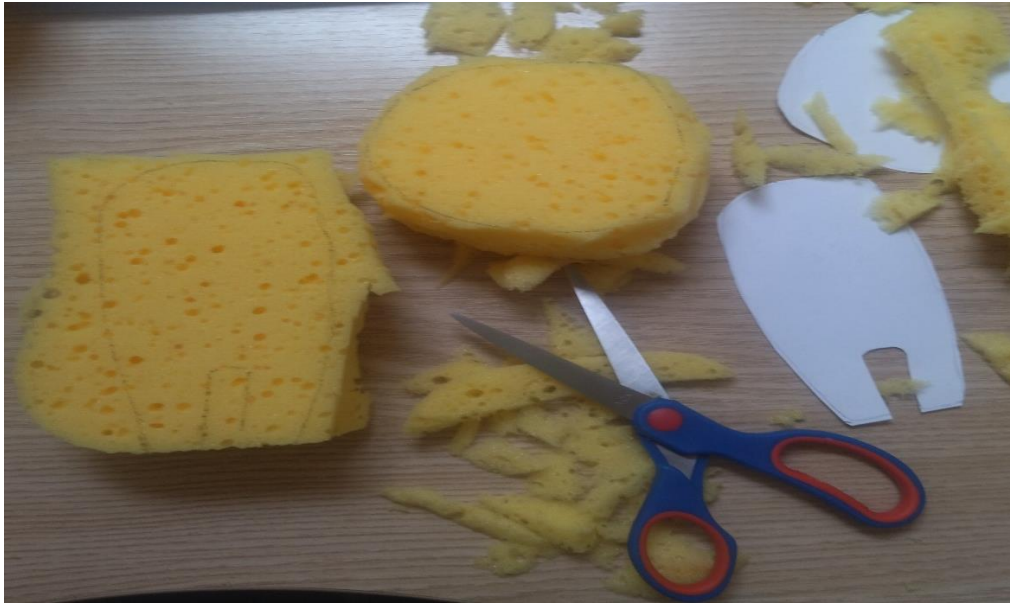
Slika 9: Modeliranje tijela lutke

Lutke su izrađene od spužve, flisa i vune. Izradu sam započela modeliranjem glave i tijela od spužve debljine 5 cm, dok sam ruke napravila od spužve debljine 2 cm. Zatim sam oblikovala rubove i zalijepila ih univerzalnim ljepilom Neostik.