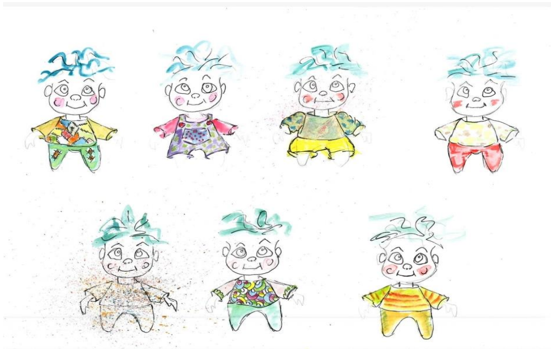
Slika 2: Likovna razrada – Vige