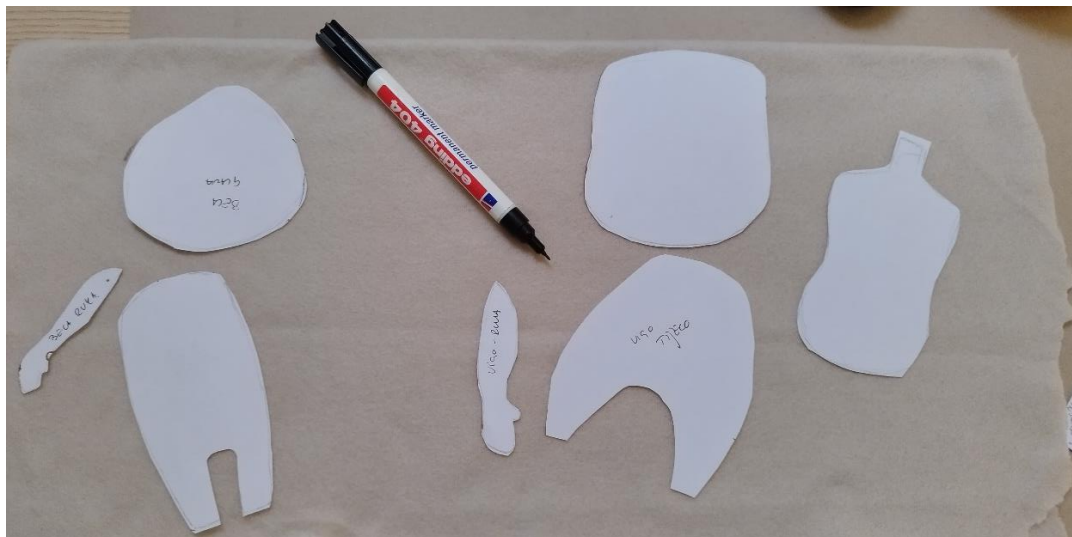
Slika 10: Krojni dijelovi na materijalu (flis)