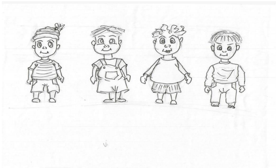
Slika 1: Idejne skice Vige