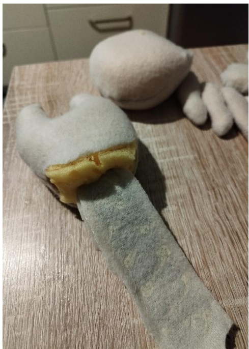
Slika 11: Tapetarska vrpca

Dok su se dijelovi lutaka sušili, iskrojila sam tkaninu od flisa kojom sam presvukla glavu, tijelo i ruke. S obzirom na to da pomična glava daje dinamiku i realizam lutkama te ih čini vizualno privlačnijima, lutke izgledaju življe i privlačnije su djeci.