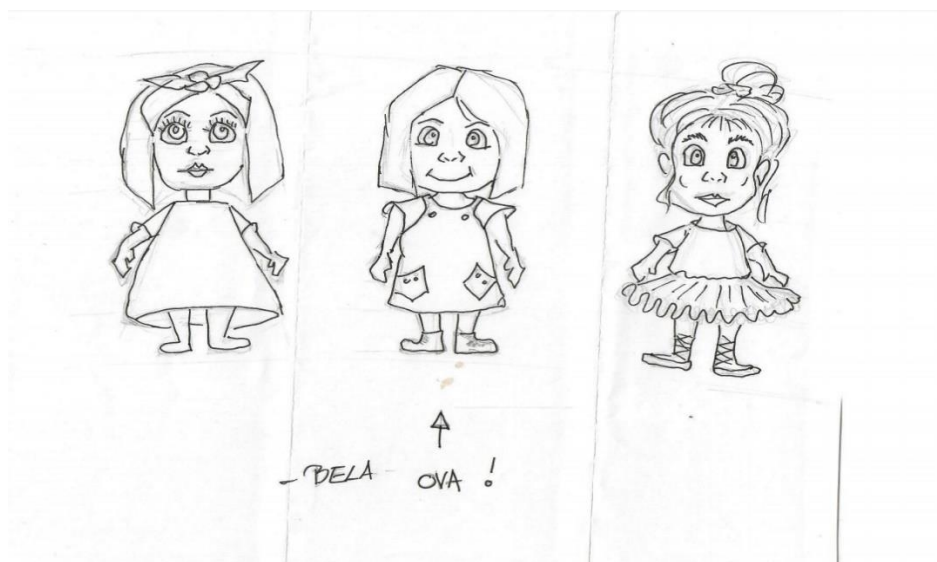
Slika 3: Idejne skice Bele