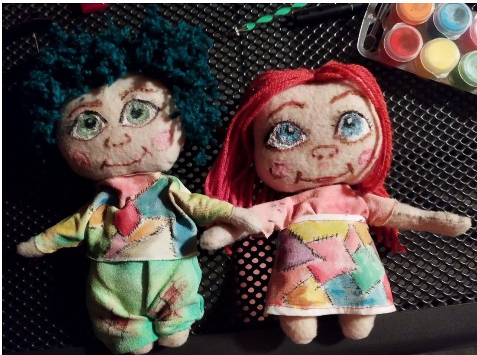
Slika 14: Lutke Bela i Vigo

Lica lutaka oslikana su akrilnim bojama koje nakon sušenja postanu izdržljive i otporne na habanje, što je važno jer će se djeca u vrtiću svakodnevno igrati tim lutkama. Akrilne boje stvorile su detaljna i estetski privlačna lica lutaka, čineći ih živima i obogaćujući njihov karakter. Za kosu lutaka koristila sam vunu koju sam izrezala na rese, nizala u pramenove i prišila na glavu. Ovime su lutke oživjele, dobile dušu i sjedinile svoje karaktere.