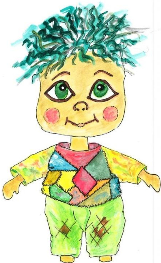
Slika 5: Vigo