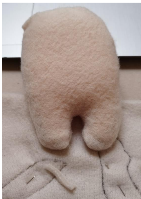
Slika 12: Presvlačenje spužve flisom