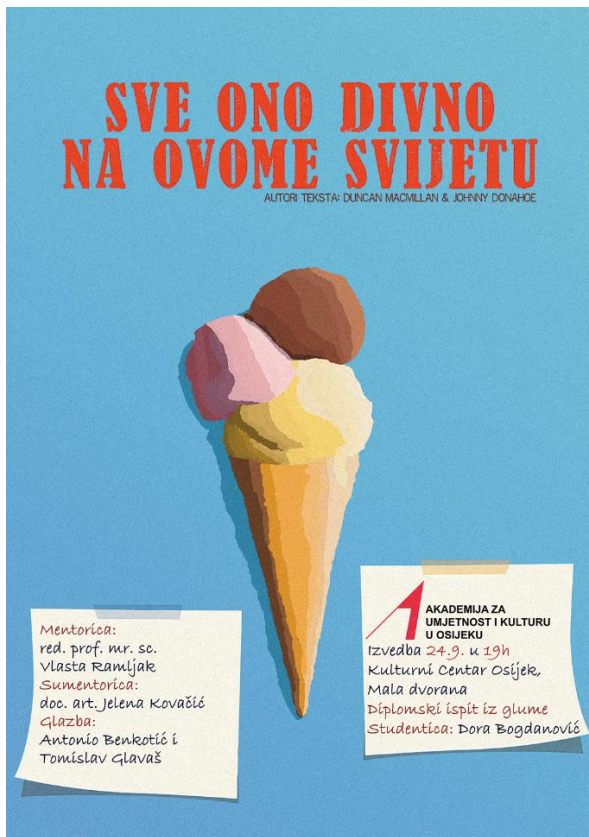
Slika 1.: Prikaz plakata, autor: Tomislav Glavaš

Tekst Sve ono divno na ovome svijetu često je izvođen tako da se glumac i publika nalaze u prostoru normalne osvijetljenosti, bez reflektora a tim postupkom glumac i publika čine jedan igrajući prostor i tako svi mogu vidjeti sve, svi mogu čuti sve i svi se mogu i smijati i plakati u isto vrijeme. Depresija je problem koji utječe na sve nas direktno ili indirektno i zato je jedini način da se s takvim problemom nosimo – tako da smo otvoreni i da o njemu govorimo.