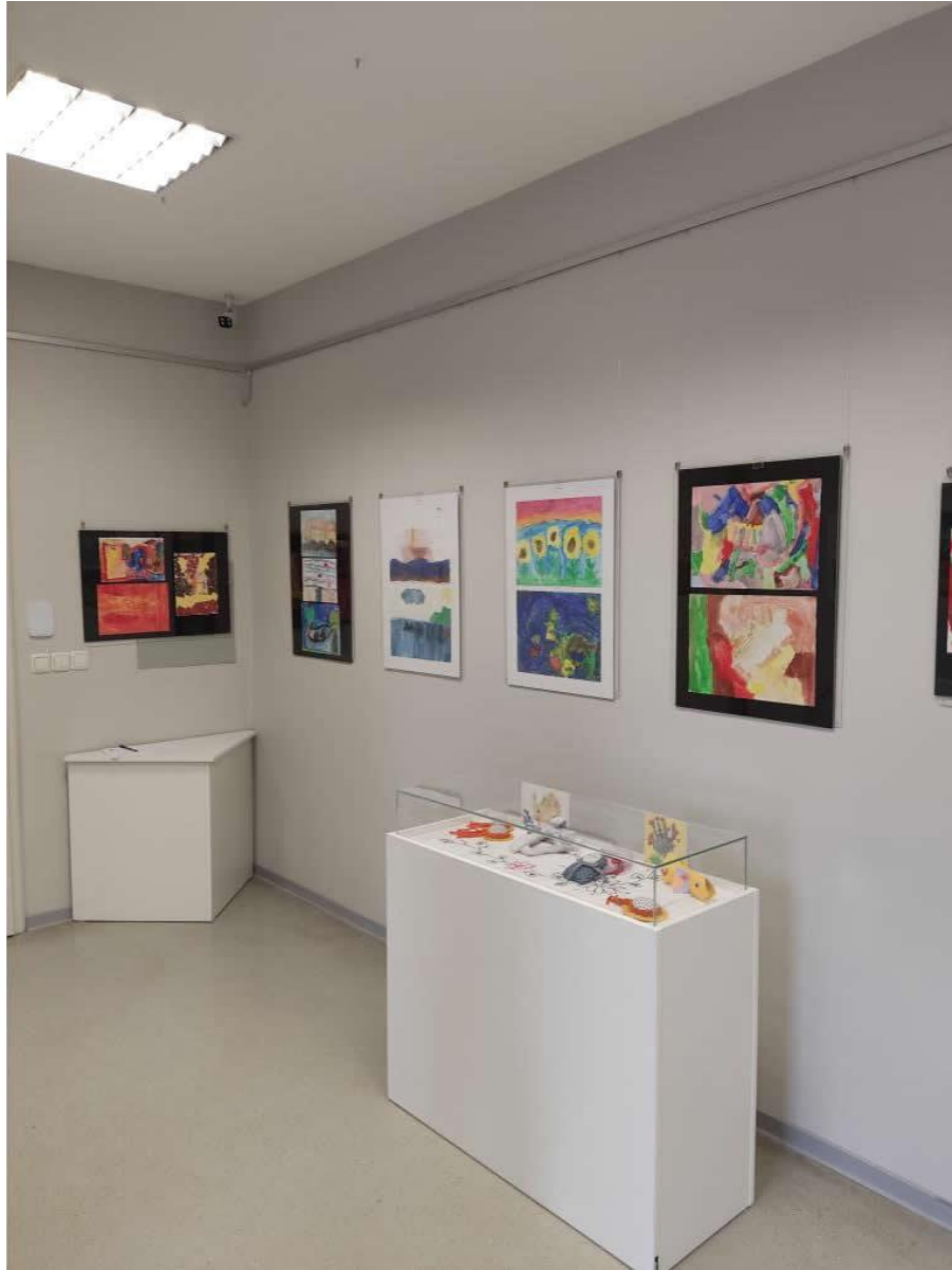
Slika 6. Radovi djece s posebnim potrebama Dnevnog centra Vrbovec s izložbe „Četiri godišnja doba“