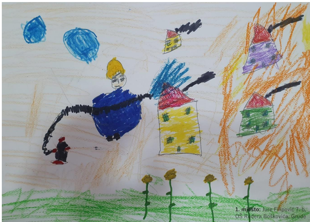
Slika 5. Radovi djece s posebnim potrebama Dnevnog centra Vrbovec s izložbe „Četiri godišnja doba”