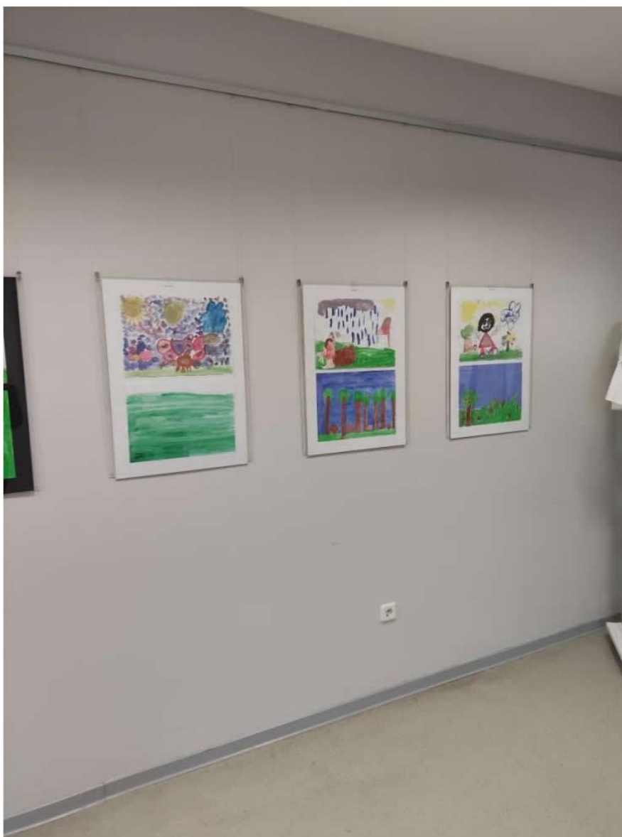
Slika 9. Radovi djece s posebnim potrebama Dnevnog centra Vrbovec s izložbe „Četiri godišnja doba“