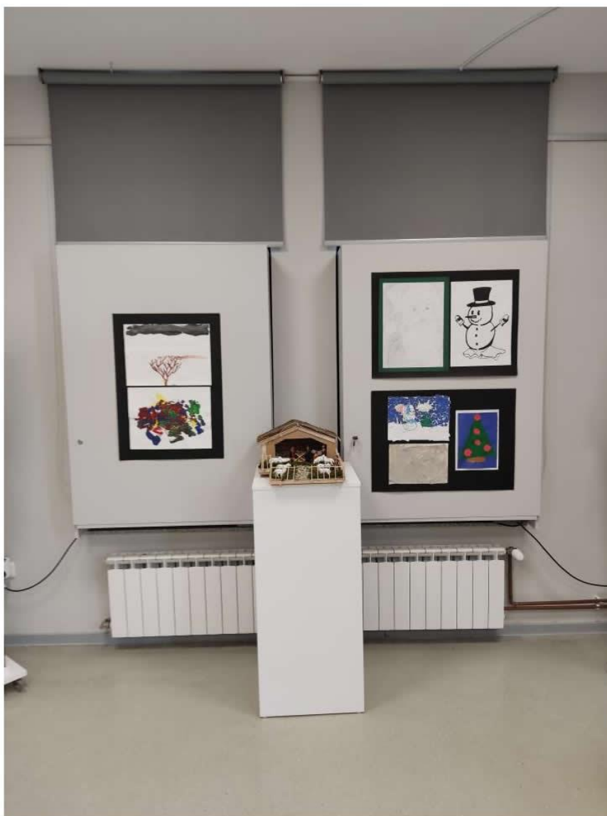
Slika 10. Radovi djece s posebnim potrebama Dnevnog centra Vrbovec s izložbe „Četiri godišnja doba“