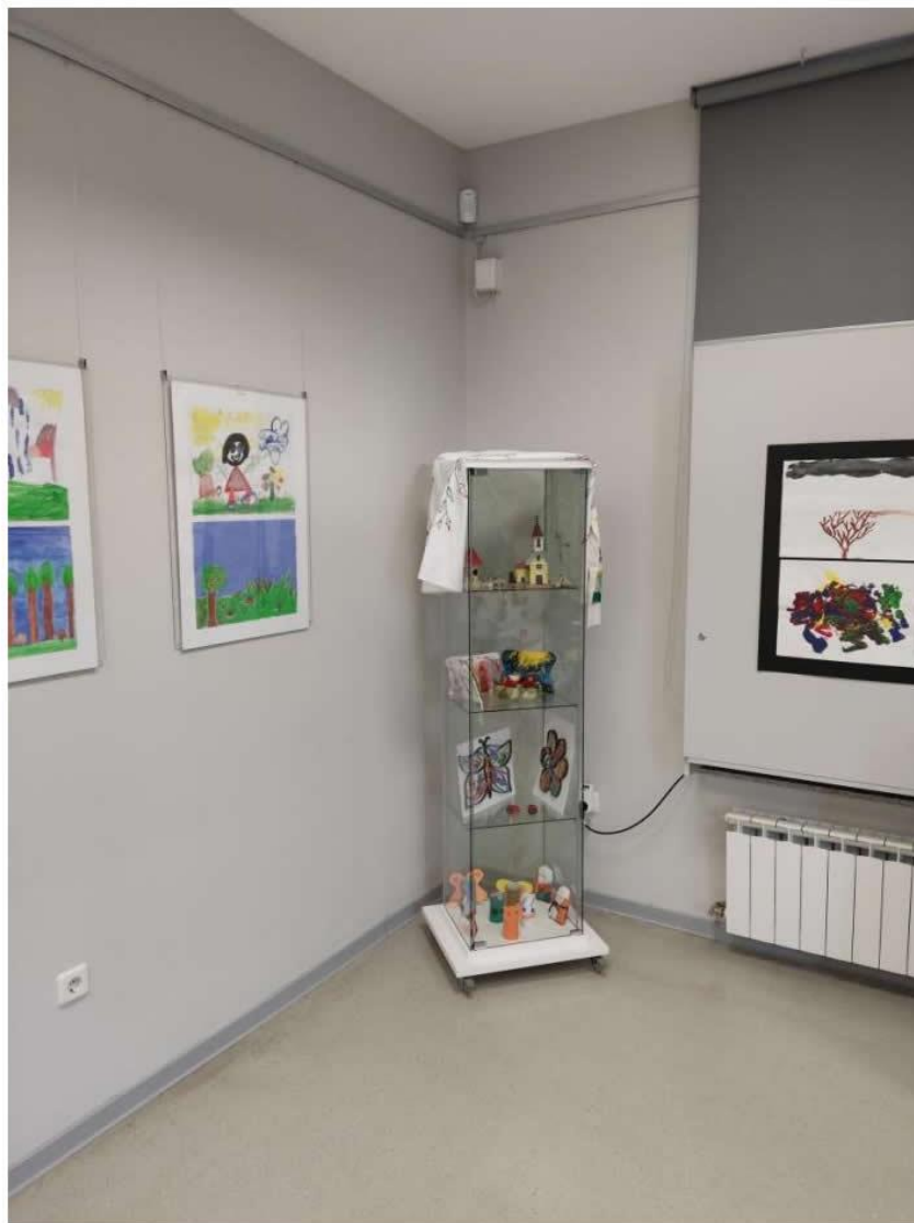
Slika 8. Radovi djece s posebnim potrebama Dnevnog centra Vrbovec s izložbe „Četiri godišnja doba“

Slika 8. preuzeta 26. travnja 2024. s https://centar-stancic.hr/otvorena-izlozba-likovnih-radova-djece-s-teskocama-i-odraslih-osoba-s-invaliditetom-cetiri-godisnja-doba/