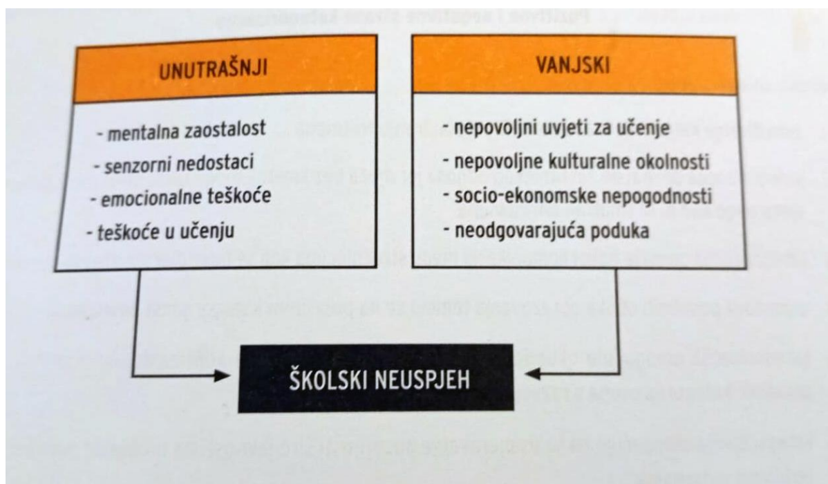
Slika 1. Činitelji školskog neuspjeha