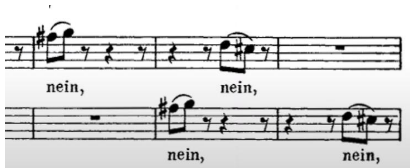
Slika 4 - Primjer imitacije motiva soprana i eha

U svijetu pjevača poznato je da je Bach bio instrumentalni skladatelj, odnosno da je glas tretirao kao svaki drugi instrument, što se posebno ističe kroz duge fraze. U ovoj ariji pri vježbanju je posebnu pažnju važno prikloniti izvježbavanju dugih fraza na jedan dah, a pritom ne gubeći na koheziji legata i fraza. Posebno su izazovni dijelovi u kojima se pojavljuje eho-sopran jer je potrebno ostati u istom registru kako bi se postigla jednoličnost i prividna jednostavnost kao i lakoća fraza. To se posebno može iščitati u 55. taktu (slika 4).