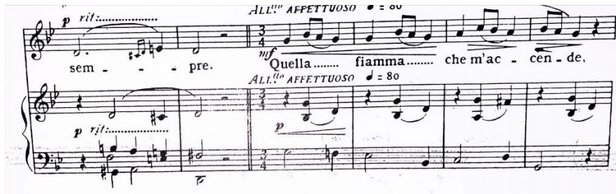
Slika 1 - Prikaz završetka recitativa na dominantni te promjena mjere (taktovi 6-11)

Iako se čini da je melodijska linija jednostavna, pjevač se suočava s izazovom uslijed učestalog ponavljanja melodijskih obrazaca. Svaki put kada se ponovi, izvođač mora prilagoditi izvedbu zadržavajući melodičnost i lakoću u izražavanju linije. Fraze su uglavnom duljine 2 do 4 takta s dovoljno prilika za udah. Osim toga, završne fraze B dijela i drugog dijela A dijela zahtijevaju dulje zadržavanje visoke note što je pjevaču izazovno da ne ostane bez daha dok održava dugu notu. Nakon riječi „sole“ zahtijevaju se brzi i puni udasi bez prekida glazbene linije. Akcenti i kromatika na kraju B dijela predstavljaju izazov u muzikalnosti i preciznosti u postizanju izražajnosti.