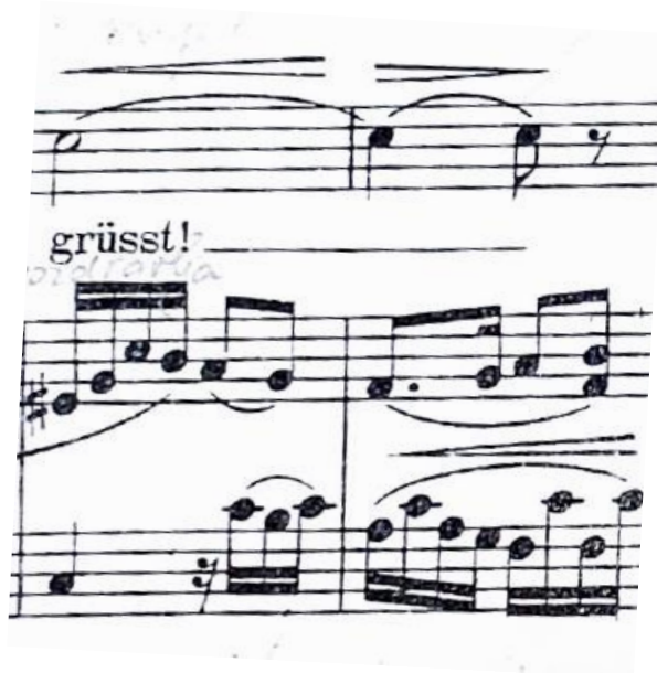
Slika 5 - Primjer zahtjevnog sloga (taktovi 12-13)