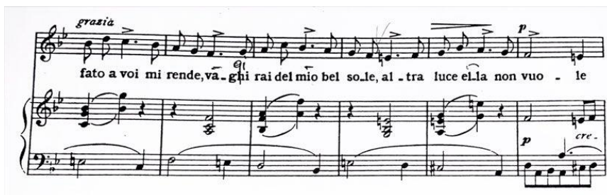
Slika 2 - Brzi i puni udah nakon riječi „sole“ (taktovi 44-49)

Iako se čini da je melodijska linija jednostavna, pjevač se suočava s izazovom uslijed učestalog ponavljanja melodijskih obrazaca. Svaki put kada se ponovi, izvođač mora prilagoditi izvedbu zadržavajući melodičnost i lakoću u izražavanju linije. Fraze su uglavnom duljine 2 do 4 takta s dovoljno prilika za udah. Osim toga, završne fraze B dijela i drugog dijela A dijela zahtijevaju dulje zadržavanje visoke note što je pjevaču izazovno da ne ostane bez daha dok održava dugu notu. Nakon riječi „sole“ zahtijevaju se brzi i puni udasi bez prekida glazbene linije. Akcenti i kromatika na kraju B dijela predstavljaju izazov u muzikalnosti i preciznosti u postizanju izražajnosti.