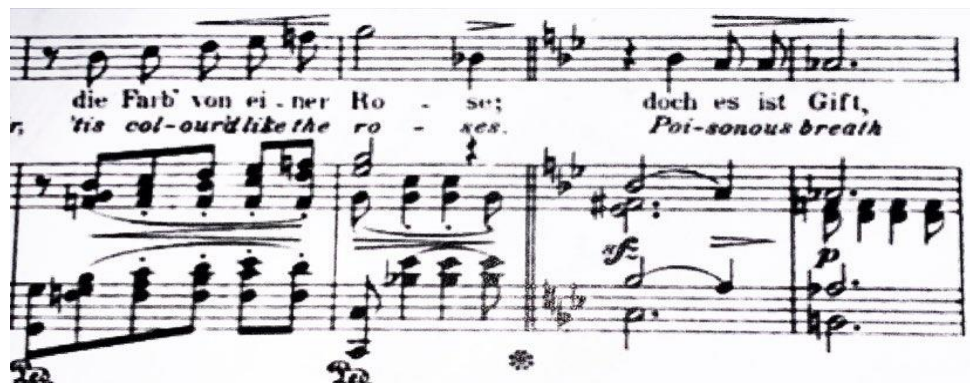
Slika 9: Prikaz postupene modulacije između prvog i drugog dijela, tj. G-dura i g- mola (taktovi 7-10)

Tekst skladbe naglašava prolaznost i krhkost ljubavi kao i neizbježnost završetka, što dodaje melankoličan ton skladbi. Posljednji cvijet i posljednja ljubav predstavljaju trenutke koji su istovremeno lijepi i smrtonosni. Pjevač prilikom izvođenja skladbe treba prenijeti složenost emocija koje su prisutne u tekstu omogućujući slušateljima da dožive širok emotivni raspon izvedbe.