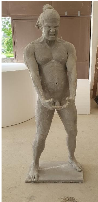
PRILOG 2: Vikispiki , poliester, 180 x 64 x 24