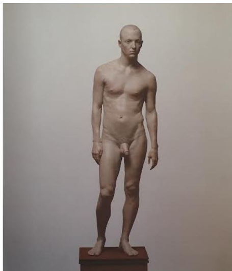
PRILOG 9: Evan Panny, Jim 1985. , polikromirani poliesterski vosak