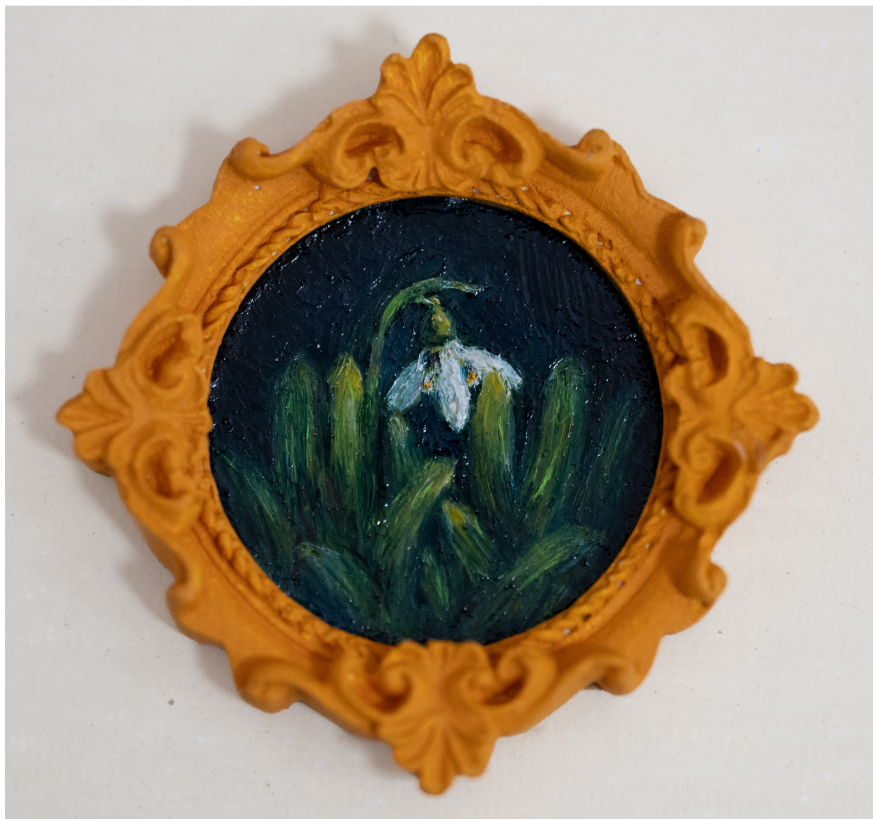
Slika 9. “Visibaba”