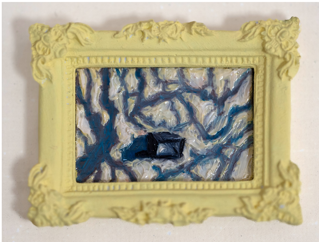
Slika 12. “Radiona”