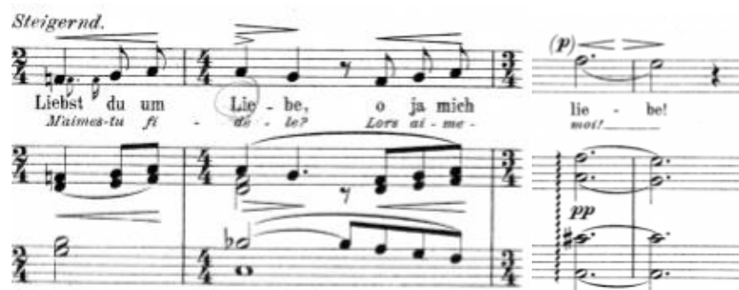
Primjer br. 16

U prve tri strofe tekst nudi alternativu u prirodnim ljepotama, ukoliko ta ljubav nije ona prava. Zbog toga, Mahler te strofe sklada istim i minimalno variranim glazbenim obrascima, dok posljednja strofa donosi augmentaciju tog obrasca stavljajući naglasak na riječ „ljubav“. Time je htio postići kulminaciju cijele priče, napokon došavši do pravog shvaćanja ljubavi, a tu ideju potkrepljuje uputom za način izvođenja steigernd , što znači 'povećavajući se'.