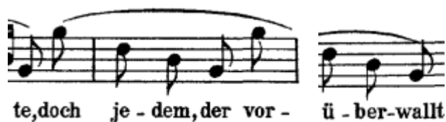
Primjer br. 8: rastavljeni trozvuk Ges-dura dva puta zaredom

U završetku skladbe ponovno se dva puta zaredom javlja rastavljeni trozvuk Ges-dura silazno. Pjevač mora pravilno, brzo i aktivno uzeti dah te se pripremiti za skok i ispjevavanje fraze na jednom dahu.