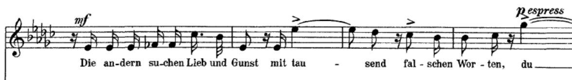
Primjer br. 7: prikaz zanimljivog ritamskog zapisa koji stvara dojam razigranosti

U završetku skladbe ponovno se dva puta zaredom javlja rastavljeni trozvuk Ges-dura silazno. Pjevač mora pravilno, brzo i aktivno uzeti dah te se pripremiti za skok i ispjevavanje fraze na jednom dahu.