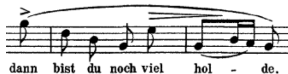
Primjer br. 5: silazni rastavljeni trozvuk Ges-dura

Du meines Herzens Krönelein druga je po redu skladba u ciklusu „Schlichte Weisen“, Richarda Straussa, op. 21. Pisana je u 2/4 mjeri, tempo je andante 13 , a tonalitet je Ges-dur. Prokomponirana je i dvodijelnog je oblika. Melodijska linija ima karakterističan motiv silaznog rastavljenog trozvuka Ges-dura koji se javlja nekoliko puta.