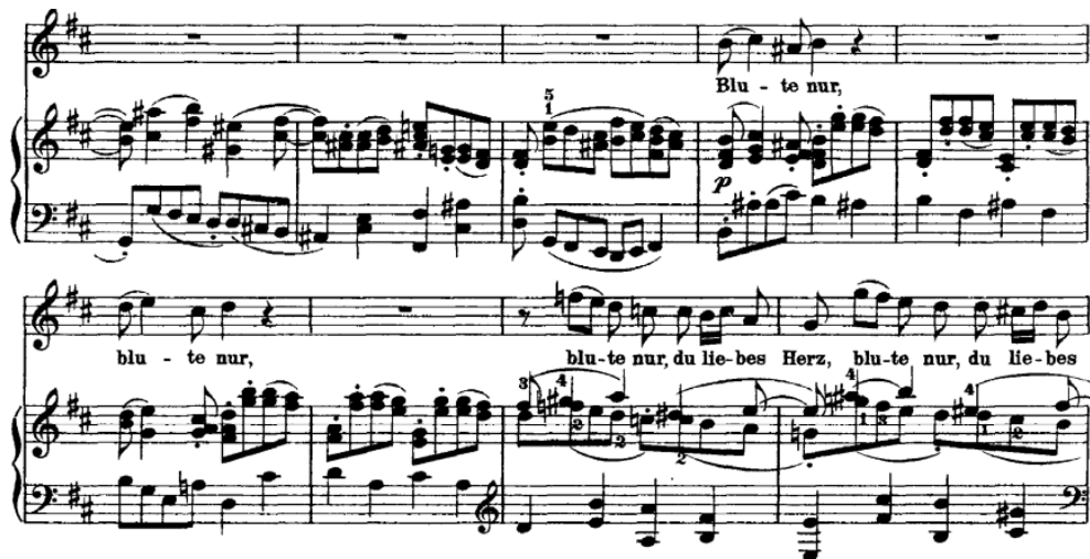
Primjer br. 2: sinkope i silazne sekvence

Oratorijska arija Blute nur, du liebes Herz govori o Judinoj izdaji i boli koju je time prouzročio Isusu Kristu. Izvodi ju sopran uz dvije flaute, gudače te basso continuo . 8 Arija je napisana u h-molu, 4/4 mjeri, a tempo je andante 9 . Prvih su 8 (osam) taktova preludij 10 u kojem se iznosi „lajtmotiv“ 11 . Karakteristične su sinkope koje se javljaju u svakom drugom taktu i silazna sekvenca.