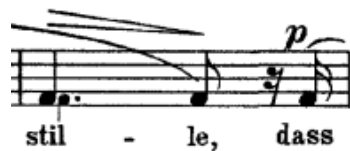
Primjer br. 6.: oznaka za decrescendo na riječi „stille“

iznad riječi „stille“ koja u prijevodu znači „tišina“ nalazi oznaka za decrescendo što znači da je treba postepeno sve tiše pjevati do piana . Karakter skladbe je vrlo nježan, a ritamski zapis skladbe pridodaje i njenoj zaigranosti.