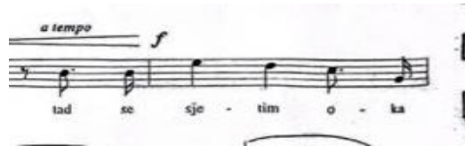
Primjer br. 7: prikaz karakterističnog skoka u skladbi za kvartu uzlazno b1-es2

Pjevač treba staviti naglasak na pravilan izgovor hrvatskog jezika te izjednačavanje vokala. Kako navodi Lhotka-Kalinski (1975:54): „Daljnja je prednost našeg jezika za pjevača u tome što on nema zatvorenih ni nazalnih vokala. Za sustav naših vokala rečeno je već da je jednostavan. Mi imamo, isto kao u talijanskom, samo pet osnovnih vokala (i, e, a, o, u), a njihov umjereno otvoreni (tzv. normalni) smještaj pogoduje razvitku pjevača. Sve nas ovo upućuje na zaključak da naš narod ima već u samom materinskom jeziku najbolje preduvjete da iz svoje sredine dade dobre pjevače.“ Također je vrlo bitno ispoštovati sve dinamičke oznake kako bi se uvjerljivije izvela skladba. U skladbi se nalaze dva vrhunca na tonovima g2 te ih je potrebno izvesti različito prema tekstu. Na prvom vrhuncu skok na g2 je odmah u dinamici f time dočaravajući osjećaj ljubavnog zanos i ushićenosti, dok je na drugom vrhuncu skok na g2 u p te ga se crescendira do f prikazujući time bliskost subjekta s riječju „uzdišući“. Pjesma se sastoji od kratkog B dijela koji se treba pjevati nešto pokretnije, no završiti ga vrlo „nježno“. Zadnja fraza ove solo pjesme mora se otpjevati vrlo dostojanstveno baš kao i sami početak.