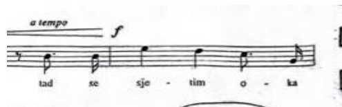
Primjer br. 7: prikaz karakterističnog skoka u skladbi za kvartu uzlazno b1-es2

Pjevač treba staviti naglasak na pravilan izgovor hrvatskog jezika te izjednačavanje vokala. Kako navodi Lhotka-Kalinski (1975:54): „Daljnja je prednost našeg jezika za pjevača u tome što on nema zatvorenih ni nazalnih vokala. Za sustav naših vokala rečeno je već da je jednostavan. Mi imamo, isto kao u talijanskom, samo pet osnovnih vokala (i, e, a, o, u), a njihov umjereno otvoreni (tzv. normalni) smještaj pogoduje razvitku pjevača. Sve nas ovo upućuje na zaključak da naš narod ima već u samom materinskom jeziku najbolje preduvjete da iz svoje sredine dade dobre pjevače.“ Također je vrlo bitno ispoštovati sve dinamičke oznake kako bi se uvjerljivije izvela skladba. U skladbi se nalaze dva vrhunca na tonovima g2 te ih je potrebno izvesti različito prema tekstu. Na prvom vrhuncu skok na g2 je odmah u dinamici f time dočaravajući osjećaj ljubavnog zanos i ushićenosti, dok je na drugom vrhuncu skok na g2 u p te ga se crescendira do f prikazujući time bliskost subjekta s riječju „uzdišući“. Pjesma se sastoji od kratkog B dijela koji se treba pjevati nešto pokretnije, no završiti ga vrlo „nježno“. Zadnja fraza ove solo pjesme mora se otpjevati vrlo dostojanstveno baš kao i sami početak.