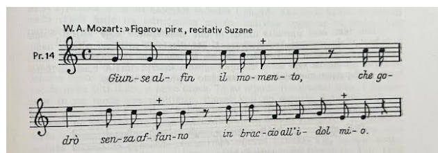
Primjer br. 13 : zaostajalice u recitativu označene plusom (+)

Recitativ započinje u C-duru i 4/4 (četveročetvrtinskoj) mjeri te klavirskim uvodom od 4 takta. Kako je ovo „secco recitativ“ (suhi recitativ), pratnja je vrlo jednostavna, najčešće samo u akordima, a pjevač ga treba izvoditi jednostavno i pokretno prema tekstu. Važno je unaprijed dobro smisliti fraze recitativa kako bi zvučale prirodno i tečno te ih „ispričati“ slušateljima, no uz veliki legato . Kako navodi Lhotka-Kalinski (1975:66): „Bitna je značajka recitativa da se on, po načinu izvedbe, nalazi nekako u sredini između pjevane i obične govorene riječi.“ Također, Lhotka-Kalinski (1975:67) u svom priručniku „Umjetnost pjevanja“, uzima upravo recitativ Giunse alfin il momento kao primjer za izvođenje zaostajalica: „Ako uočimo činjenicu da zaostajalica dolazi samo na naglašeni dio mjere, te da se sa slijedećim onom izvodi uvijek u legatu , onda nam mora biti jasno da svaka zaostajalica omekšava frazu te da je čini nježnom i lirskom.“