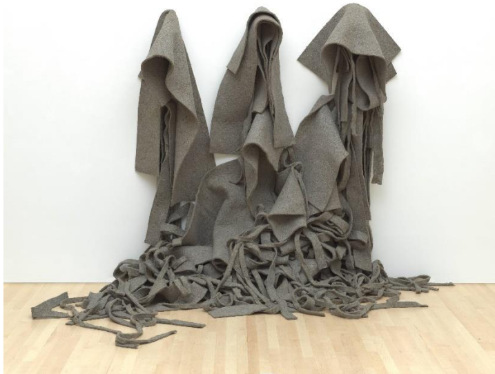
Slika 14. Robert Morris, Bez naziva , 1967. g.