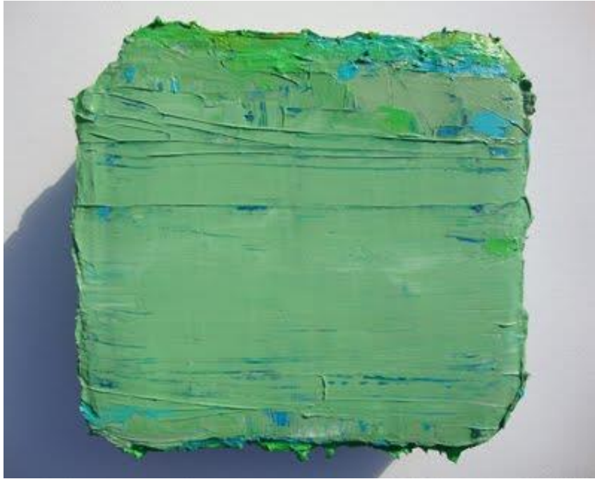
Slika 15. Elizabeth Shepell, Debela serija #6 , akril, 2011. g.