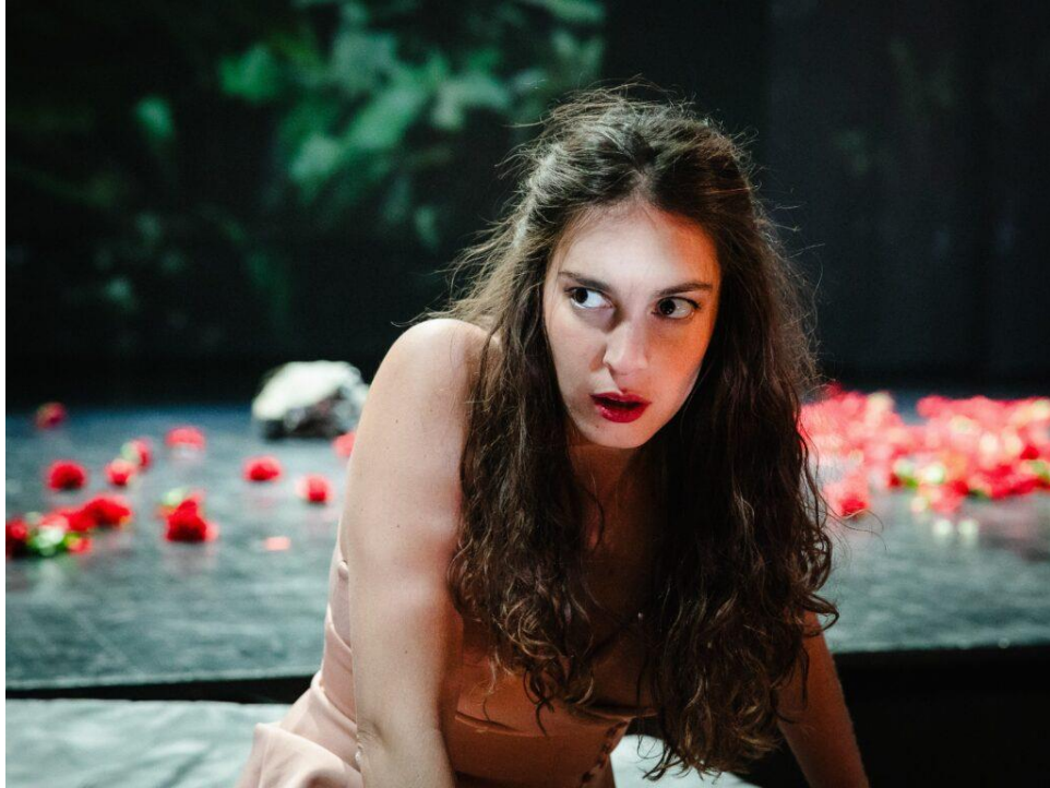
Slika 9. Svjedočenje nad konačnim zarukama

osudom, gleda na sve to no kada iskreno i bez zadržske ispričaju kako ih je luda ljubav navela da se osjećaju kako se osjećaju, sada u tom trenutku, ni kralj na to ne ostane imun te glasno i jasno potvrdi trostruko vjenčanje. Građanstvo uvijek ide za voljom kralja pa tako i ovoga puta.