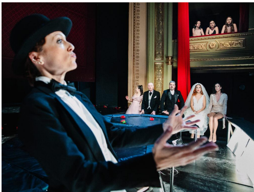
Slika 10. Uskakanje u cipele gledatelja, promatrača