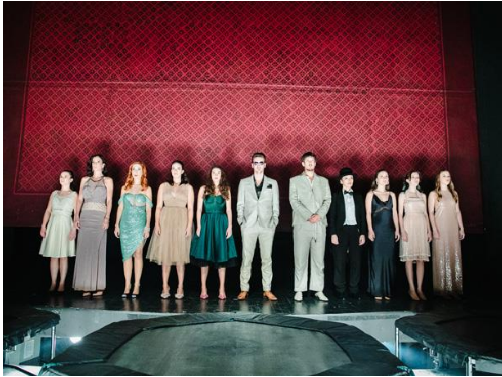
Slika 2. Predstavljanje likova na javi