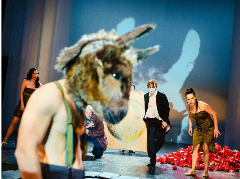
Slika 5. Poigravanje s javom

Na prvu probu majstora na zelenoj livadi, „milju izvan grada“, upada i Puk kao tračak sna koji proučava situaciju i nagovještava zaplet radnje. U trenutku poljupca između dva majstora koji igraju ulogu Tizbe i Vratila, Puk odvlači