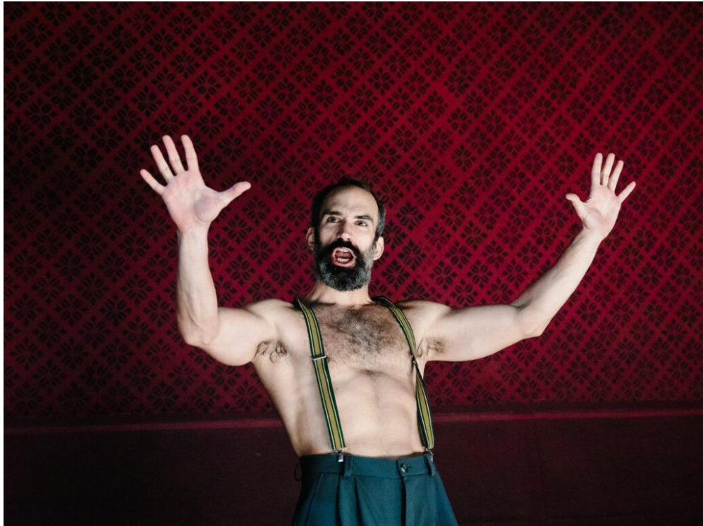
Slika 8. Razotkrivanje