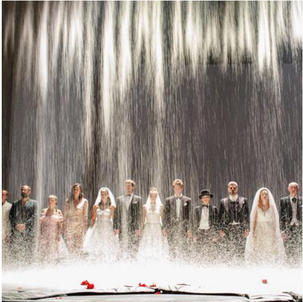
Slika 11. Rikanje

je da sudite ako već morate.“ 18 Kada već i mi dobivamo mogućnost da budemo besramno iskreni s vama, dajemo vam priliku da to isto i vi činite nama.