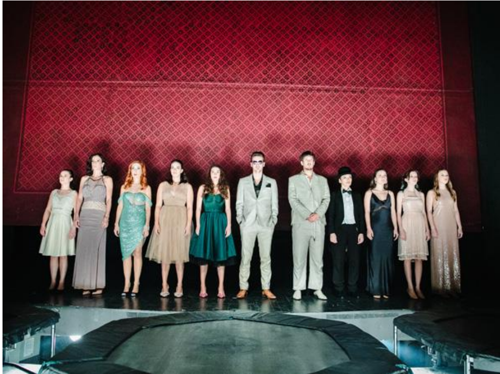
Slika 2. Predstavljanje likova na javi