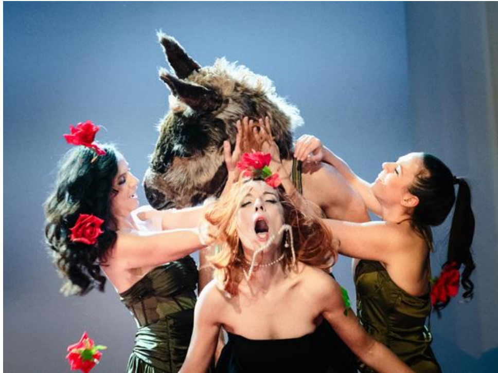
Slika 6. Slatko izvršavanje zapovijedi

Na sceni se odvija prvi susret između Titanije i Vratila koji za nas vile koje se nalazimo u drvenoj konstrukciji u dubini scene, bez vizualne perspektive, samo odzvanja strašću.