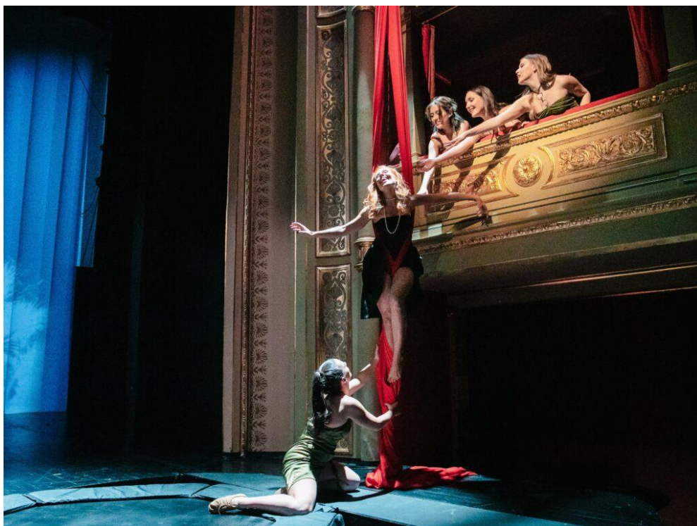
Slika 4. Slavljenje kraljice