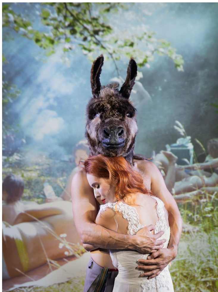
Slika 1. „San Ivanjske noći“ 4