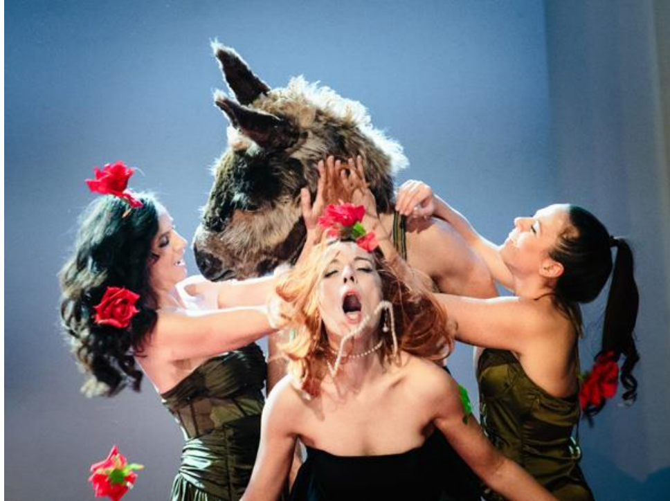
Slika 6. Slatko izvršavanje zapovijedi

Na sceni se odvija prvi susret između Titanije i Vratila koji za nas vile koje se nalazimo u drvenoj konstrukciji u dubini scene, bez vizualne perspektive, samo odzvanja strašću.