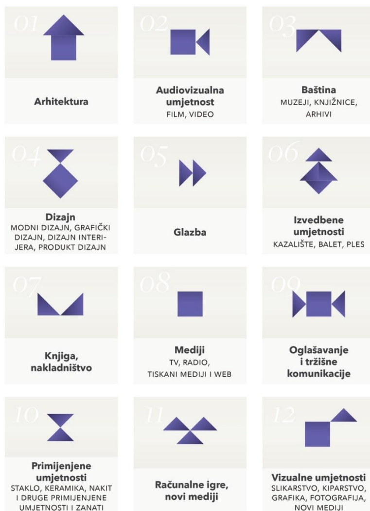
Shema 1. Organizacijska shema kreativne industrije – prijedlog za Republiku Hrvatsku