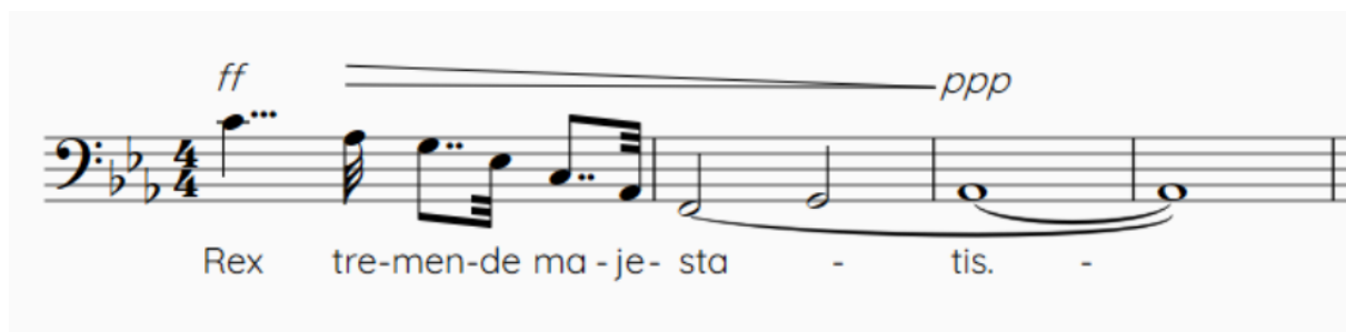
Slika 9. Uvodni motiv stavka Rex tremendae koji izvodi bas

Glazba započinje karakterističnim motivom koji se pojavljuje u cijelom stavku. Tu je i punktirana zbarska melodija koja u skokovima silazi i završava penjući se od d do f (subdominante), otvarajući svojim završetkom subdominantnu sferu i sugerirajući nastavak u svjetlijem i blažem ugođaju. Ovaj se motiv ponavlja i čini uvodni preludij od ponovljene glazbene rečenice, obuhvaćajući prva dva retka teksta.