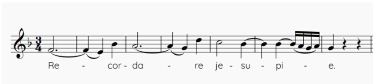
Slika 4. Tema stavka Recordare

Uvod donosi violončelo s pjevnom frazom kojom je obilježen svaki most ili prijelaz u stavku te mu se nakon 6 taktova priključuju svi gudači izvodeći sekvencu koja s violončelskim uvodom traje 13 taktova i dovodi nas do prve teme. Temu započinju alt i bas, a završavaju je sopran i tenor te sadrži prva 2 retka teksta. Pogledajmo поближе prvu temu ovoga stavka: