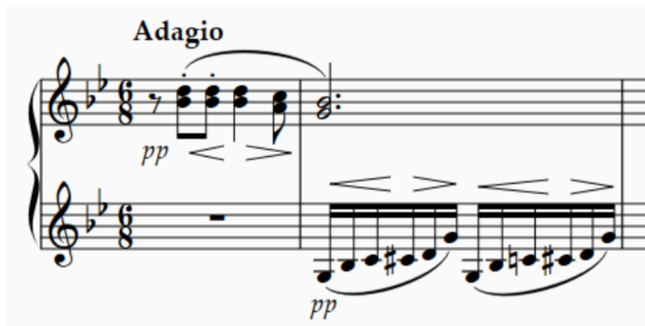
Slika 8. Karakteristični motivi stavka Quid sum miser

sastavljena od rastavljenih akorda s umetnutim neakordičkim i prohodnim tonovima. Iako su u ovom broju, kao i u cijelom djelu, gudači zaduženi za cjelovitu harmonijsku pratnju, Quid sum miser bi i bez njih zvučao harmonijski pokriven upravo zbog fagota.