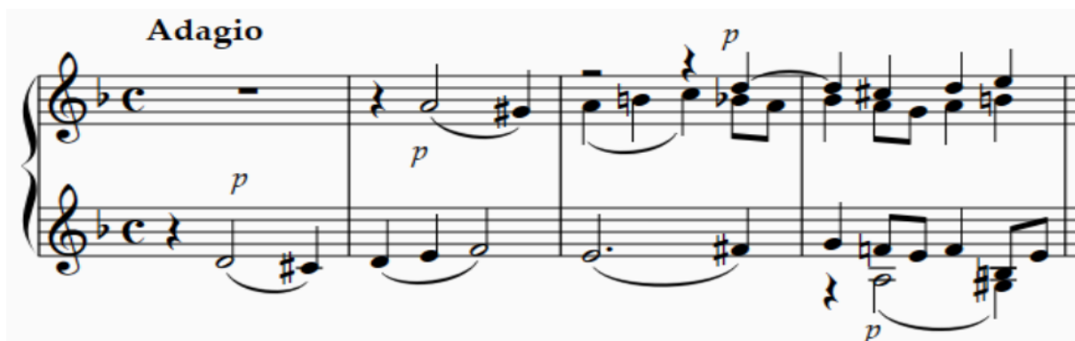
Slika 1. Uvodna tema fagota i kontrapunkt basetnog roga, Introitus

Rekvijem započinje mračnom i mističnom temom koju izvodi fagot, a kojoj se već u sljedećem taktu suprotstavlja kontrapunkt basetnog roga. Pogledajmo kako to izgleda u notnom zapisu: