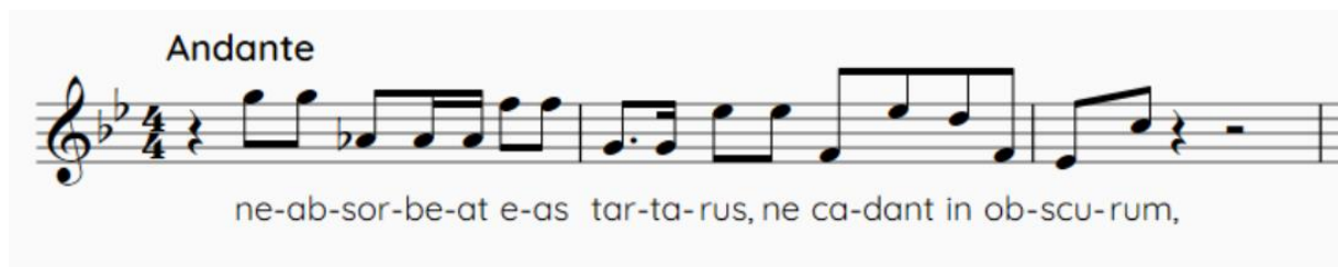
Slika 5. Tema fuge iz stavka Domine Jesu Christe

Ovaj stavak sadrži dvije fuge, i uz to kanon (Wolff, 1995) te je polifona imitacija prisutna od početka do samoga kraja. Na početku se predstavlja tema u piano koja se sastoji od rastavljenoga kvintakorda g-mola. Tematske, polifone pasaže isprekidane su zborskim forte frazama koje su ili unisone ili u punktiranom ritmu. Na prvi dio, obilježen polifonim nastupom pojedinačnih glasova i zborskim unisonim kontrastima, nadovezuje se fuga na tekst NE ABSORBEAT EAS TARTARUS, NE CADANT IN OBSCURUM . Ona se proteže na 12 taktova. Pogledajmo temu ove fuge: