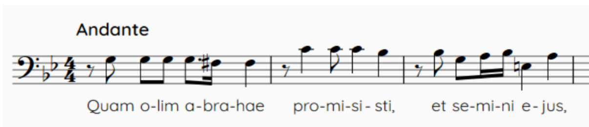
Slika 6. Tema fuge drugoga dijela stavka Domine Jesu Christe

Ova je fuga puna igre samim motivom kroz kromatske pomake te se čini da u svim ovim taktovima, kojih je 35, neprestano čujemo tekst QUAM OLIM ABRAHAE PROMISISTI u ovoj ili onoj inačici, iscrpljujući gotove sva sredstva koja nam provedba fuge nudi za rad s motivom. U predzadnjem taktu glasovi se smiruju na subdominanti g-mola, da bi sam završetak nastupio na pikardijskoj tonici.