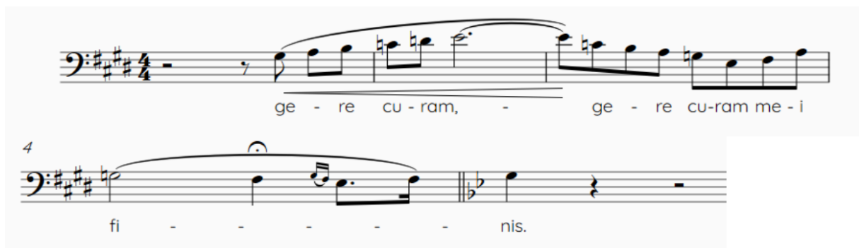
Slika 11. Basovska kadenca stavka Confutatis maledictis

Na kadenci B dijela orkestar se smiruje, a gudači nas svojim kromatskim motivima ponovno uvode u A dio. On je gotovo identičan s prvim, s tom razlikom da se u drugomu dijelu periode doseže pjevački vrhunac; bas se penje do tona e 1 te spuštajući u osminskim vrijednostima završava periodu. Preostaje basovska kadenca, koja je veličanstvena jer nas laganim izgrađivanjem napetosti uvodi u dobro poznati broj DIES IRAE , koji se ovdje pojavljuje treći put. Ovo nam sugerira da je stavak DIES IRAE vrlo važan za samoga skladatelja te nam možda i odaje pravu sliku koju umjetnik gaji u srcu o duhovnosti, religiji i o njegovom odnosu s Bogom. Pogledajmo basovsku kadencu: