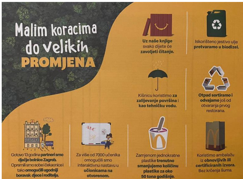
slika 3: projekt „malim koracima do velikih uspjeha“ podložak za pladanj u restoranu

U restoranima u Španskom i Branimirovoj ulici u Zagrebu, u Koprivnici, Bjelovaru, Rovinju, Osijeku i Ježevu koriste se sustavi za prikupljanje kišnice koja se koristi za zalijevanje zelenih površina oko restorana te kao tehnička voda u toaletima. Samim korištenjem kišnice McDonald's godišnje uštedi 3000 kubika vode što je količina koja zadovoljava potrebe čak 20 obitelji tijekom jedne godine. Sortiranje otpada također je vrlo važan proces kod očuvanja okoliša, a McDonald's u svojim restoranima odvaja otpad još od otvaranja prvog restorana.