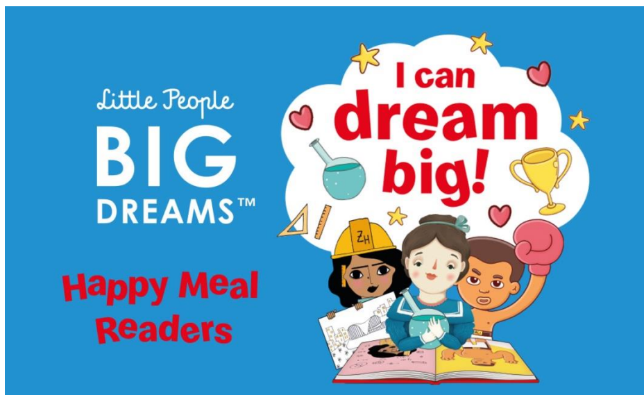
slika 2: McDonald's serija knjiga za djecu

Kroz knjige i slikovnice djeca mogu učiti o životinjama, planut, svemiru ili nekoj drugoj temi koja se proteže kroz dostupne slikovnice. Serija knjiga „Little People, Big Dreams“, primjerice, upoznaje djecu s umjetnicima, znanstvenicima, istraživačima, sportašima i drugim inspirativnim ljudima koju su slijedili svoje snove i promijenili svijet.