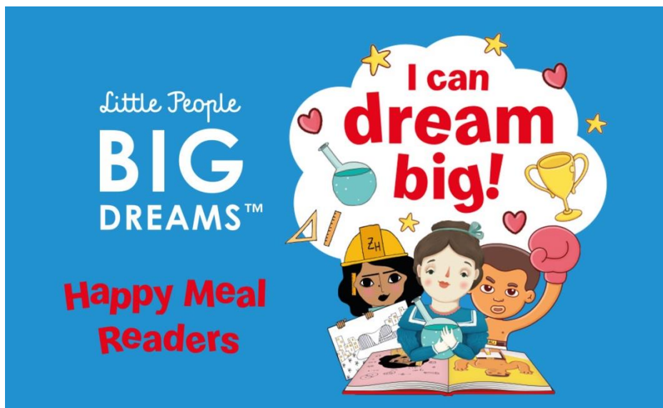
slika 2: McDonald's serija knjiga za djecu

Kroz knjige i slikovnice djeca mogu učiti o životinjama, planut, svemiru ili nekoj drugoj temi koja se proteže kroz dostupne slikovnice. Serija knjiga „Little People, Big Dreams“, primjerice, upoznaje djecu s umjetnicima, znanstvenicima, istraživačima, sportašima i drugim inspirativnim ljudima koju su slijedili svoje snove i promijenili svijet.