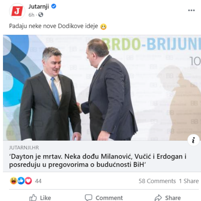
Slika 2. Stranice tiskanih medija na društvenim mrežama i njihove objave prostor su polemike i diskusije za čitatelje i pratitelje stranica (Jutarnji list)

moogućnostima i ograničenjima predmetnoga medija. U današnje vrijeme razlikuju se one društvene mreže kojima je prvenstvena namjena komunikacija (bilo posredstvom privatnih poruka, tekstualnih objava ili komunikacije u grupama, odnosno komentarima) te društvene mreže kojima je primarna namjena dijeljenje multimedijalnoga sadržaja, odnosno fotografija i videozapisa, dok je verbalna komunikacija u drugom planu, često kvantitativno reducirana (Van Dijck, 2013). Dakle, sam format i opcije mreža diktiraju dijelom način i opseg komunikacije putem njih. Svrhu i funkciju društvenih mreža Sandel i Ju (2019: 4) vide u njihovoj ulozi dostupnoga alata za ljudsku komunikaciju i socijalizaciju te kao način prevladavanja ograničenja masovnih medija 20. st. Uz društvene mreže, za ovakvu svrhu komunikacije korisnicima su dostupni i drugi formati kao što su blogovi (mrežni dnevnici), vlogovi (blogovi zasnovani na videozapisima) i internetski forumi.