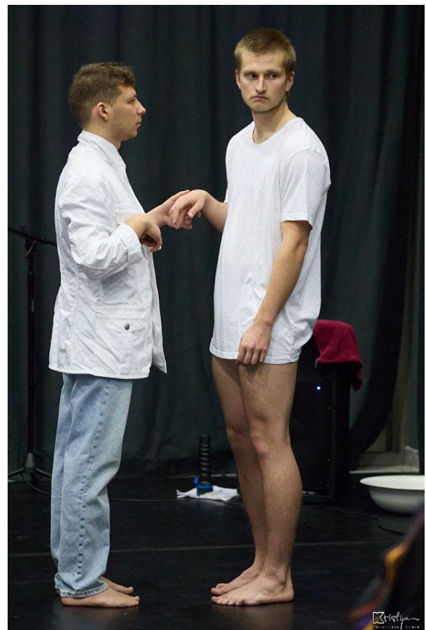
Slika 2. i 3. : Lijevo (kostimi iz procesa), desno (finalni kostimi)