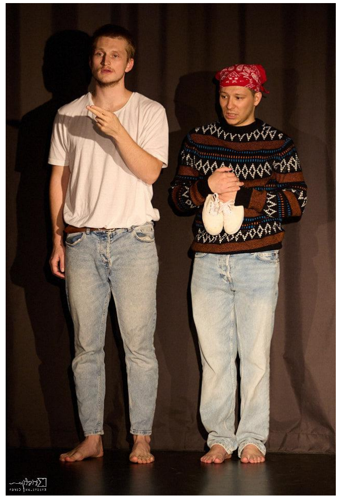
Slika 4.,5.,6. i 7. : Lijevo (kostimi iz procesa), desno (finalni kostimi)