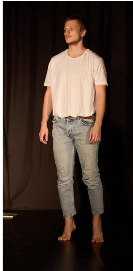
Slika 8., 9., 10. i 11. : Lijevo (kostimi iz procesa), desno (finalni kostimi)