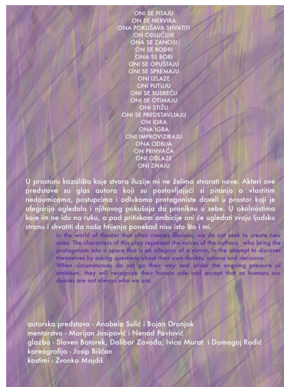
Slika 2 Programska knjižica predstave