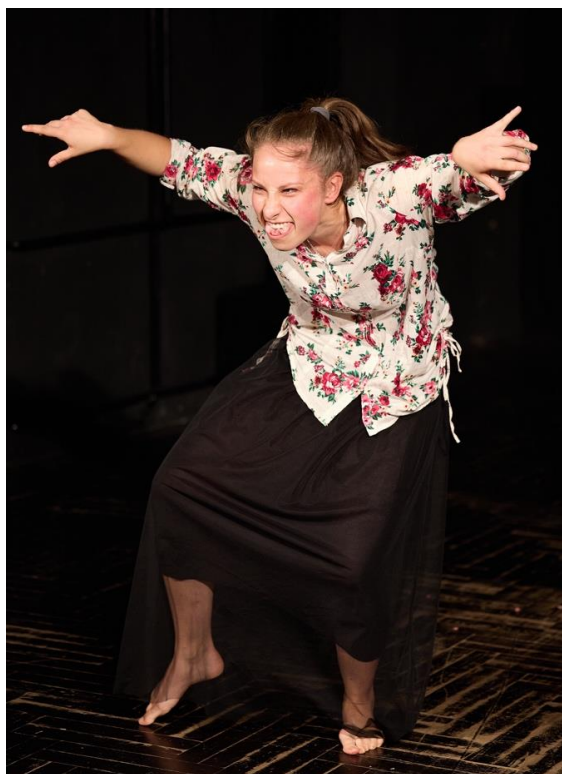
Slika 9 Ona na audiciji

Kada završi, nakloni se i zahvali, te nastavi razgovor sa žirijem: