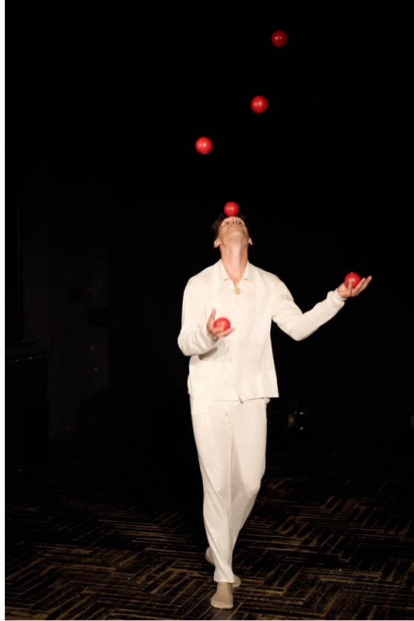
Slika 7 On na audiciji

Njegova se etida može okarakterizirati kao mimska etida suvremenog cirkusa, a sastoji se od dva dijela, plesnog i žonglerskog. Počinje tako da On igra umišljenog i vrlo začudnog kralja koji kao da teži nečemu višemu, nečemu što mu je zabranjeno, kao da je zarobljen u svojoj ulozi i svim propisima i običajima kojih se mora pridržavati kao kralj. Pokušava se osloboditi tih okova, no odjednom se pretvara u lutka koji je simbol manipulacije i upravljanja, te kroz žongliranje u kojemu trikovima gradira od jedne do pet loptica i tako dodatno pojačava motiv kraljeve ambicije i težnje ka oslobođenju. Na kraju kralj ipak izgara u silnoj želji za oslobođenjem i pada uništen. Njegova je etida u potpunosti praćena glazbom.