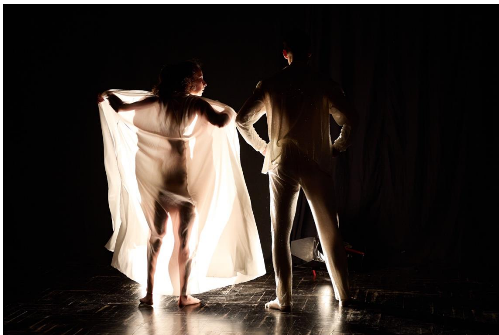
Slika 11 On ju prekriva svojim plaštem

Njihovo odbijanje i odustajanje za njih je istovremeno i pobjeda i poraz. Budući da smo Bojan i ja kao autori više htjeli naglasiti njihovu pobjedu, nakon što ju on odnese u dubinu scene, kreće velika svjetlosna promjena. Svjetlo prelazi iz fronte u kontru nakon čega su vidljive samo njihove siluete. Oni kroz ples na pjesmu State trooper spremaju sve sa scene i slažu u poziciju kao na početku predstave, sjedaju svatko na svoj kubus, ali ovog puta okrenuti jedno prema drugome, jedno vrijeme tako sjede, zatim si prijateljski pružaju ruke kao da su pobijedili. Taj znak zajedništva čini zadnju sliku i kraj predstave.