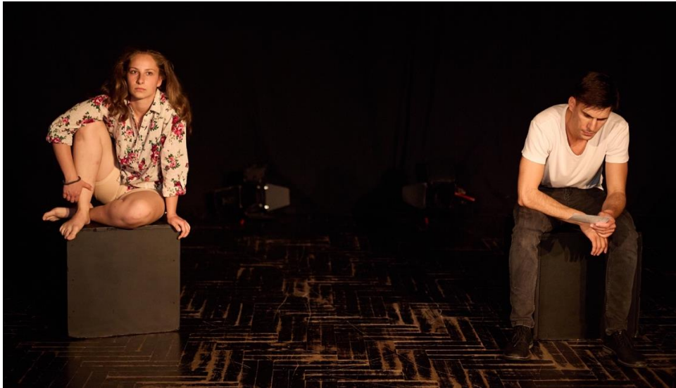
Slika 3 Početna scena u predstavi

Predstava započinje slikom u kojoj su glumci, dok publika ulazi, u sjedećem položaju na kubusu, svatko na jednoj strani scene, što u kontekstu predstave znači da su likovi u svojim stanovima.