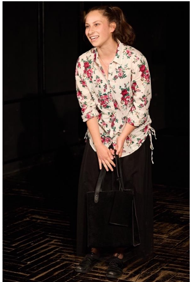
Slika 14 Ona na audiciji