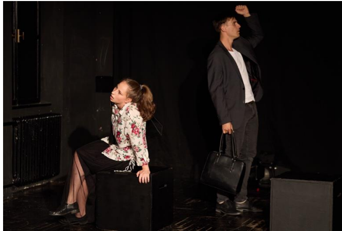
Slika 4 Scena u tramvaju

međusobno se isprepliću, ali u prvoj se sceni niti u jednom trenutku ne dovode u međusobni odnos, tako da publika prati dva odvojena, ali paralelna života likova. Njih se dvoje prvi put susreću u tramvaju gdje se svatko u svojim mislima kroz vožnju i u neudobnosti tramvaja pokušava smiriti i psihički pripremiti za audiciju, no neprestane vanjske okolnosti poput ljuljanja i kočenja tramvaja, negativno utječu na njihove unutarnje procese.