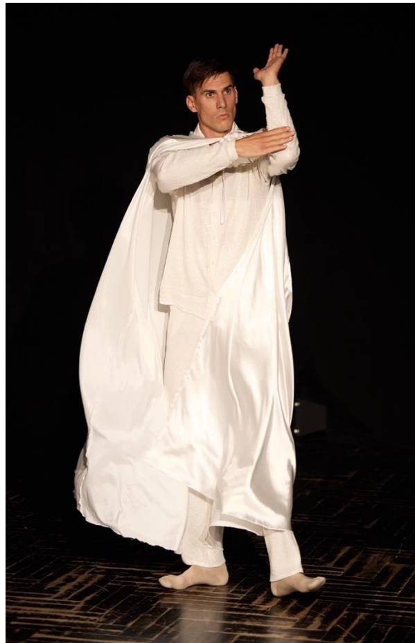
Slika 16 On na audiciji u kostimu