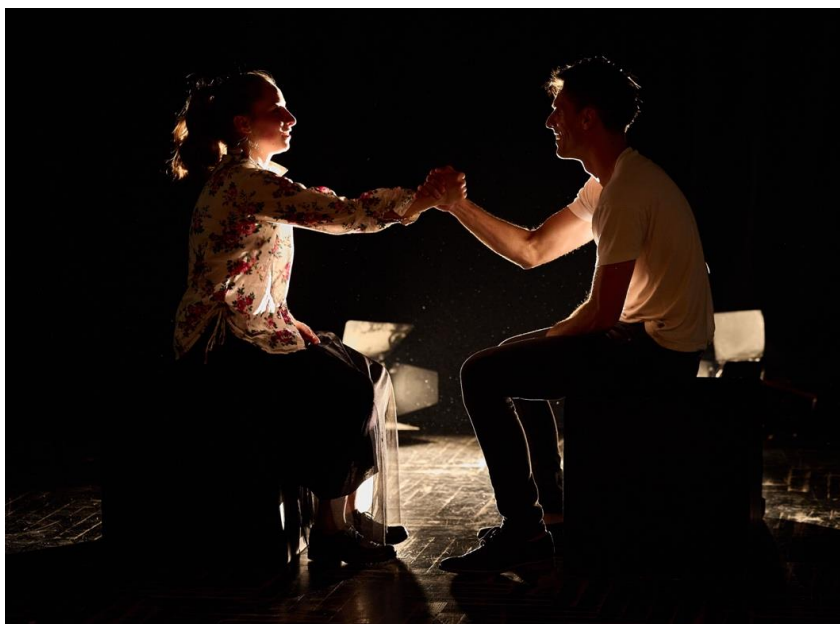
Slika 12 Njihova pobjeda - zadnja scena u predstavi

Izostavljanjem imena likova te određivanjem likova samo po spolu, kao autori htjeli smo staviti naglasak na to kako se svatko od nas može naći u istoj situaciji u kojoj su se našli i likovi u predstavi, te da svatko u toj situaciji ima priliku birati kojim putem će krenuti. Zbog prisutnosti sljedećeg problema u našem poslu, htjeli smo prikazati i različit odnos nadređenih prema muškarcima i ženama. Žene su često te koje su žrtve, koje moraju posustati na putu ka svom cilju kako bi sačuvale sebe i one koje se teže mogu izboriti za ravnopravnost, dok su muškarci ti o kojima žene ponekad ovise jer imaju priliku pomoći ženama u sličnim situacijama, ako to izaberu. S Njezinom odlukom da na kraju odbije zadatak osobno sam kao autorica htjela podržati ideju o zaštiti, ne samo žena, već svakog pojedinca koji u životu biva iskorištavan ili žrtva bilo kakvog nasilja. Siluete glumaca koje su vidljive u zadnjoj sceni predstavljaju svakog pojedinca, jer se svatko u životu ponekad nađe na nekoj audiciji, npr.: upis u školu ili na fakultet, razgovor za posao, prvi sastanak s nekom važnom osobom ili pak razgovor s Bogom. S takvim krajem predstave i zadnjom scenom u kojoj se On i Ona udružuju i pobjeđuju zlo, izabrali smo da Ona ipak uz Njegovu pomoć pobjeđuje, za razliku od Ofelije koja se predaje i odustaje, čime smo htjeli publiku potaknuti na pozitivno, pomalo i navijačko raspoloženje koje na kraju ipak ulijeva nadu, a ne ostavlja gorak okus.