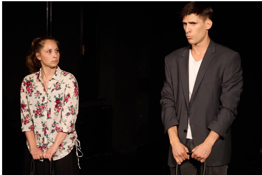
Slika 6 Scena prvog razgovora sa žirijem

Ne primijetivši u otimanju i borbi da su već došli pred vrata audicije, oboje ostaju iznenađeni, te istovremeno ulaze unutra i pred očima žirija se sudaraju. Od tog trenutka u razgovoru sa žirijem njih dvoje svatko na svoj način pokušava izgladiti situaciju i ostavljen loš početni dojam o sebi, te se trude predstaviti sebe na što bolji način. Zbog nastale situacije, na vidjelo izlaze njihovi karakteri i iskrenost, Ona je ovdje vidno uplašena, zbunjena i pod velikom tremom zbog neiskustva. On je s druge strane, pun samopouzdanja, siguran u sebe i jedva čeka da krene s izvedbom.