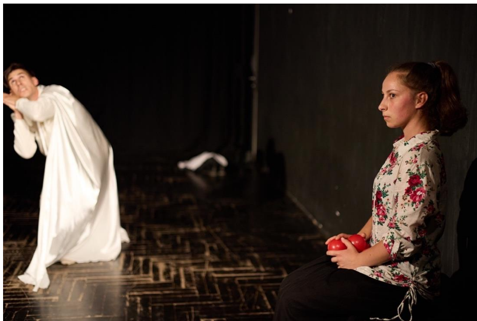
Slika 8 Njihova prva suradnja

Po završetku njegove etide nastavlja se razgovor sa žirijem: