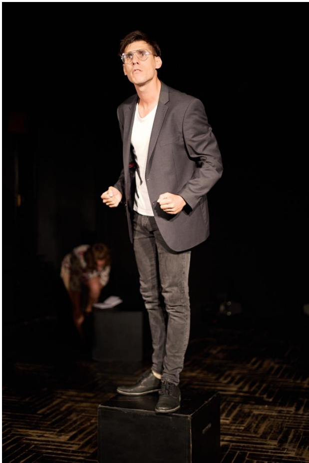
Slika 15 On u stanu u privatnom izdanju

On na početku predstave na sebi nosi bijelu majicu kratkih rukava, crne traper hlače i niske crne muške cipele. U pripremanju za odlazak na audiciju, oblači crni sako i stavlja naočale, no od njih ipak odustaje i na audiciju odlazi bez njih. Za njega je to privatna odjeća u kojoj odlazi na audiciju, a u crnoj kožnoj torbi nosi kostim koji je pripremio za audiciju. To je kostim za koji smo sami birali materijal i dali ga izraditi po mjeri kod krojača Zvonka Majdiša. Kostim se sastoji od hlača s prišivenim gumenim tregerima, košulje na drucker dugmad, plašta s vezicama oko vrata i čarapa. Kostim je u potpunosti bijele boje, hlače i košulja izrađeni su od jednakog materijala koji se pod svjetlom reflektora presijava, a sadrži i elastin što je nužno zbog praktičnosti pri izvođenju na sceni, kako ne bi došlo do pucanja materijala. Plašt je izrađen od puno lakšeg materijala, ali koji također pod svjetlima reflektora stvara svojevrsno presijavanje. On na licu ima samo puder i blago pojačane obrve, dok mu je kosa počesljana na natrag, kako bi mu lice bilo otvoreno i vidljivo.