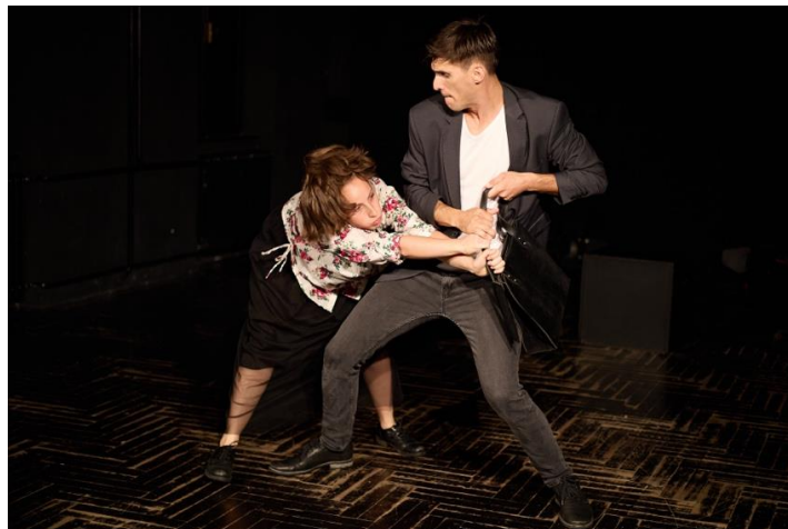
Slika 5 Scena otimanja torbe

Kod oba lika prisutni su trema i uzbuđenje, a dodatno im pažnju ometa i prisutnost drugog lika, te si oni pod utjecajem treme, uzbuđenja i gubljenja fizičke ravnoteže slučajno zamjenjuju torbe, tj. On zabunom uzima Njezinu torbu. Ona čim to shvati, uvjeren da joj je On ukrao torbu, odmah uzima Njegovu i trči za njim. Ta se scena brzo pretapa u sljedeću koja je potkrijepljena dinamičnim solo dijelom iz pjesme Ne mogu uhvatiti prolaznost , u kojoj Ona njega lovi kako bi uzela natrag svoju torbu, a njemu vratila njegovu. Na kraju ga uspijeva uhvatiti, te se oni prvo otimaju, a zatim uspješno vraćaju torbe jedno drugome.