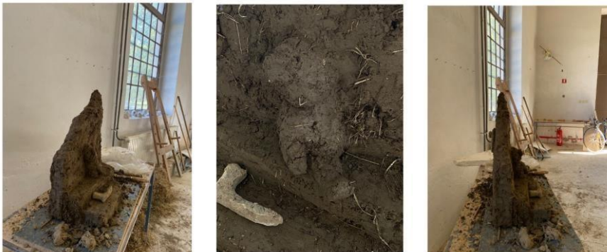
Slika 8. “Vrata”