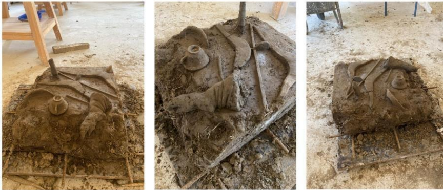
Slika 7. “Ormar”