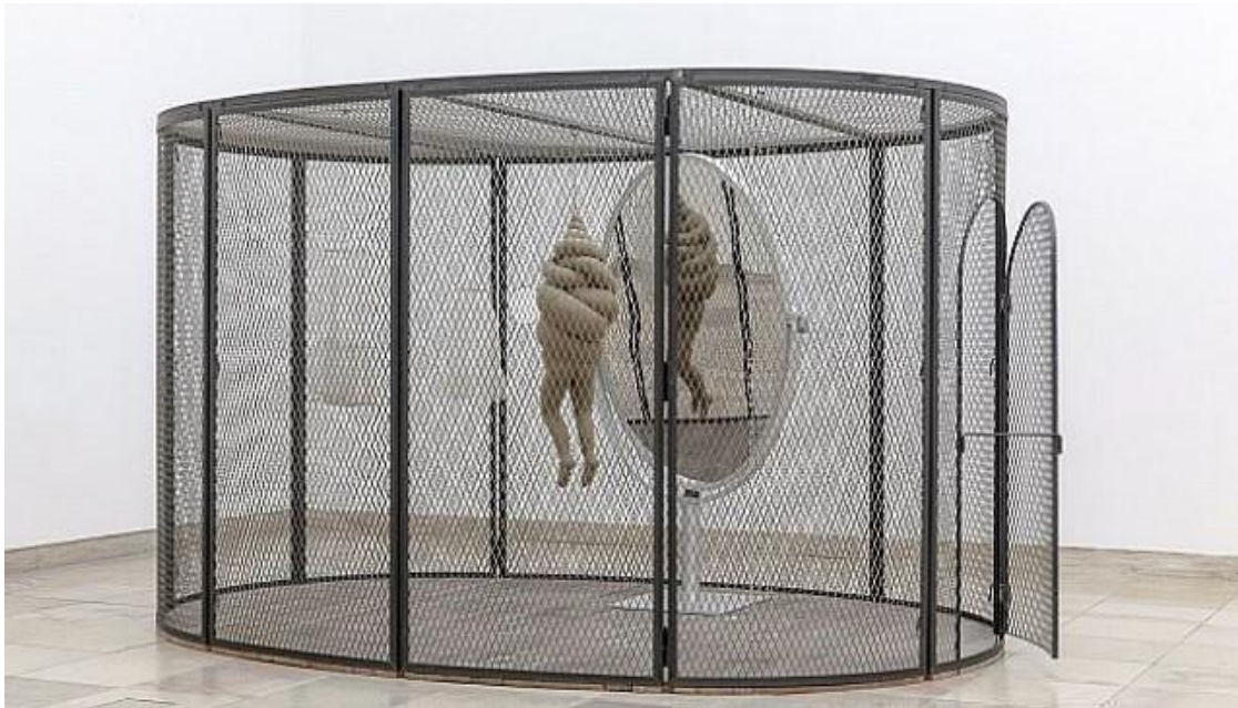
Slika 2. Louise Bourgeois, Ćelija XXVI, 2005., metal, tkanina, ogledalo

Još jedna bitna figura u polju reprezentiranja trauma u vizualnoj sferi je francuska umjetnica Louise Bourgeois koja se kroz materijale i procese u stvaranju svojih umjetničkih djela nosila sa prerađivanjem problematičnih i traumatskih sjećanjima iz djetinjstva. Serija od 60 radova pod imenom “Ćelije”, od kojih sam izdvojila primjere (slika 2. i 3.), nudi psihološki svijet vlastite borbe u eksploraciji doma iz djetinjstva, memorija i fantazija. Zatvorene forme instalacija su jedinstvene arhitektonske jedinice koje su po objašnjenju umjetnice “kuće koje udomljuju strahove”. Sagrađeni kao kavezi, svaka ćelija je ispunjena kolekcijom sakupljenih objekata koji su odraz njenog djetinjstva. U isto vrijeme zatvori patnje i kuće sigurnog raja, sadržavaju memorije traumatičnih događaja, ali isto tako i fantazije idealnog doma u smislu potrebe da rekonstruira svoju prošlost nad kojom može imati kontrolu i izmjeniti ju.