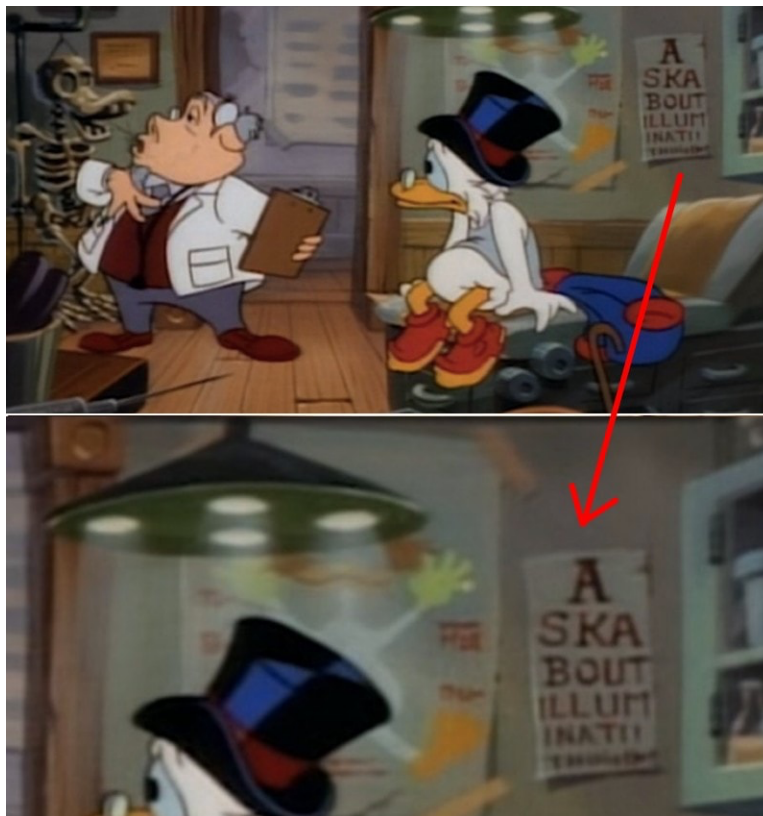
Slika 3. "Ask about Iluminati"

"Ljubitelji zavjera našli su razloga za slavlje nakon što su otkrili očitu poruku unutar epizode DuckTalesa na veliko zaprepaštenje opće publike. Tijekom Scroogeova posjeta liječniku, dijagram oka prikazan u pozadini odstupio je od uobičajenog niza proizvoljnih slova. Umjesto toga, jasno je ispisao izraz "pitajte o Iluminatima" (Vidi sliku 3.), što je prilično uznemirujuća poruka za uključivanje u crtani film. Podrijetlo ovog intrigantnog dodatka ostaje obavijeno velom neizvjesnosti. Ostaje nejasno radi li se o razigranom pothvatu pojedinog animatora ili o namjernom uključivanju. Do danas, priča koja stoji iza ove zagonetne poruke ostaje misterij, ostavljajući nas da razmišljamo o njevoj pravoj prirodi i namjeri." (Josh 2021)