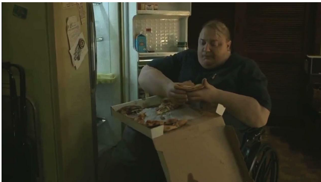
Slika 1. "The Whale" – Prikrivanje emocija hranom

"Misli da će mu život biti bolji ako samo ubije ovog kita, ali u stvarnosti mu to neće nimalo pomoći", intonira u bolno očitaj simbolici. „Ova me knjiga natjerala da razmislim o vlastitom životu“, dodaje kao da to ne možemo sami shvatiti.” Također, ovaj nas prikaz podsjeća na važnost priznavanja i rješavanja naših osjećaja krivnje na zdrav način. I u kinematografskim pričama i u stvarnom životu, prepoznavanje tih emocija može dovesti do rasta, empatije i boljeg razumijevanja naših motivacija (Vidi sliku 2.).