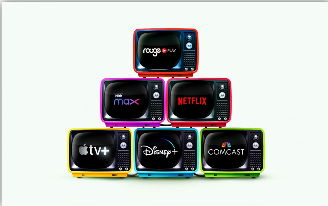
Slika 7. Streaming platforme

Televizija i platforme za streaming promijenile su način na koji konzumiramo sadržaj nudeći raznolik izbor zabave koji zadovoljavaju moderne navike gledanja. Tradicionalna televizija pružala je centralizirani izvor planiranog programa, vežući publiku za fiksna vremena i kanale. Međutim, platforme za streaming promijenile su ovaj model, dajući gledateljima neviđenu kontrolu nad time što, kada i gdje gledaju. Pogodnost pristupa na zahtjev revolucionirala je krajolik zabave, omogućujući pretjerivanje i personalizirano upravljanje sadržajem. Platforme za streaming u rasponu od globalnih divova poput Netflix i Disney+ do specijaliziranih usluga (Vidi sliku 7.), proširile su kreativne mogućnosti, omogućujući različitim narativima da pronađu svoju publiku. Unatoč tome, tradicionalna televizija i dalje drži svoje mjesto, nudeći događaje uživo, emitiranje vijesti i zajedničko iskustvo gledanja. Sinergija između televizije i platformi za streaming naglašava dinamičnu evoluciju potrošnje zabave, nudeći niz izbora koji zadovoljavaju različite preferencije i stilove života.