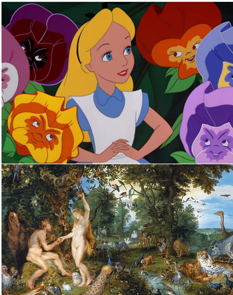
Slika 4. Usporedba Alise i Eve u vrtu

“Još jedno skriveno i simbolično tumačenje Alise u zemlji čudesa (eng. “Alice in Wonderland”), koje sugerira da Alisa utjelovljuje Evu, dobro poznatu biblijsku osobu. Alisino putovanje započinje unutar vrta, podsjećajući na Evina iskustva u Edenskom vrtu (Vidi sliku 4.). Dok Eva čini prekršaj tako što je jela zabranjeno voće, Alisa, naprotiv, silazi kroz zečju rupu u podzemni svijet koji vrvi zagonetnim likovima i moralno sumnjivim postupcima. I Eva i Alisa prolaze kroz transformaciju, odnosno prijelaz iz djetinjstva u odraslu dob - pomak od čistoće do prijestupa, drugim riječima, od nevinosti do nedjela.” (Josh 2021)