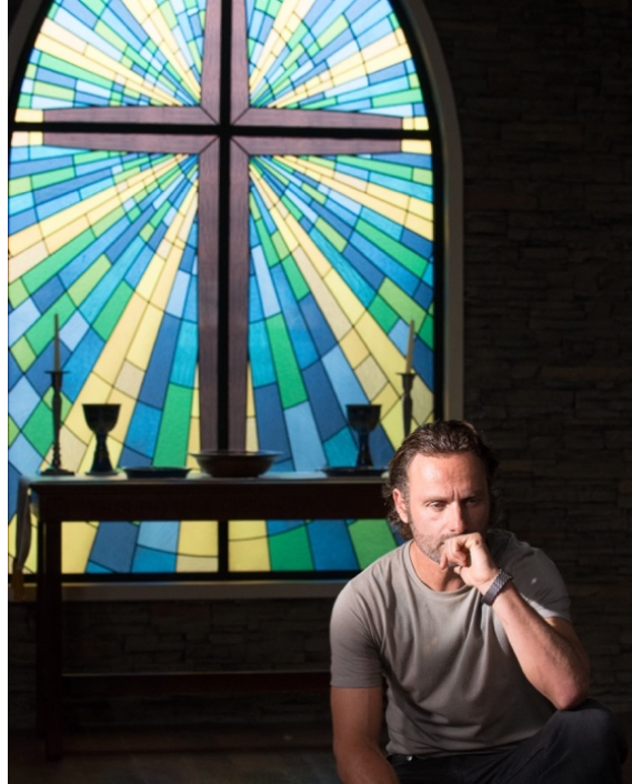
Slika 9. "The Walking Dead" – vitraj u crkvi