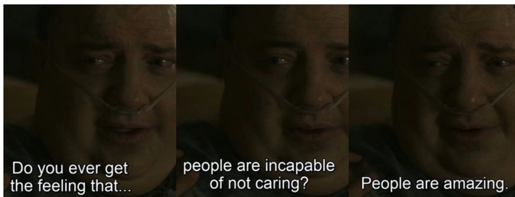
Slika 2. "The Whale" – Empatija