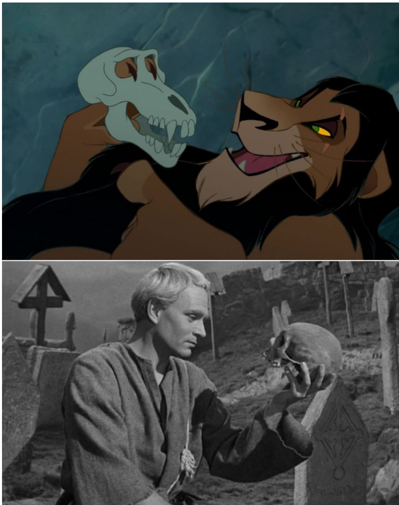
Slika 5. Usporedba scene iz Hamleta i one iz Kralja lavova

“Kralj lavova (eng. “The Lion King”) je zapravo suvremena animirana vizualizacija Shakespeareovog bezvremenog djela, Hamleta. Cjelokupna radnja povezana je s identičnim temama: podmukli ujak koji služi kao antagonist, prinčevo putovanje u izgnanstvo i kasniji povratak kako bi osvetio svog oca, naposljetku ponovno zauzevši prijestolje. Trenutak u kojem se Scar poigrava lubanjom ima izravnu aluziju na izvorni materijal, podsjećajući na kulturnu scenu u kojoj Hamlet nailazi na Yorickovu lubanju” (Vidi sliku 5.). (Josh 2021)