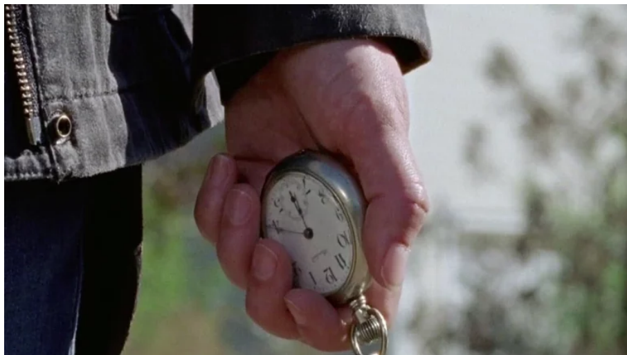
Slika 10. "The Walking Dead" – ponavljajuća slika sata