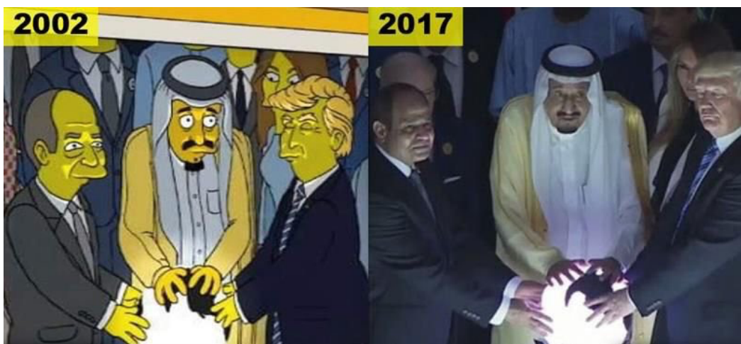
Slika 11. Predviđanje budućeg stvarnog događaja

Doskočice likova, motivi koji se ponavljaju i šale iznutra tvore subliminalne niti koje se protežu kroz seriju. Ovi znakovi stvaraju zajednički jezik između serije i njezine posvećene baze obožavatelja povećavajući osjećaj zajednice i angažmana. Spomenuti primjeri pokazuju kako "Simpsonovi" koriste subliminalne znakove kako bi poboljšali svoje pripovijedanje, humor i povezanost s publikom, čineći ga nezaboravnom i kulturnom animiranom serijom. (Božić i Crnković 2023)