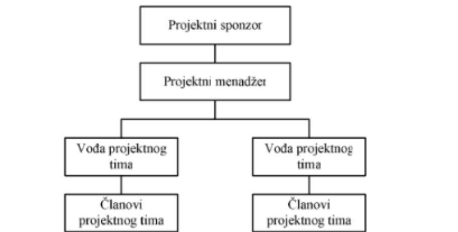
Slika 2. Prikaz položaja vođe projektnog tima

Berić et al. (2009:263) navode da je projektni menadžer osoba čiji je zadatak pružiti učinkovit završetak projekta u suradnji sa sudionicima na projektu i projektnim timom. Projektni sponzor projektnom menadžeru daje naputke i omogućuje mu povezanost s organizacijom i njezinim top-menadžmentom. Berić et al. (2009:264) tvrde da je vođa projektnog tima osoba kojoj je nadređen projektni menadžer i izravno mu odgovara. Njegova je zadaća najvećim dijelom voditi projektni tim. Na Slici 2. nalazi se hijerarhijski prikaz položaja vođe projektnog tima.