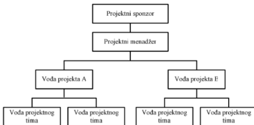
Slika 3. Prikaz položaja vođe projekta