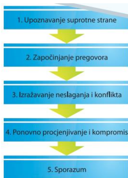
SLIKA 1. Faze procesa pregovaranja

Slika 1. prikazuje grafički prikaz koraka potrebnih u procesu pregovaranja. Najvažniji korak jest upoznavanje s drugom stranom i njezinom percepcijom procesa pregovora. Sa sporazumom zaključujemo cijeli proces pregovora u kojem su obje strane zadovoljene.