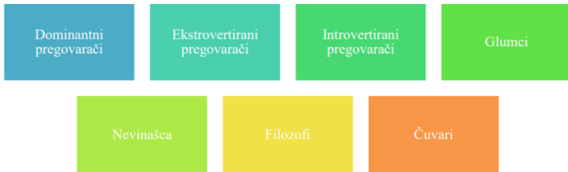
SLIKA 3. Podjela pregovarača