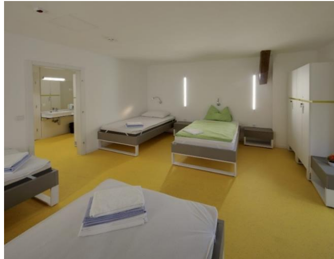
Slika 3. Unutrašnjost samog Hostela; soba za noćenje

Zgrada Stare pekare sadrži i hostel koji raspolaže s 55 kreveta u 15 smještajnih jedinica s vlastitim sanitarnim prostorom (Glas-Slavonije.hr, 2021.,19.6.2023.). Dio tih prostora prilagođen je potrebama osoba s invaliditetom. Tu se nalaze i velika blagovaonica, recepcija te dodatni sanitarni prostor. U ponudi je noćenje s doručkom te slične kombinacije. (Glas-Slavonije.hr, 2021.,19.6.2023.)