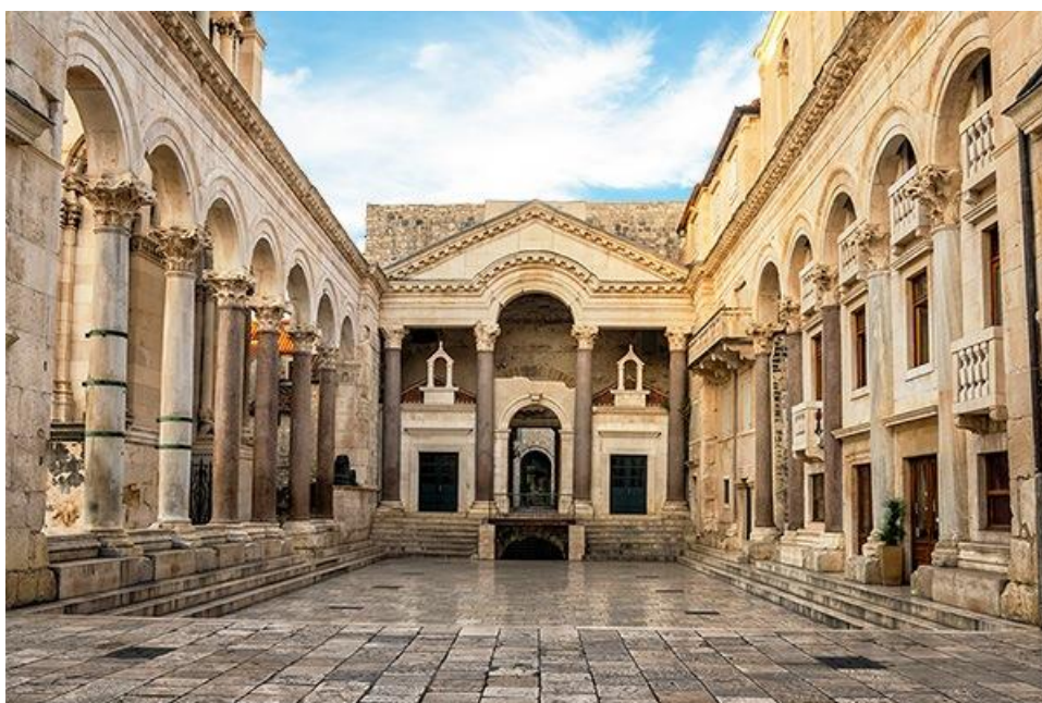
Slika 13. Unutrašnjost palače

Glavne su se ulice spajale u središtu palače, a uz njih se prema jugu prostirao otvoreni prostor – peristil, obrubljen stupovima s lukovima. Sakralni prostori istočno i zapadno od peristila bili su omeđeni zidovima. U istočnom prostoru do danas je sačuvana monumentalna građevina (nazvana Dioklecijanov mauzolej), vanjskog osmerokutna i unutarnjega kružna tlocrta, presvođena kupolom od opeke i iznutra odijeljena dvama nizovima stupova i vijenaca te frizom, u kojem su očuvana poprsja Dioklecijana i njegove supruge Priske. “ (Dioklecijanova palača. Hrvatska enciklopedija, mrežno izdanje . Leksikografski zavod Miroslav Krleža, 2021., 19.06.2023.)