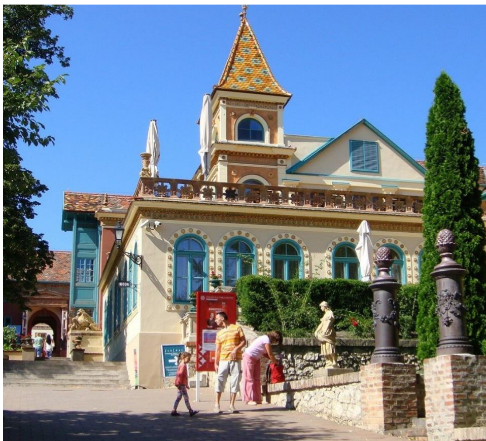
Slika 11. Dio Kulturne četvrti Zsolnay