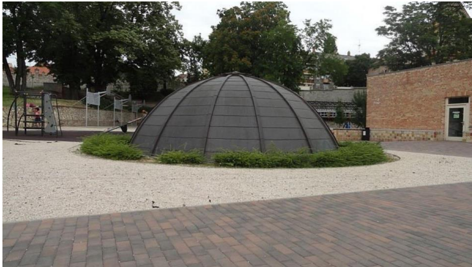
Slika 10. Planetarij Zsolnay

zajednica isplanirao i izveo besprijekorno. Kako bi takva inicijativa opstala, bitno je bilo u samu Četvrt staviti mnogo različitog sadržaja koji će ponuditi raznim turističkim skupinama točno ono što traže. Stoga je u sadržaj uvršteno sljedeće: tvornica, planetarij, lutkarsko kazalište i drugo. Kao pravo kulturno središte velikih i malih, zabave i učenja, opuštanja i hrane, Kulturna četvrt Zsolnay uspjela je postići visoki standard velikom ponudom.