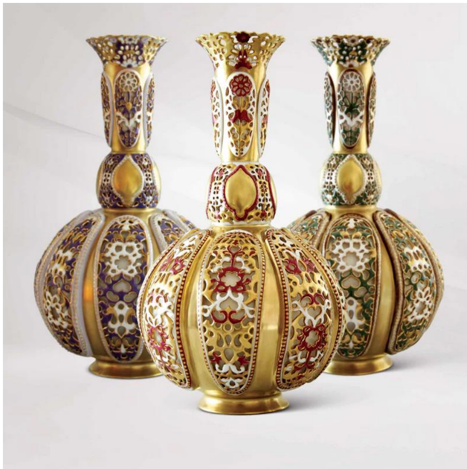
Slika 8. Primjeri porculana Zsolnay