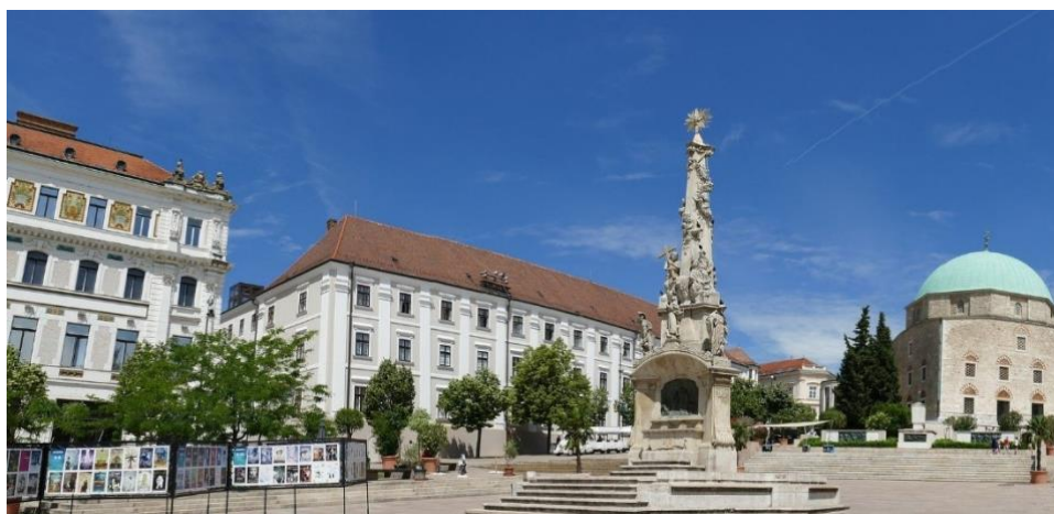
Slika 9. Dio Kulturne Četvrti Zsolnay

dosta toga..., 20.06.2023) Četvrt je dobila veliku podršku upravo zbog titule Europske prijestolnice kulture 2010. godine. Prepoznao se potencijal u gore navedenim tehnikama kreiranja i oslikavanja porculana te je time krenula suradnja za obnavljanje.