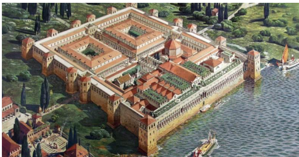
Slika 12. Tlocrt Dioklecijanove palače u svoje vrijeme

Glavne su se ulice spajale u središtu palače, a uz njih se prema jugu prostirao otvoreni prostor – peristil, obrubljen stupovima s lukovima. Sakralni prostori istočno i zapadno od peristila bili su omeđeni zidovima. U istočnom prostoru do danas je sačuvana monumentalna građevina (nazvana Dioklecijanov mauzolej), vanjskog osmerokutna i unutarnjega kružna tlocrta, presvođena kupolom od opeke i iznutra odijeljena dvama nizovima stupova i vijenaca te frizom, u kojem su očuvana poprsja Dioklecijana i njegove supruge Priske. “ (Dioklecijanova palača. Hrvatska enciklopedija, mrežno izdanje . Leksikografski zavod Miroslav Krleža, 2021., 19.06.2023.)