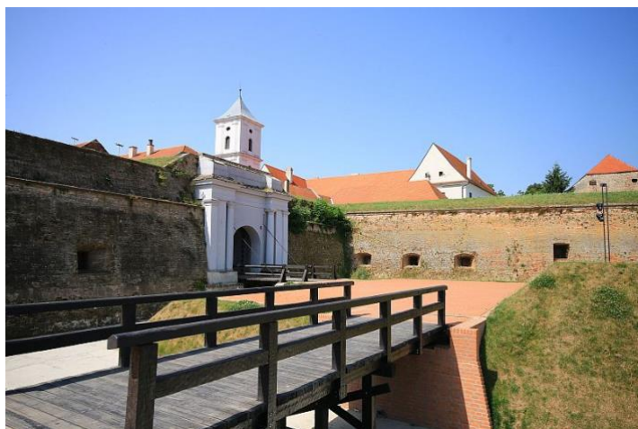
Slika 5. Prikaz starih zidina

Uočljivo je kako je za postanak Osijeka kakav je danas bitna spomenuta stara jezgra. Kako bi se Osijek mogao prikazati kao grad koji njeguje svoje kulturno i baštinsko naslijeđe i kako bi mogao turistima prikazati sve svoje zanimljivosti, bitno je Tvrđu održavati u dobrom svjetlu. Tako je i krenuo projekt osječke Tvrđe 2021.-2027. kojeg "...vodi Agencija za obnovu osječke Tvrđe (AOOT) u suradnji sa izrađivačem, tvrtkom Karzen i Karzen d.o.o. iz Zagreba i Gradom Osijekom" (Agencija za obnovu Tvrđe, Novosti, 19.06.2023.) Iako je tek druga godina obnove, promjene se osjete već hodanjem novopopločanim ulicama, koje su preglednije, a samim time i vizualno urednije.