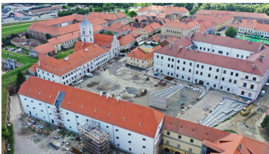
Slika.2 Obnova vanjskog dijela Stare Pekare

Na istoku Hrvatske 2019. godine proveden je projekt “Edukativni i informativni turistički centar mladih Stara Pekara s Trgom Vatroslava Lisinskog”. Vrijednost samoga projekta bila je oko 66 milijuna kuna od čega je 52 milijuna financirano iz europskih fondova prema Gradu Osijeku (Osijek.hr, 2019.,19.6.2023.). Sami objekt je zgrada stare austrougarske pekarnice još iz 18. stoljeća, a danas nudi usluge hostela s restoranom te edukativni i informativni turistički centar mladih. U dvorištu zgrade održavaju se razni festivali, koncerti i slične manifestacije.