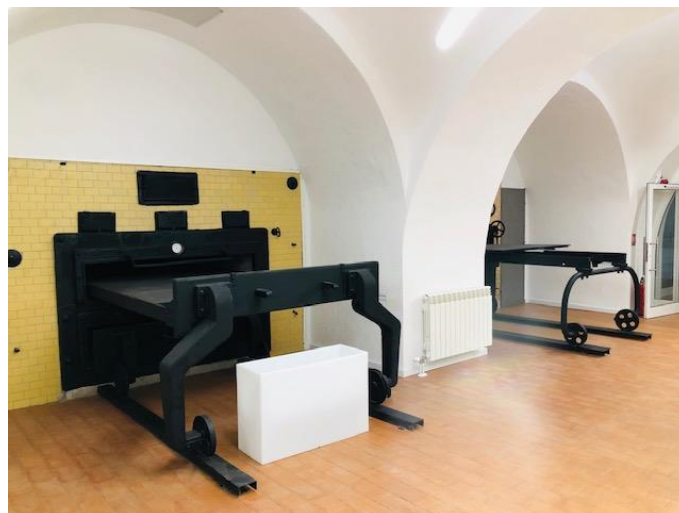
Slika 4. Detalj povijesti u novom hostelu