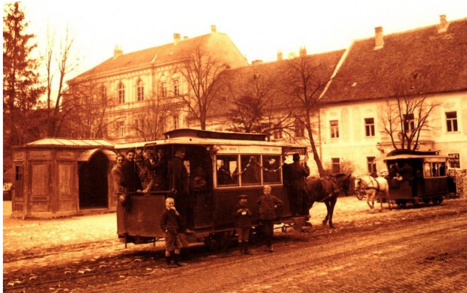
Slika 7. Prva tramvajska linija u Hrvatskoj koja je prolazila kroz Tvrđu

Tako je došla na vidjelo ideja o postavljanju linije za oznaku prve tramvajske linije u Hrvatskoj koja je išla baš kroz Tvrđu, što je veliki napredak u povijesti Hrvatske.