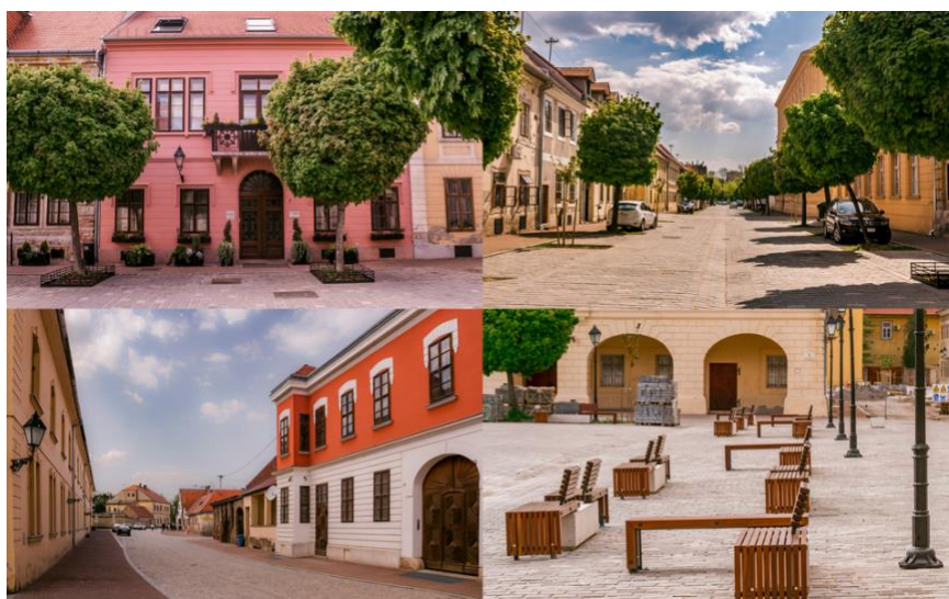
Slika 6. Obnovljeni dijelovi osječke Tvrđe

Uočljivo je kako je za postanak Osijeka kakav je danas bitna spomenuta stara jezgra. Kako bi se Osijek mogao prikazati kao grad koji njeguje svoje kulturno i baštinsko naslijeđe i kako bi mogao turistima prikazati sve svoje zanimljivosti, bitno je Tvrđu održavati u dobrom svjetlu. Tako je i krenuo projekt osječke Tvrđe 2021.-2027. kojeg "...vodi Agencija za obnovu osječke Tvrđe (AOOT) u suradnji sa izrađivačem, tvrtkom Karzen i Karzen d.o.o. iz Zagreba i Gradom Osijekom" (Agencija za obnovu Tvrđe, Novosti, 19.06.2023.) Iako je tek druga godina obnove, promjene se osjete već hodanjem novopopločanim ulicama, koje su preglednije, a samim time i vizualno urednije.