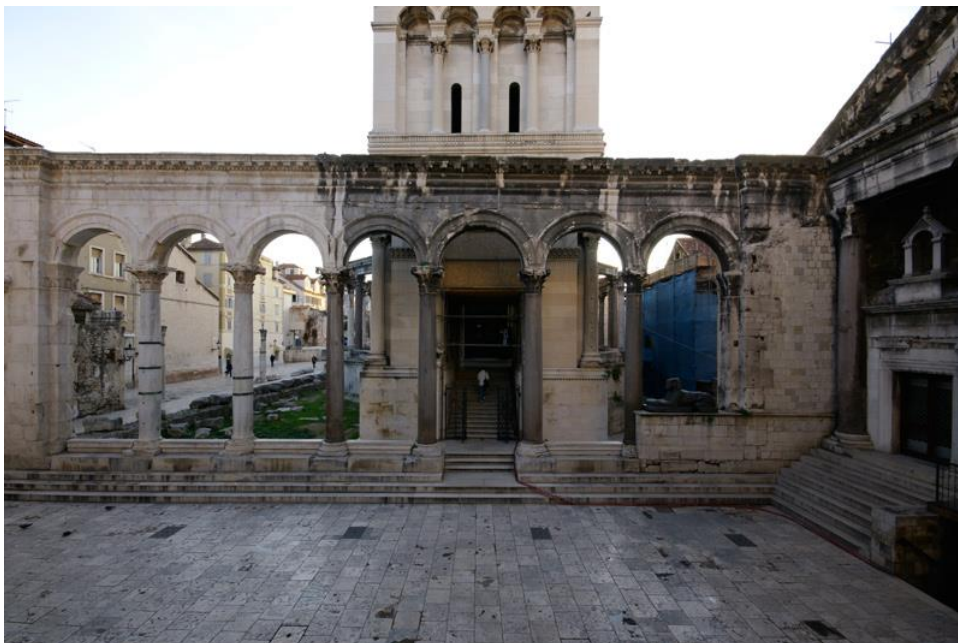
Slika 14. Proces čišćenja kamena Peristila