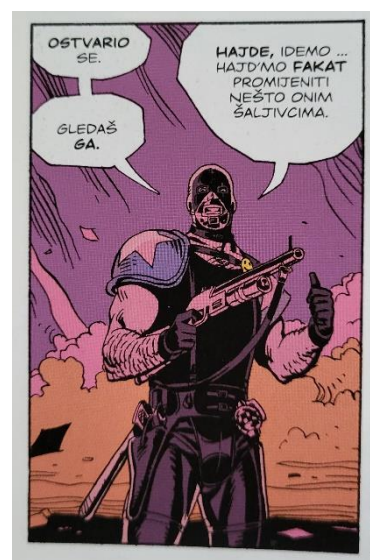
Slika 32 Čuvari, Američki san, poglavlje 2, 58. str.

Dok je bio u Saigону, udružio se s Dr. Manhattanom koji se pridružio ratnim naporima u ožujku 1971. Zajedno su odigrali glavnu ulogu u ratu SAD-a s Vijetnamom. Ubrzo nakon što su moći Manhattana prisilile Sjeverne Vijetnamce na potpunu predaju, Blake se suočio s Vijetnamkom kojoj je očito napravio dijete. Otvoreno joj je rekao da planira odmah otići iz zemlje bez nje, a ona mu je u bijesu razbijenom bocom ozlijedila lice. Blake ju je upucao i ubio što je već viđeno na slici 7. Njegova je ozljeda dovela do unakazujućeg ožiljka koji mu se