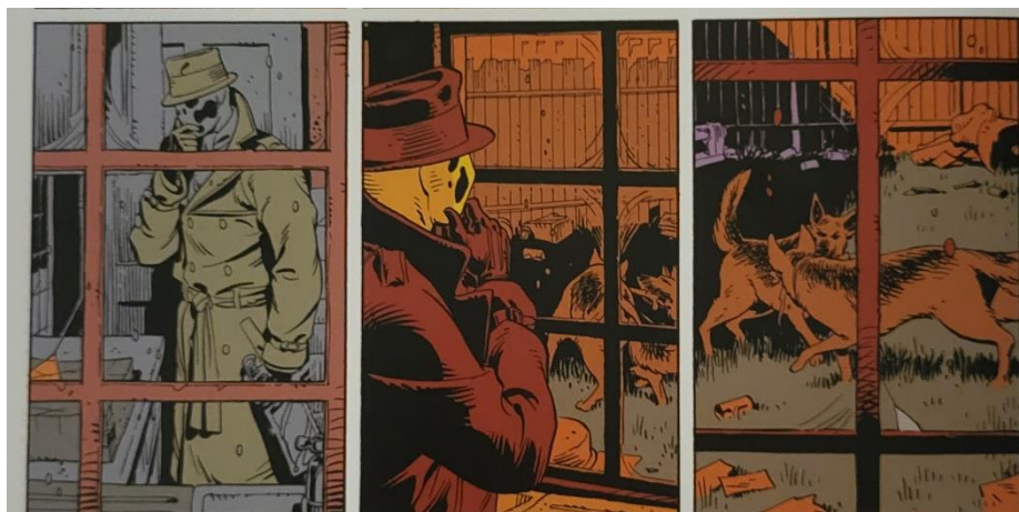
Slika 19 Čuvari, Otmica Blai Roche, poglavlje 6, 196. str., © DC Comics

U 60-im godinama 20.stoljeća pridružio se Crimebustersima , no sama ekipa bila je kratkog vijeka. Unatoč tome, udružio se s kolegom iz Nite Owl II partnerstvom koje se pokazalo vrlo uspješnim u borbi protiv organiziranog kriminala. Godine 1975. istraga o otmici mlade djevojke po imenu Blair Roche dovela ga je do psihotičnog sloma i on je kao rezultat toga postao nemilosrdno beskompromisan. (slika 19) „Šok od udarca osjetio sam cijelom rukom. Mlaz topline zalio mi je prsa, poput vrele slavine. Kovacs je tad rekao lateksom prigušeno "majko", Kovacs je tad sklopio oči. A Rorschach ih je otklopio." (Gibbons & Moore, 2013:197).