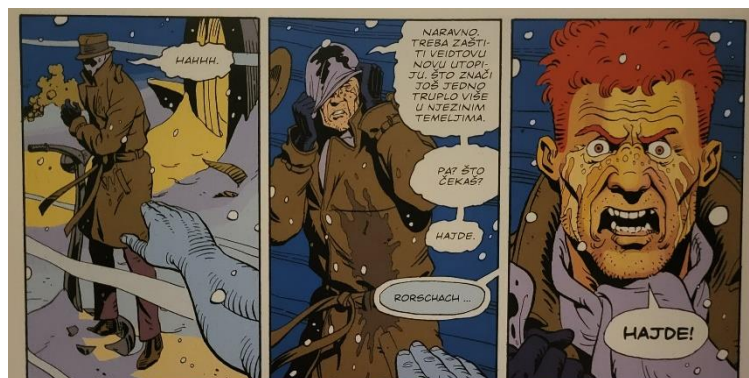
Slika 21 Čuvari, Rorschachova smrt., poglavlje 12, 404. str., © DC Comics