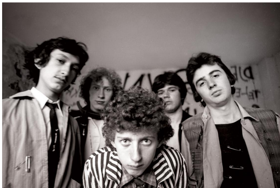
Prilog 4. Prljavo Kazalište