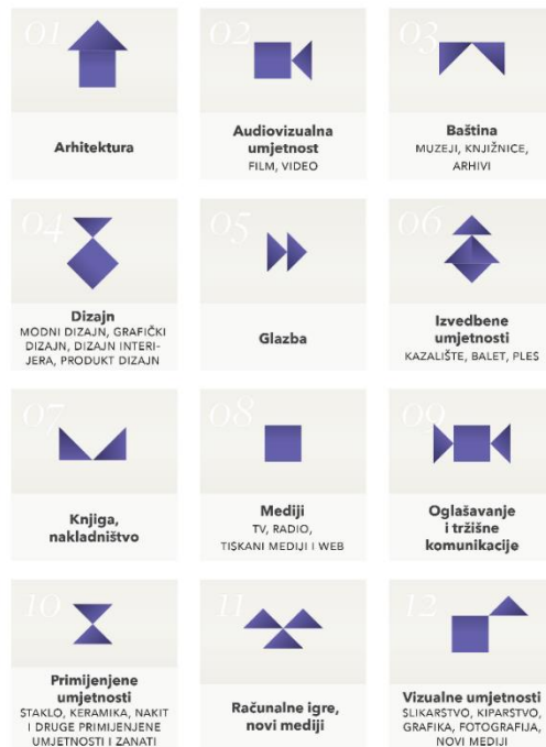
Slika 1. Sektori kreativne industrije