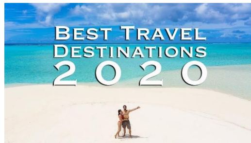
Slika 3. Niša putovanja