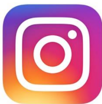
Slika 7. Logo društvene mreže Instagram

Njegovi su tvorcii Kevin Systrom i Mike Krieger koji su odlučili u fokus cijeloga projekta staviti fotografije. Projekt je vrlo brzo napredovao, a velik uspon doživio je pojavom sada već svima poznatih „hashtagova“. Oni služe lakšem pronalaženju fotografija od strane korisnika prema tematici koja ih zanima. Nedugo zatim, 2012. godine Instagram počinje pisati svoju povijest, a presudan trenutak dogodio se kada ga je za 1 milijardu dolara odlučio kupiti, ni manje ni više nego – Facebook. Otad pa sve do danas Instagram neprestano raste. Kada bismo usporedili iznos koji je Facebook izdvojio za Whatsapp (19 milijardi dolara) s iznosom izdvojenim za Instagram, uz svakodnevni uspjeh koji ostvaruje, smatramo da je Zuckerberg napravio pravi potez. Dokaz je i taj što mu je do danas vrijednost porasla 100 puta te je trenutno veća od 100 milijardi dolara. ( markething.hr )