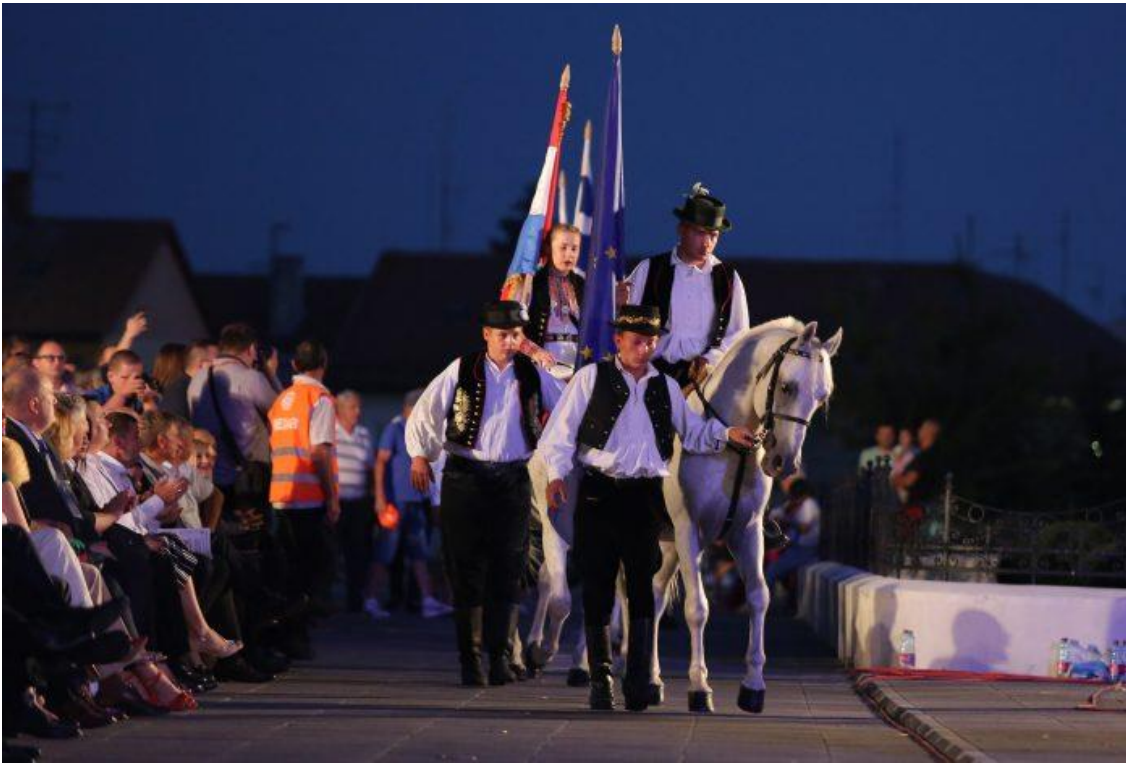
Slika 4. Svečano otvorenje 53. Đakovačkih vezova ispred đakovačke katedrale