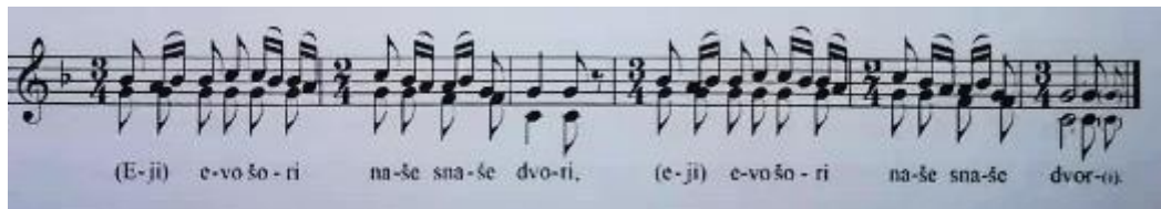
Slika 2. Melodijska linija vodećeg glasa slavonskog napjeva.

Uz navedene nizove, posebice u vodećem glasu svadbenih pjesama, javlja se samo terakord 1-1/2-1 (f 1 g 1 as 1 b 1 ) uz koji se ispod završnog tona (g 1 ) dodaje čista kvinta (Bezić, 1974, navedeno u Drenjančević, 2013).