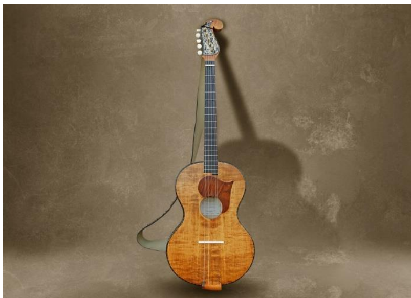
Slika 3. Tamburaški brač