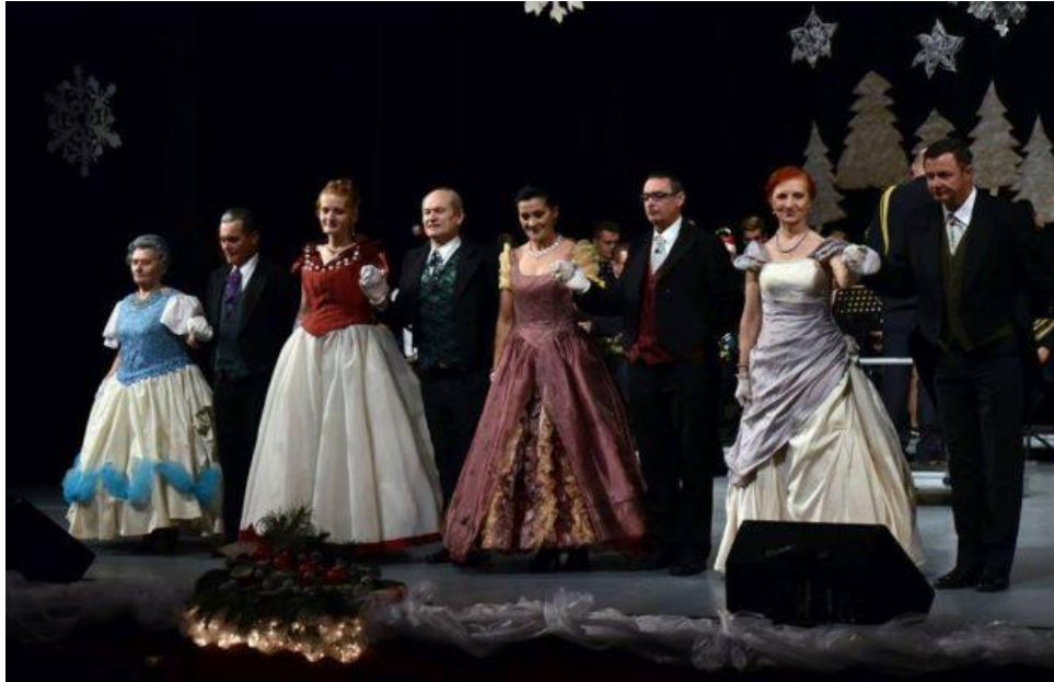
Slika 6. 21. Smotra povijesnih i građanskih plesova i starogradskih pjesama Hrvatske (2018.)