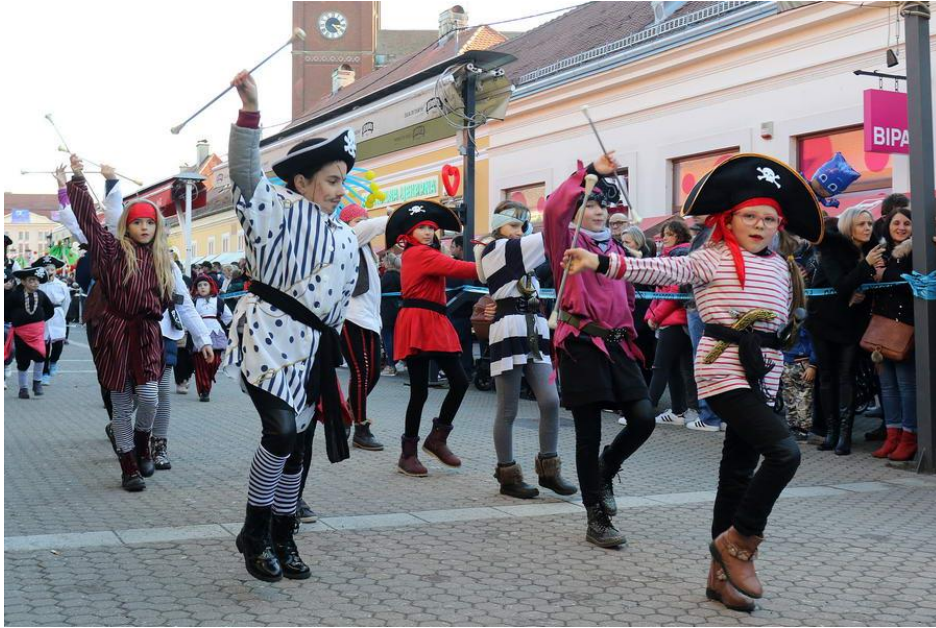
Slika 5. Đakovački bušari (Izvor: http://www.glas-slavonije.hr/galerija/669/25-Djakovacki-busari/1 ).

Manifestaciju čine Pokladna gastro festa – ”Mrsna i nemrsna jela kroz poklade i korizmu” i Pokladna povorka. U povorci sudjeluju kulturno-umjetnička društva, škole, vrtići iz Đakova i Đakovštine, kao i mnoge gostujuće skupine.