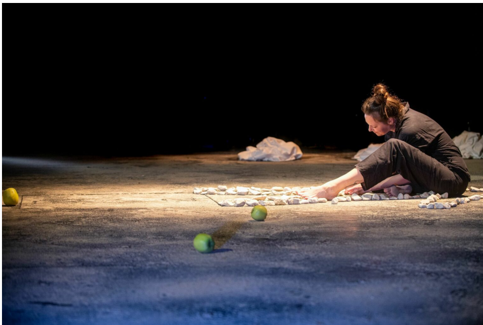
Prilog 3. Fotografija s premijere, Hrvatski kulturni dom na Sušaku