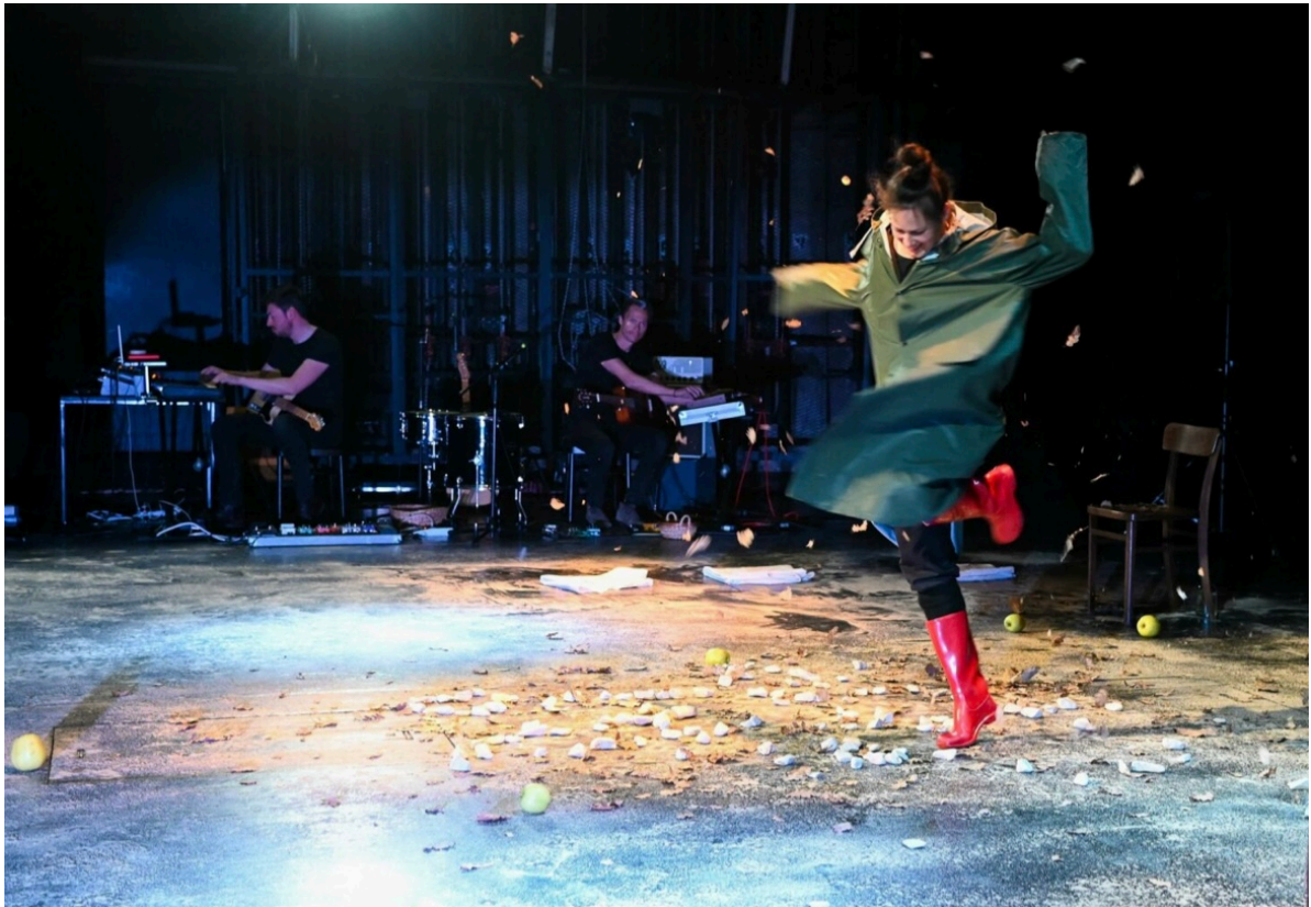
Prilog 2. Fotografija s premijere, Hrvatski kulturni dom na Sušaku