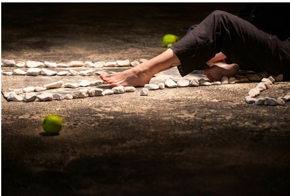
Prilog 4. Fotografija s premijere, Hrvatski kulturni dom na Sušaku