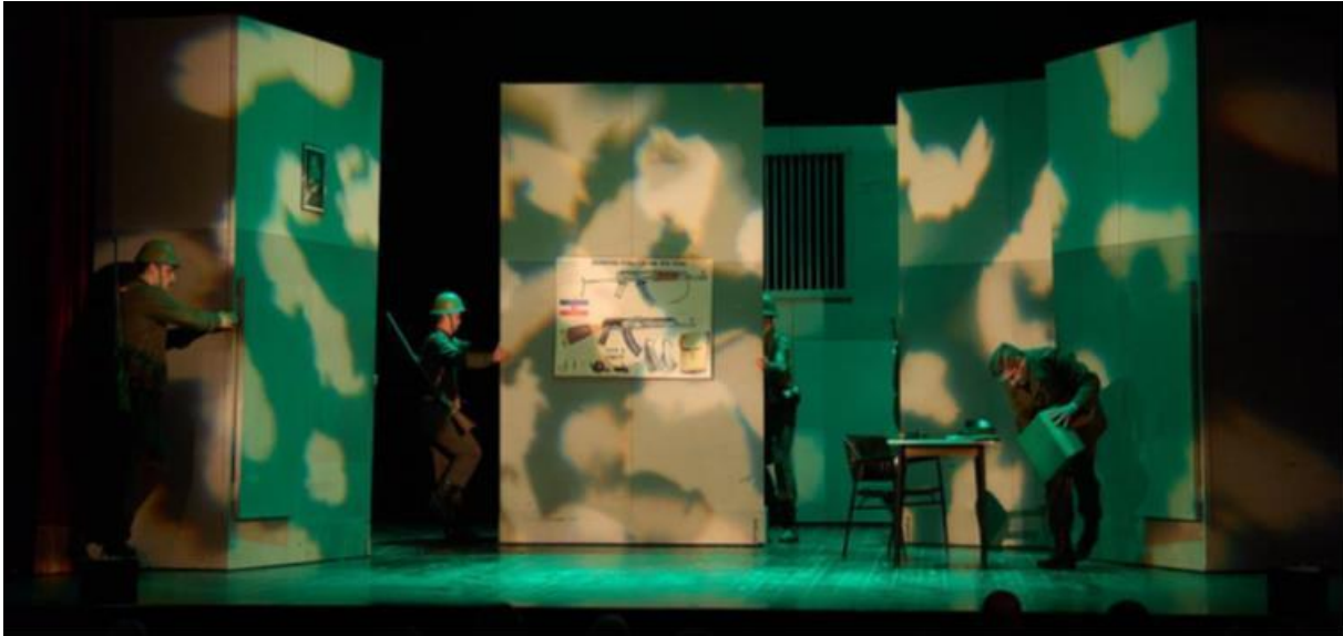
Sl. 3 Scenografija i svjetlo

Za scenografiju je bio zaslužan Davor Molnar, koji je u suradnji s profesorom napravio praktičnu, a opet vizualno vjerodostojnu scenografiju. Sastojala se od velikih zidova koji su imali kotače i tako nam davali mogućnost da brzo i efikasno prelazimo iz scene u scenu, rotirajući te zidove i postavljajući ih u zadanu formaciju. Te prijelaze se slobodno može nazvati mini koreografijama. Scenografija je bila brzo gotova i to nam je uvelike olakšalo jer smo prilično brzo dobili dojam prostora u kojem možemo igrati i uvježbavati prijelaze.