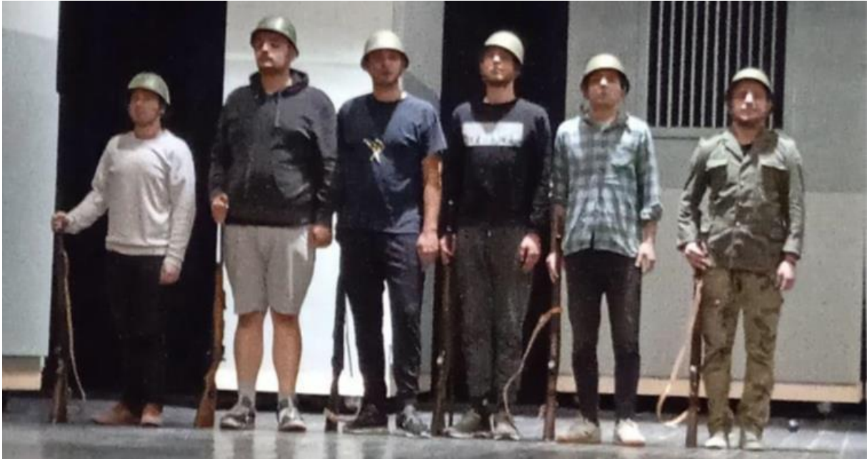
Sl.1 Prva proba u prostoru

koje smo prečesto sad već čuli. Svakom rečenicom smo tražili smijeh kolega ili sam to samo ja, ali to nije bilo dobro jer onda ovi dijelovi gdje smo trebali biti ozbiljni nisu dolazili do izražaja. Bilo je vrijeme da uđemo u prostor.