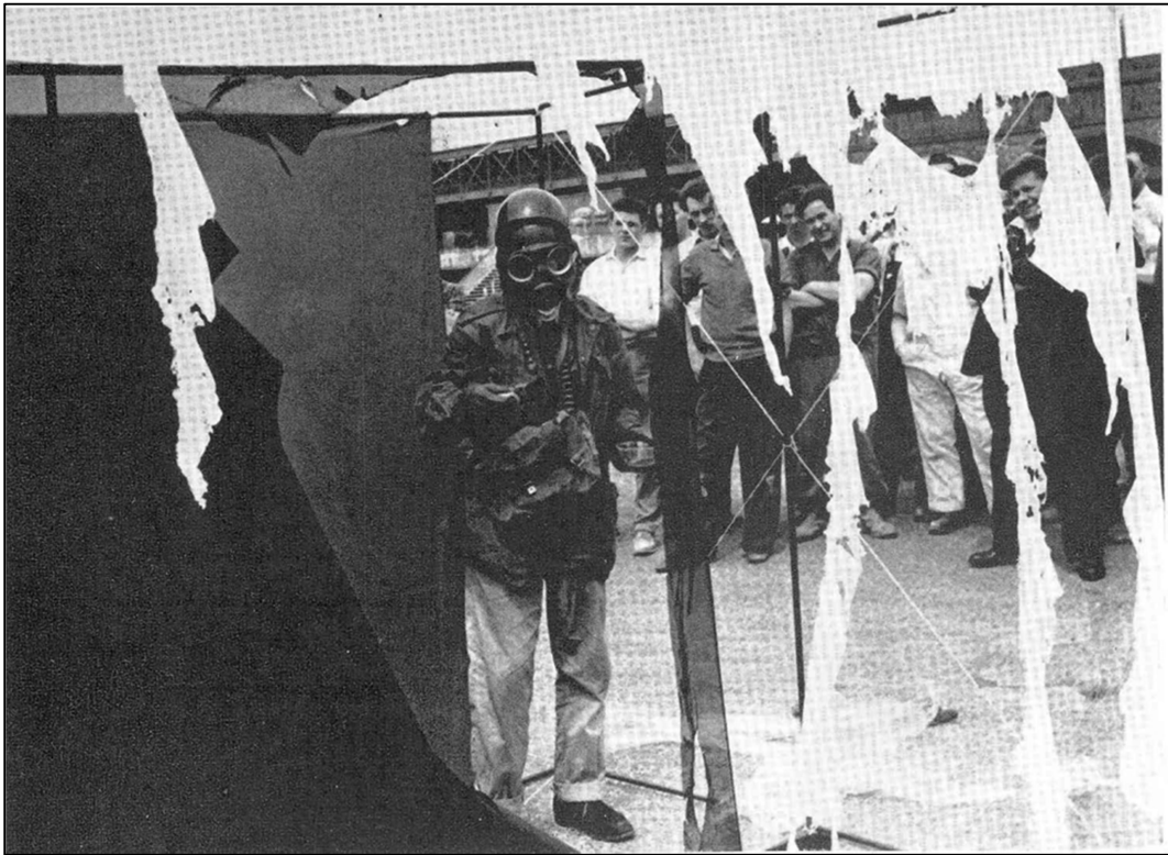
Slika 5. Demonstracija autodestruktivne umjetnosti, , South Bank, London, 3. srpnja 1961