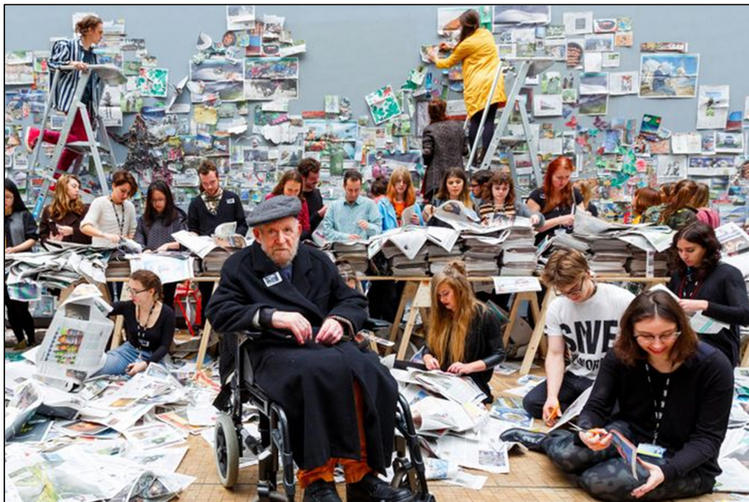
Slika 6. Gustav Metzger sa studentima iz Central St Martins na dan akcije Remember Nature 2015.