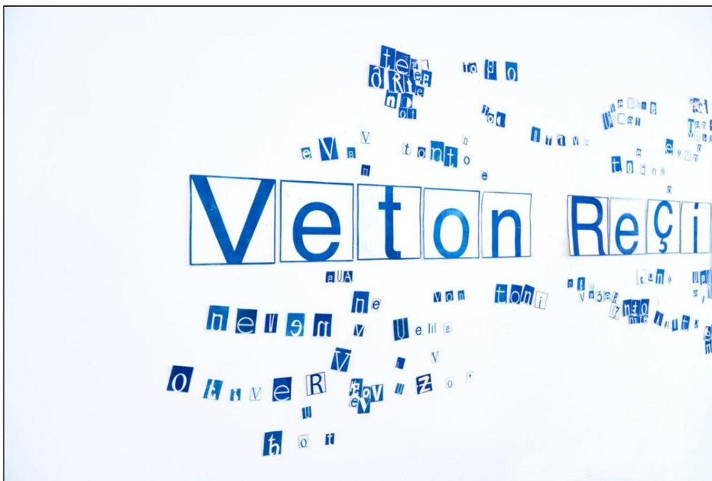
Slika 2. Fotografija glavnog segmenta

Glavni segment se sastoji od jedanaest vodoravnih fotografija, izrađenih fotografskom tehnikom cijanotipije, koji su poredani u niz tako da sačinjavaju moje ime i prezime, u formatu 20cm x 20cm. Fotografije trebaju biti postavljene na bijeli zid koji je idealna podloga i može istaknuti svaki od segmenata. Tako istaknuti, njihovo prisustvo preuzima cjelokupnu prostoriju i koncentraciju promatrača. Odabir cijanotipije kao tehnike otiska, nasuprot grafičke tehnike linoreza ili sitotiska, jest simbolika i estetika rada koju sam želio prikazati. Uz otisak izrađen cijanotipijom, i font Helvetice također doprinosi „ispranom“ izgledu, poput nečega prisutnog već duže vrijeme. Kao da je i sama priroda odlučila da je to tako, unatoč etimološkom značenju moga imena. Naravno, posve je realno da promatrač odmah, pri prvom promatranju, ne razumije značenje riječi u kontekstu rada, ali rad ga može potaknuti na promišljanje o viđenom. Uz dodatne segmente koji radu daju trodimenzionalnost promatrač i sam pokušava dodati novo ime.