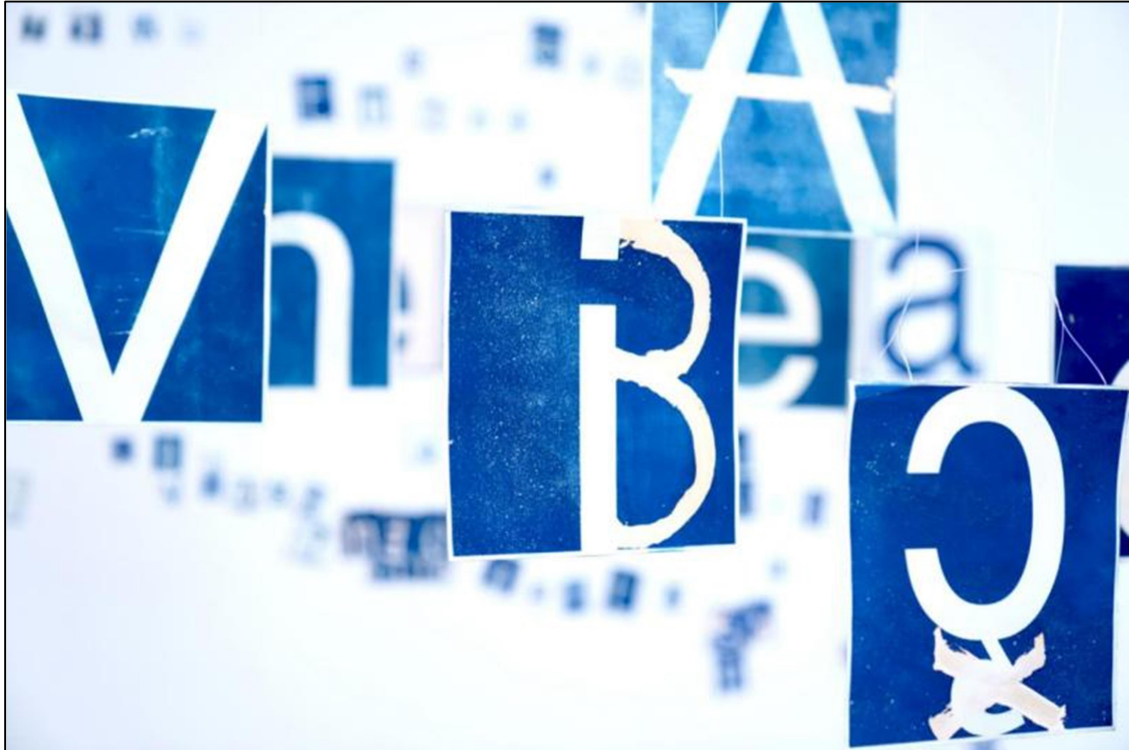
Slika 4. Fotografija trećeg segmenta