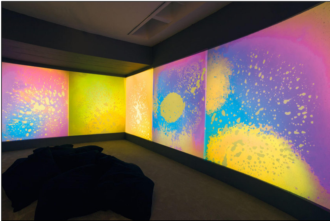
Slika 7. Liquid Crystal Environment 1965/2005, s izložbe Gustav Metzger