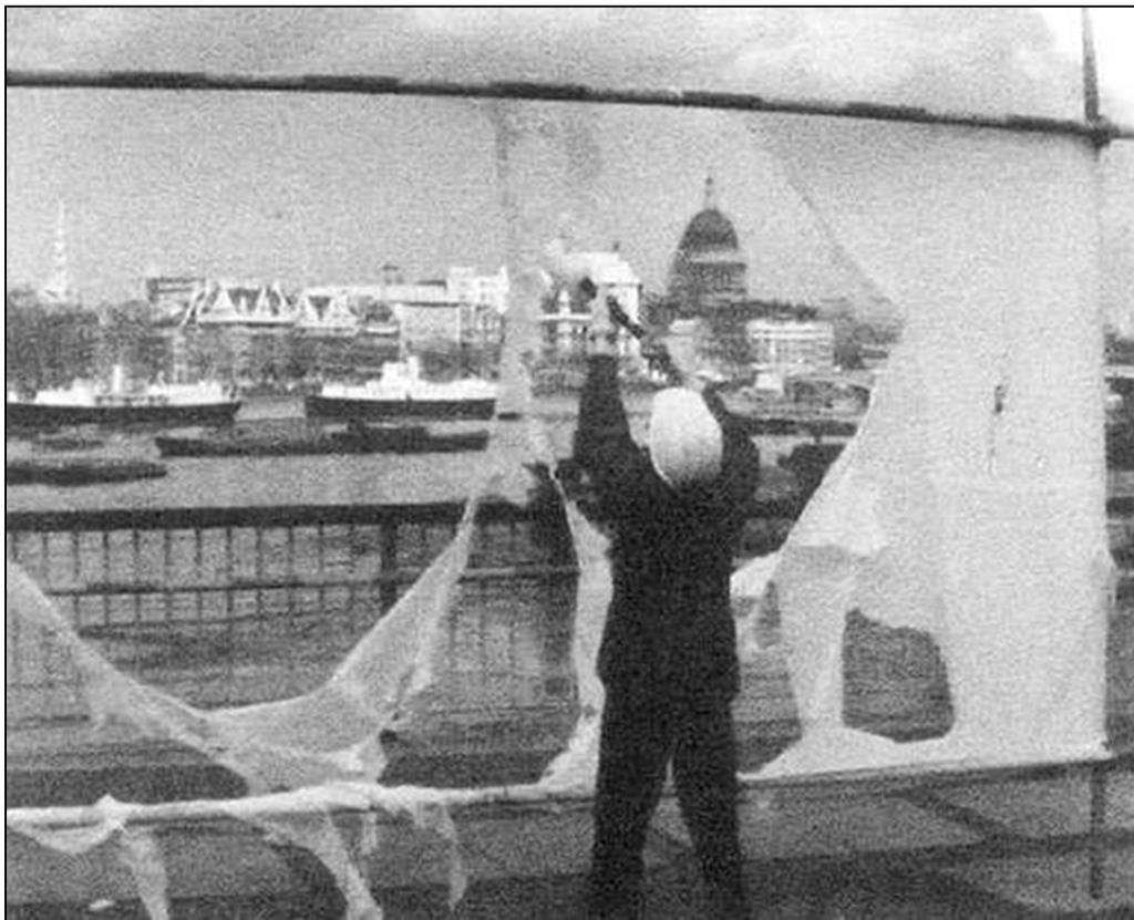
Slika 8. Slikanje s solnom kiselinom na najlonu, 1961