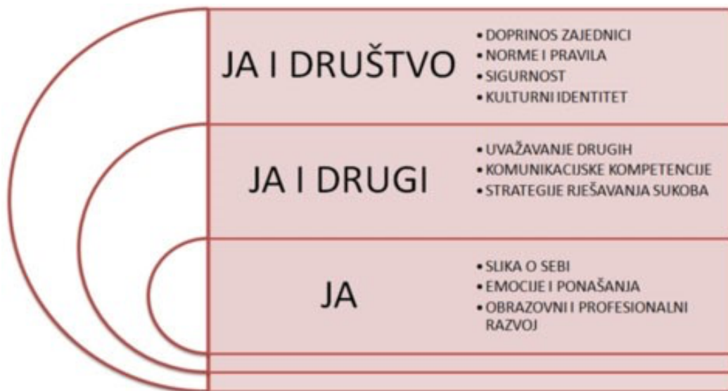
Ilustracija 2. Grafički prikaz domena u međupredmetnoj temi Osobni i socijalni razvoj. Preuzeta s: https://skolazazivot.hr/medupredmetne-teme/ , 03.09.2022.)

Domena A (Ja) ima svrhu upoznavanja i prihvaćanja sebe, razvitak samokontrole, ustrajnosti, pronalaženje vlastitog puta i zadovoljstva životom. Kad učenici uvide svoje mogućnosti, sposobnosti, vrijednosti i potrebe, prepoznaju i osvještavaju svoj značaj i potencijal, mjesta namijenjena za napredak, ali i sve ono što im se može uskratiti ili ih ograničiti. Domena A obuhvaća: ono što jesam, ono što mogu, prepoznavanje, izražavanje i kontroliranje osjećaja i ponašanja, razvitak potencijala vlastitih želja, planiranje aktivnosti, postavljanje prioriteta te upravljanje obrazovnim i profesionalnim putem.