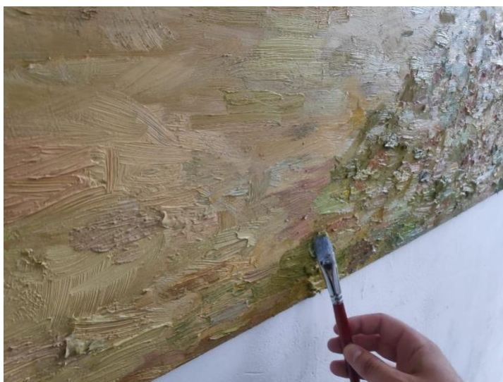
Slika 17. Pastuozno nanošenje boje