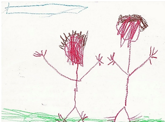
Slika 6. Luka, 7. god

glavoboljom. Crtežom dominira crna boja, dok je crvenom, ljubicastom i zelenom bojom prikazao trenutke kada ga manje boli glava. Dječak je kao likovnu tehniku izabrao akvarel. Prema linijama vidljivo je da se koristio debelim kistom. Linije su prikazane u različitim smjerovima, zbog čega crtež djeluje dinamičan i afektivan. Osim toga linije su guste, nejednolične i oštre.