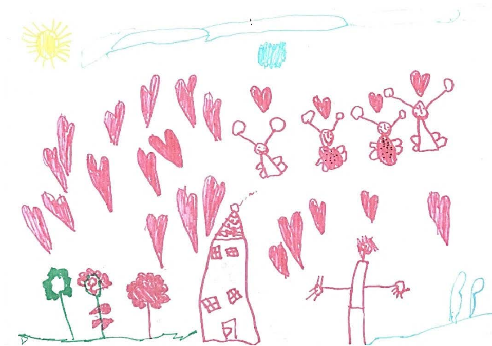
Slika 4. Noa, 6.god. (izjava: Tata dolazi doma s broda!)

Na ovome crtežu dječak je nacrtao svoga oca koji se s broda vraća kući. Vrlo mu je nedostajao pa se on strašno veseli njegovom povratku. Ljubav i uzbuđenje iskazao je rozim flomasterom te dodajući mnogo srca i leptira na svoj crtež. Važnost očeve uloge u njegovom životu naglasilo je veličinom njegova lika, te ga je nacrtao skoro jednako velikim kao i kuću.