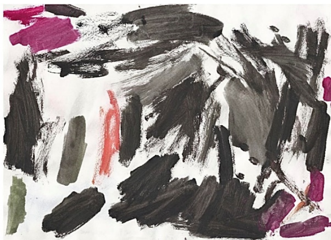
Slika 5. Marko, 4.god.

Na ovome crtežu dječak je nacrtao svoga oca koji se s broda vraća kući. Vrlo mu je nedostajao pa se on strašno veseli njegovom povratku. Ljubav i uzbuđenje iskazao je rozim flomasterom te dodajući mnogo srca i leptira na svoj crtež. Važnost očeve uloge u njegovom životu naglasilo je veličinom njegova lika, te ga je nacrtao skoro jednako velikim kao i kuću.