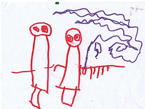
Slika 2. Paula, 4.god

Prvi dječji uradak prikazuje likove na način koji su karakteristični za fazu primarnih simbola. Svoju obitelj koja za dječaka predstavlja sreću nacrtao je koristeći nepravilne krugove i linije. Nije vidljiva ekspresija lica. Likovi su posloženi od najvećeg prema najmanjem, čime dijete ukazuje na važnost likova u njegovom životu. Iako su dječaku ponuđene različite likovne tehnike i između ostalog različite nijanse olovaka u boji on se odlučio samo za plavu.