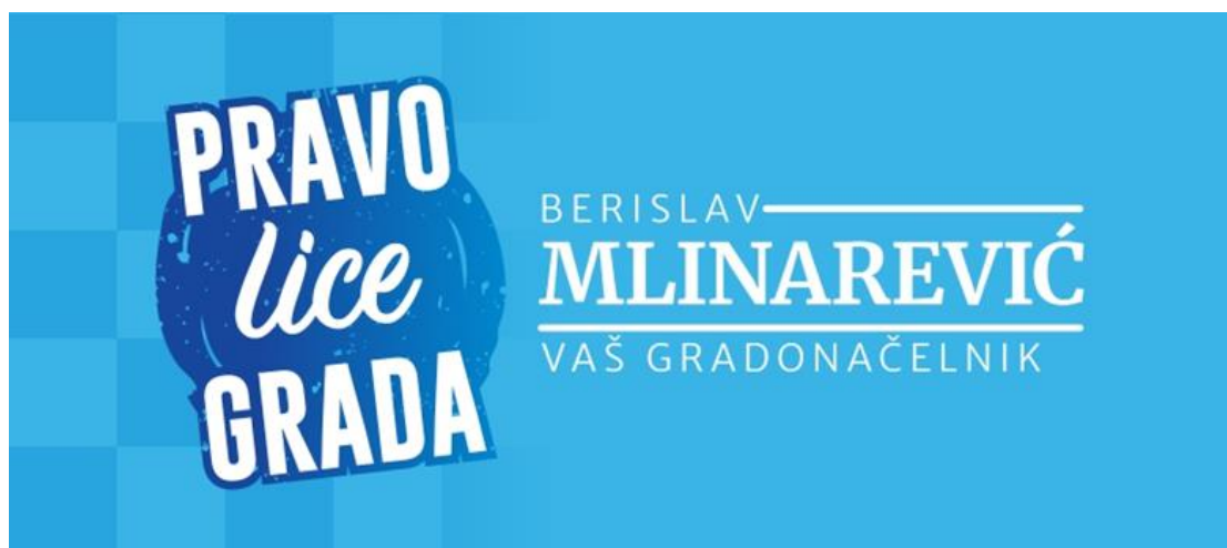
Slika 2 Plakat Pravo lice grada