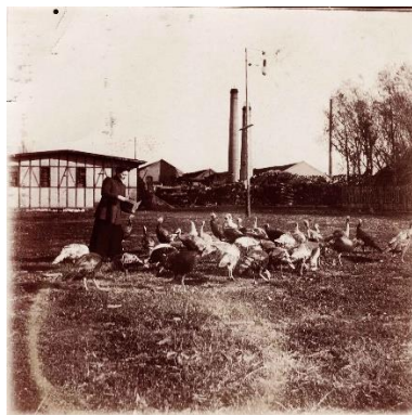
Slika 3. Katarina Hepburn u dvorištu tvornice