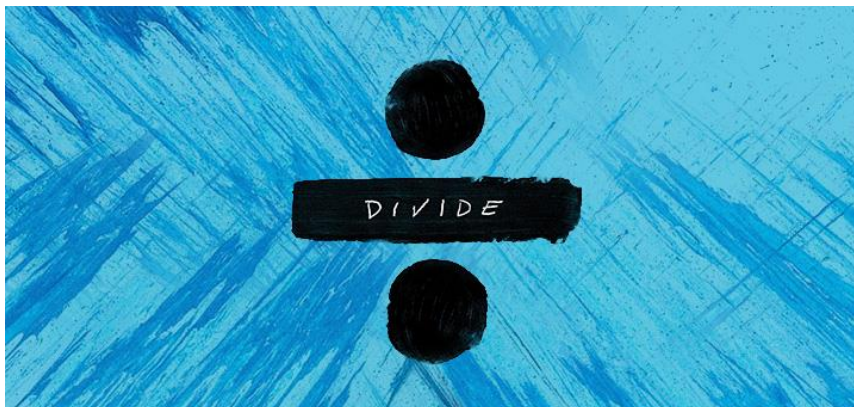
Slika 3. Logotip albuma Divide Eda Sheerana

Ova jednostavna najava pokazala je da je Ed Sheeran planirao svoj povratak u glazbenu industriju i htio je biti siguran da svijet zna za to. Video je iznenadio njegovu publiku, a on je sljedeći dan izbacio novi video na Facebooku. Sadržavao je riječi „Shape of You“ i „Castle on the Hill“. Iz tih videozapisa, publika je saznala tri stvari: nazive njegova prva dva glavna singla, logotip albuma je matematički simbol za podijeljeno i motiv boja je crna i plava (koji su prikazani na slici 3.).