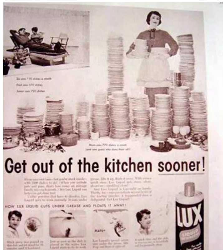
Slika 3. Prikaz žene u reklamama tijekom 50.-ih godina prošlog stoljeća

moderni ženski pokreti. Do tada, psihologija, sociologija, ekonomija i povijest napisali su muškarci, o muškarcima, za muškarce. Žene su često bile predstavljane u stereotipnim ulogama kao što su kućanski poslovi, majčinstvo i kako biti žena svom muškarcu, kao jedini smisao postojanja žene. Sve ovo možemo vidjeti na posterima iz 50.-ih godina: