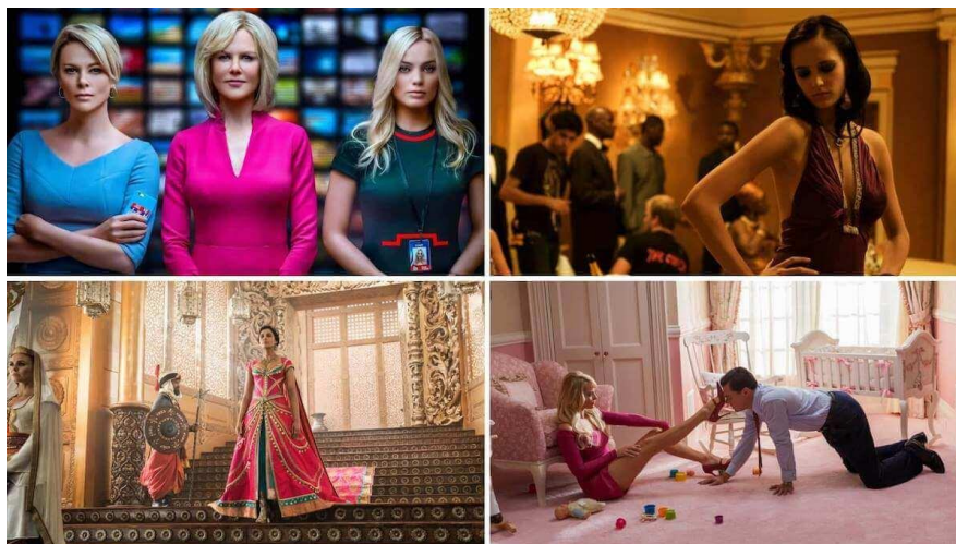
Slika 8. Muški pogled u filmovima

Kao što autorica navodi u svom eseju (Murvey, 1988) u svijetu uređenom seksualnom neravnotežom, zadovoljstvo gledanja podijeljeno je između aktivno/muško i pasivno/žensko. Isto tako, odlučan muški pogled projicira svoju fantaziju na žensku figuru koja je stilizirana u skladu s tim. „U svojoj tradicionalnoj egzibicionističkoj ulozi žene su istovremeno promatrane i prikazane, s njihovim izgledom kodiranim za snažan vizualni i erotski učinak tako da se može reći da konotiraju gledanost. Žena prikazana kao seksualni objekt lajtmotiv je erotskog spektakla: od pin-upa do striptiza, od Ziegfelda do Busbyja Berkeleyya, ona zadržava pogled, igra i označava mušku želju. Mainstream film uredno spaja spektakl i narativ“ (Murvey, 1975). Od svog početka, muški pogled je sezao dalje od filmskog platna te se ne odnosi samo na to kako muškarci vide žene u filmovima već i u stvarnom životu, od toga da ih se doziva na ulici, da ih se naziva „sponzoršama“ ako se udaju iznad svog socioekonomskog statusa i slično. Nadalje, česta briga o svom izgledu i privlačnosti, doimanju prepametnima ili o tome kako će biti viđene se također smatra življenjem pod muškim pogledom.