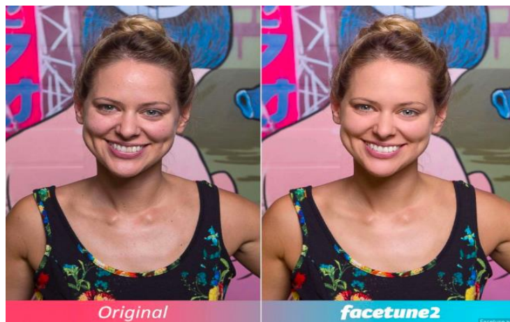
Slika 9. Prikaz originalne i retuširane fotografije

Good Morning America u svom članku (2018) spominje aplikacije, kao što su Facetune i Facetune 2, preko kojih je moguće izbijeliti zube, stanjiti noge, smanjiti stomak, povećati stražnjicu, ukloniti prištiće na licu i još mnogo toga. Također, navode kako su psiholozi zabrinuti na učinak ovakvih aplikacija na mentalno zdravlje mladih ljudi te „prema nedavnom istraživanju objavljenom u International Journal of Eating Disorders, 91% tinejdžera koji koriste društvene mreže objavljuje svoje fotografije. Štoviše, istraživanje je zaključilo da su oni s visokim ocjenama za manipuliranje svojim fotografijama također bili povezani s visokim ocjenama za brige vezane uz tijelo i prehranu. (...) Klinički psiholog dr. Ramani Durvasula rekao je za „GMA” da „što više ljudi gledaju retuširane slike, veća je vjerojatnost da će zapravo početi tražiti kozmetičke zahvate" u mlađoj dobi” (GMA, 2018).