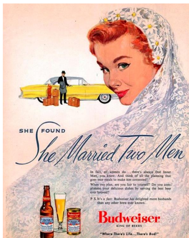
Slika 4. Primjer savjetovanja žena