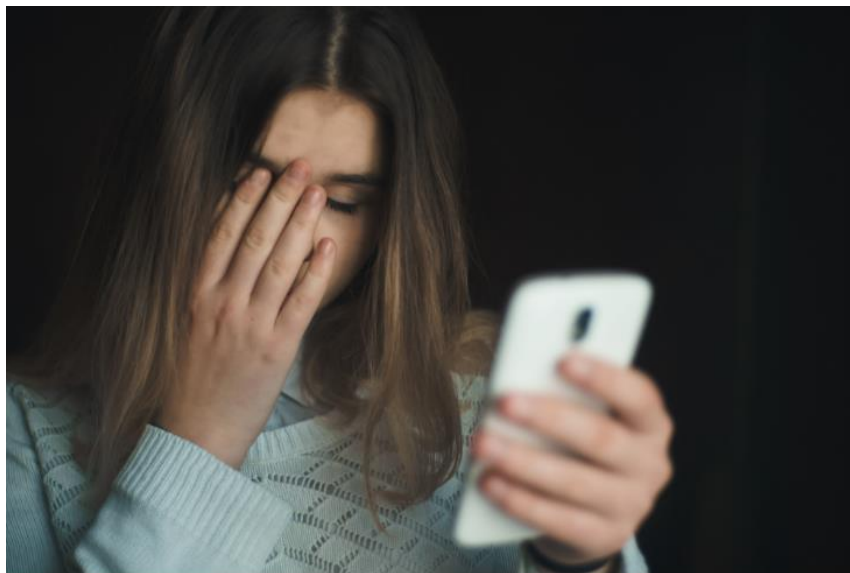
Slika 1. Utjecaj društvenih mreža na mentalno zdravlje

„Kako je adolescencija karakterizirana kao razvojno razdoblje povećane usredotočenosti na sebe, povratne informacije vršnjaka i socijalne usporedbe postaju sastavni dio samoevaluacije adolescenata. Zapravo, samopouzdanje adolescenata može biti osjetljivo na broj lajkova koje dobiju kao odgovor na svoje objave na društvenim mrežama, kao i na broj lajkova koji mogu dobiti njihovi vršnjaci” (Desjarlais, 2019: 290). Autorica navodi kako postoje štetni učinci društvenih mreža, pogotovo kada su u pitanju povratne informacije koje korisnik dobiva i uspoređuje ih s povratnim informacijama koje drugi korisnici dobivaju, što naposljetku utječe na samopouzdanje korisnika, bilo ono pozitivno ili negativno.