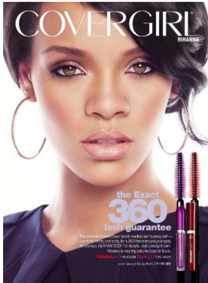
Slika 7. Prikaz oglašavanja u ženskom časopisu