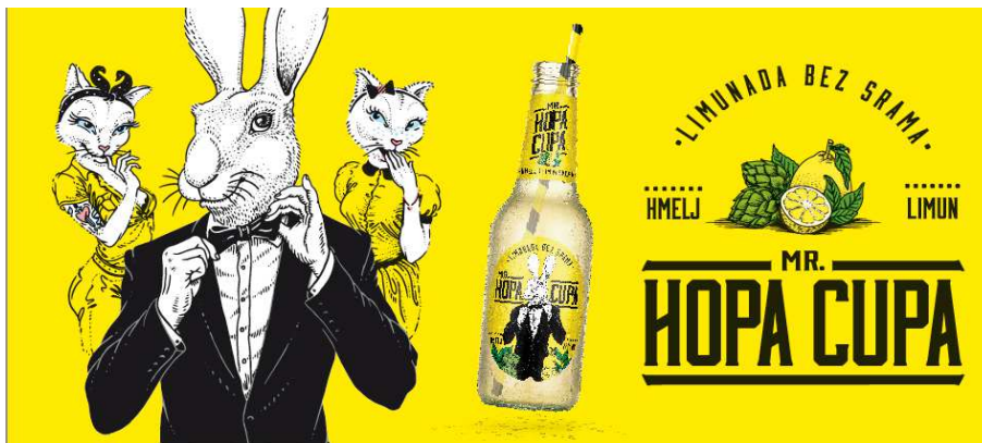
Slika 4. Limunada bez srama