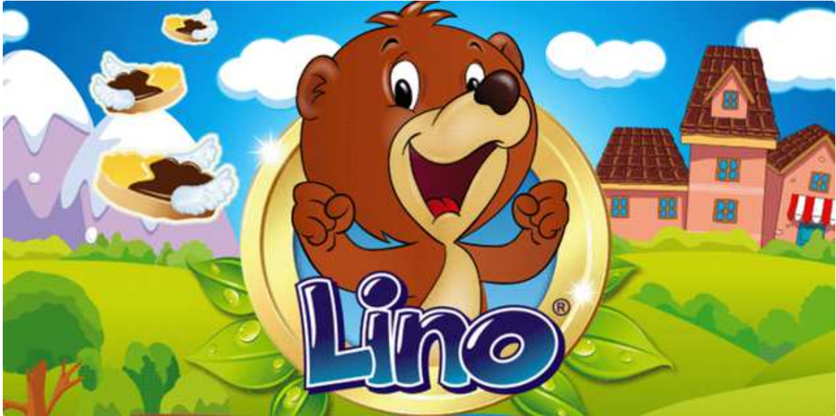
Slika 9. Medvjedić Lino