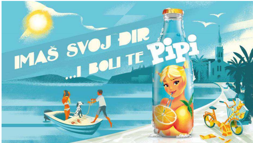
Slika 3. Papi