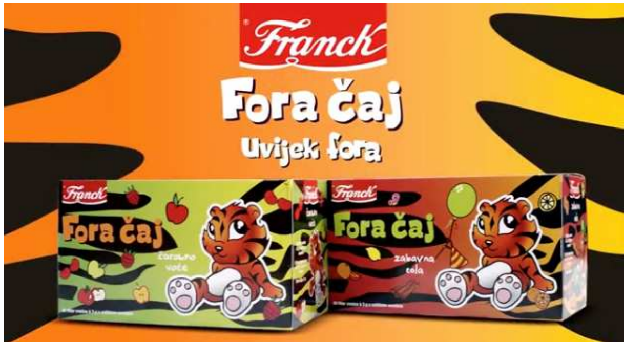
Slika 8. Franck fora čajevi