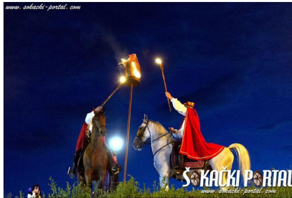
Slika 9: Manifestacija „Kod konjarskih vatri“

kolovozu 2021. godine, u dvorištu Muzeja, premijerno je prikazan i istoimeni dokumentarno-igrani film.