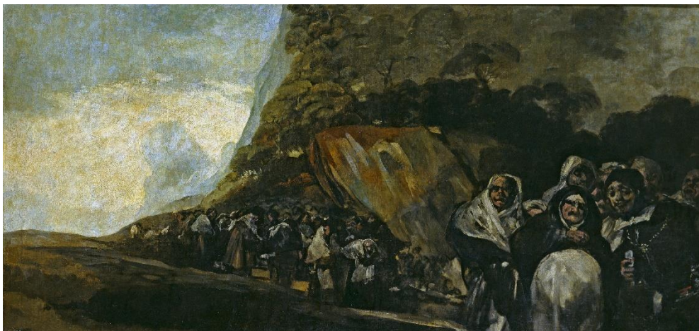
Slika 12 „Procesija svetog oficija“

„Procesija svetog oficija“, ili La romeria de San Isidro . Pozadina slike izgleda lijepo i mirno, dok su izrazi lica ljudi jako uznemirujući i neugodni. Malo se toga zna o ovoj slici. Vjeruje se da je sličnog motiva kao i „Hodočašće u San Isidro“.