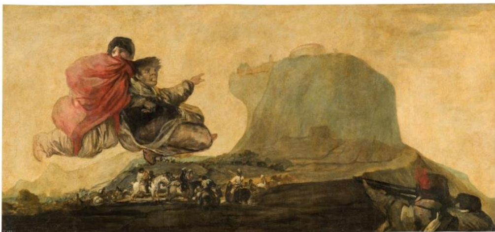
Slika 15 „Asmodea“

„Fantastična vizija“, ili Asmodea . Slika prikazuje stijene u pozadini i dvije figure koje lebde u zraku i izgledaju prestrašeno te pokazuju prema stijeni. Također, prikazani su vojnici koji nemirno trče prema stijeni. Smatra se da je i ova slika prikaz groznog stanja Španjolske u tom vremenu.