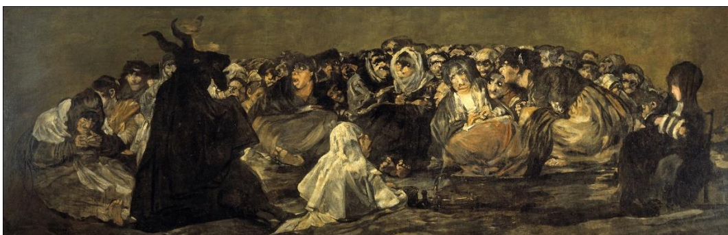
Slika 6 „Vještičji Sabat“

„Vještičji sabat“ ili Aquelarre . Goya je i ranije napravio sličnu sliku, u kojoj su vještice prikazane kao uznemirujuća usporedba staroga i mladoga. Neke imaju mlada i zdrava lica, dok su neka lica neugodno izobličena, pa čak i bebino, koju druga figura drži u zraku radi blagoslova. Ova slika je čisti prikaz sotone, koji se prikazuje kao crni jarac. Lica su izobličena ili u strahu. Inkvizicije koje su bile provedene u to vrijeme, smetale su vrlo religioznog Goyu, pa ovom slikom on osuđuje religiju i državu, koje pokušavaju vladati šireći strah.