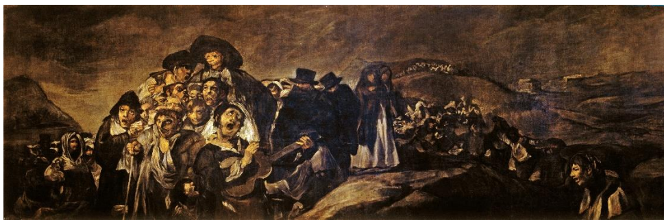
Slika 10 „Hodočašće u San Isidro“