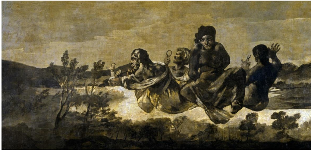
Slika 3 „Atropos“