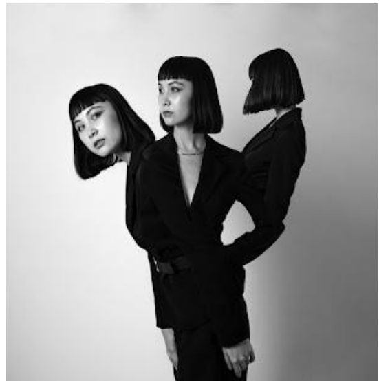
Slika 6. RED Dao „Summer Sun - Gesture 1”