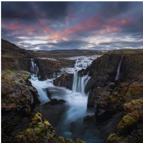
Slika 5. The Metascapes „Metascapes #398”