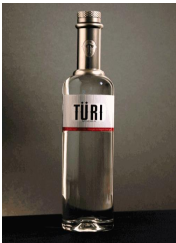
Izvor 4.. http://www.kentbarns.com/package.php

Primjer undercover marketinga: na privatnoj zabavi za mlade u Philadelphiji vlasnik kluba cijelu je večer točio piće nazvano Türi Vodka. Ta marka bila je u vlasništvu Baccardi, te su je kao novi proizvod odlučili plasirati na tržište zasićeno različitim markama vodke. Baccardi je preko agencije angažirao klub s ciljem da je predstavi tržišnom segmentu mladih na način da se onemogućí prodaja drugih vrsta vodke. Piće nije isticano na boci, nije nuđena po posebnoj cijeni, o njemu nije posebno pričano i sl. Samo se posluživala cijelu večer. Gosti nisu bili svjesni da se tako reklamira nova marka. S druge strane, Baccardi je uz minimalni trošak realizirao neobičnu promociju i gostima ovo piće pozicionirao u podsvijesti, te su isto piće naručivali tijekom slijedećih dolazaka, a sugerirali su ga i svojim prijateljima. Tako se stvara brujanje (eng. buzz) u vezi novog proizvoda (Türi Vodka).